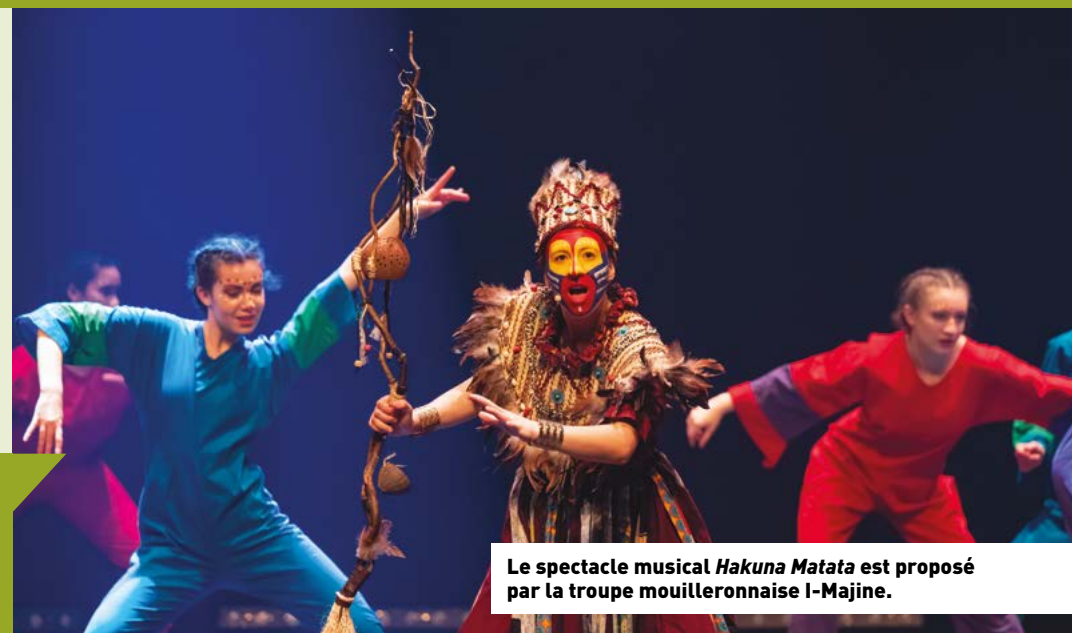
Le spectacle musical Hakuna Matata est proposé par la troupe mouilleronaise I-Majine.

Du 3 au 12 août Bois-de-Céné – Châteauneuf festivalilechauvet.fr