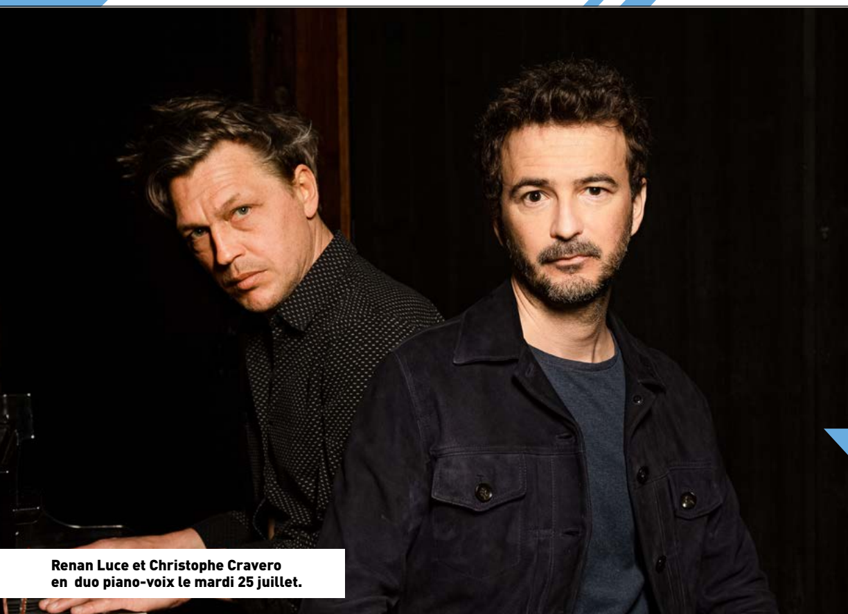
Renan Luce et Christophe Cravero en duo piano-voix le mardi 25 juillet.