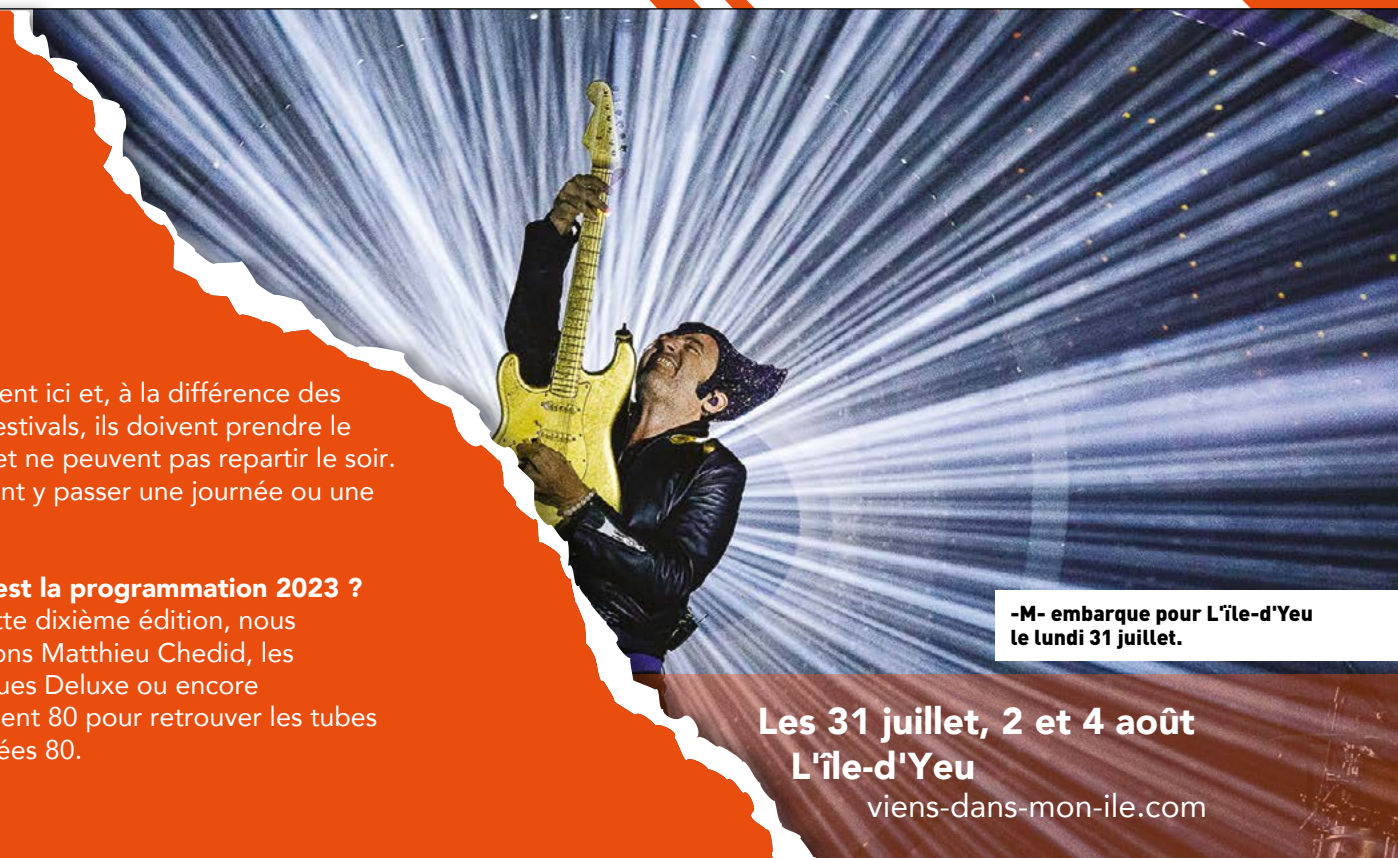
-M- embarque pour L'île-d'Yeu le lundi 31 juillet.

Quelle est la programmation 2023 ? Pour cette dixième édition, nous accueillons Matthieu Chedid, les énergiques Deluxe ou encore Totalement 80 pour retrouver les tubes des années 80.