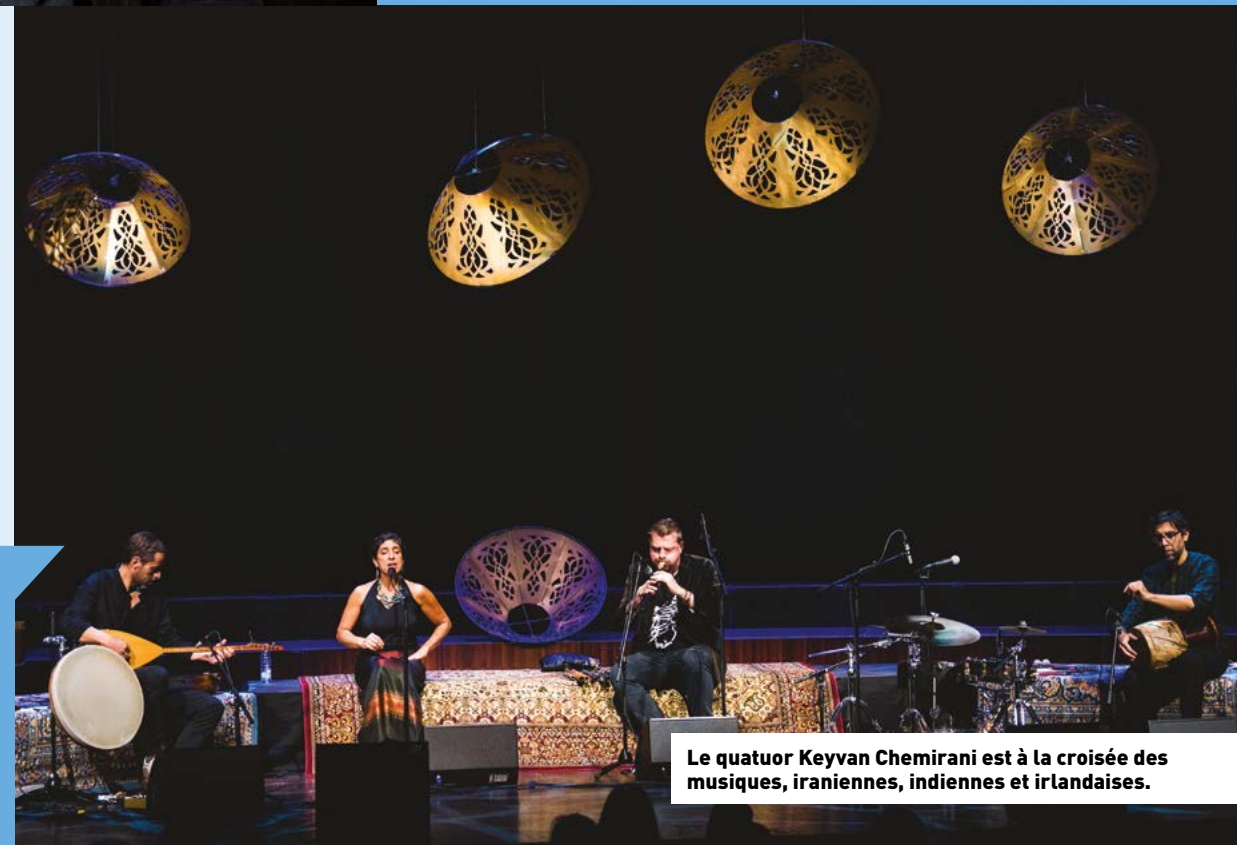
Le quatuor Keyvan Chemirani est à la croisée des musiques, iraniennes, indiennes et irlandaises.

Du 17 juillet au 14 août Prieuré de Grammont - Saint-Prouant Réservation sur evenements.vendee.fr ou au 02 28 85 85 70 Adultes : 14€ / 7 à 26 ans : 10€ / -7 ans : gratuit / Formules 2 à 5 concerts au choix