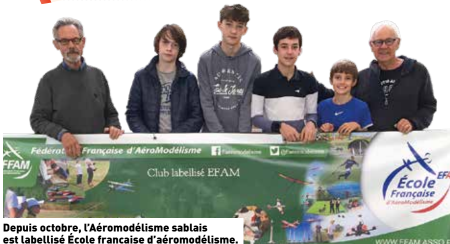
Depuis octobre, l'Aéromodélisme sablais est labellisé École française d'aéromodélisme.

Qu'il soit pratiqué en intérieur ou en extérieur, l'aéromodélisme est un sport qui séduit beaucoup de Vendéens, des jeunes et des moins jeunes.