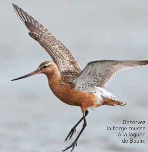
Observez la barge rousse à la lagune de Bouin.

pour beaucoup d'espèces qui s'y installent durablement. Par exemple, le Marais breton vendéen est le premier site français de nidification de cinq espèces nicheuses dont la barge à queue noire: 90 % des effectifs nationaux de cette espèce nichent en Vendée. Le grand capricorne et le lucane cerf-volant, deux coléoptères communs, ont quant à eux trouvé refuge dans les bois morts de la forêt de Mervent-Vouvant. Dans les marais du Jaunay, à Givrand, plusieurs espèces de papillons, comme l'azuré des anthyllides, utilisent comme plante hôte le trèfle des prés, espèce très commune de ce type de milieux naturels.