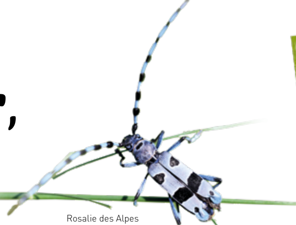
Rosalie des Alpes

Située entre le massif armoricain et le bassin aquitain, entre Mauges et Marais poitevin, la Vendée fait partie de ces départements littoraux qui se démarquent par leur biodiversité. En effet, la nature vendéenne offre un large éventail de paysages au cœur desquels se développent une faune et une flore exceptionnelles.