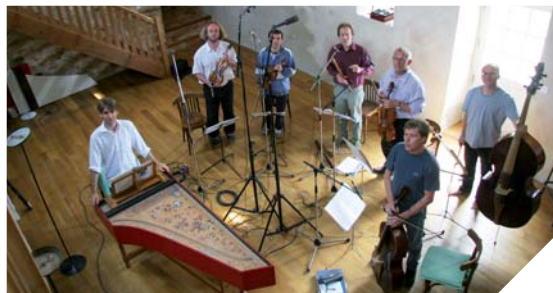
En octobre, la Simphonie du Marais fête ses 25 ans avec un concert exceptionnel à Montaigu et la sortie d'un nouvel opus : Nais, opéra pour la paix.