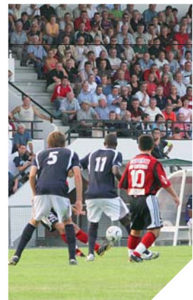
L'opération « stade sans tabac » est une première en France.