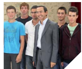
Bruno Retailleau, président du Conseil général rencontre les jeunes en formation.

Pour la rentrée 2012, six nouvelles formations sont proposées par les Maisons familiales rurales de Vendée avec toujours cette pédagogie de l'alternance au cœur du cursus. « Apprendre sur le terrain, faire le lien avec les cours, découvrir la réalité des métiers... », dans cette période économique difficile, les élèves des Maisons familiales rurales sont les premiers à reconnaître que l'alternance permet de mieux s'insérer dans la vie professionnelle. Une réalité qui se vérifie par les chiffres. Une récente étude portant sur près de 2000 jeunes montrent ainsi que plus de 61 % ont un emploi et près de 30 % poursuivent leur formation. En 2012, les MFR proposent plusieurs nouveautés: Technicien agricole (St Martin-de-