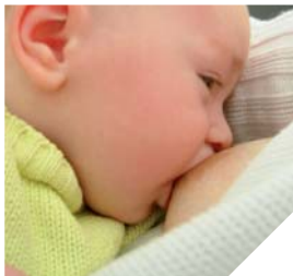
Dans le cadre de la semaine mondiale de l'allaitement, des rencontres sont organisées sur toute la Vendée.

Le temps d'un après-midi, les parents pourront donc prendre le temps d'échanger. Une bonne occasion pour mieux connaître ce mode d'alimentation qui présente de nombreux avantages. Bon pour la santé de l'enfant, il est recommandé par l'Organisation Mondiale de la Santé. Mais ses avantages ne s'arrêtent pas là. L'allaitement est également un mode d'alimentation souple qui favorise la proxi-