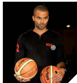
Tony Parker, dit TP, était là en Vendée !