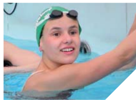
La benjamine de l'équipe de France a tenu parole en disputant deux finales londonniennes. Chapeau.

Renseignements : http://nyra85.asso-web.com