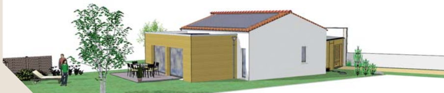
Une bonne orientation alliée à des solutions techniques innovantes permettent de réaliser une maison passive.

tre la surface vitrée et le volume, poursuit l'architecte. Sur le littoral, l'ensoleillement est important, la surface vitrée sera donc moindre que pour une maison localisée dans le bocage par exemple ». D'un point de vue technique, pour arriver à une bonne inertie thermique du bâtiment, un double mur est mis en œuvre. Enfin, les panneaux photovoltaïques situés sur le toit permettent de produire de l'énergie et ainsi d'équilibrer les consommations du logement.