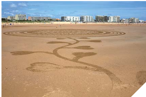
Les fresques réalisées par Michel Jobard ne restent visibles que quelques heures. Elles sont ensuite recouvertes par la marée.

Pour Michel Jobard, les plages de Vendée sont des espaces qui l'inspirent. Muni d'un grand compas, d'un râteau et d'une ficelle, il réalise des fresques à couper le souffle sur plusieurs centaines de mètres. Rencontre.