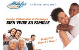
L'UDAF propose une formation gratuite et ouverte à tous pour mieux vivre sa famille.

Renseignements : www.udaf85.fr , 02 51 44 37 00