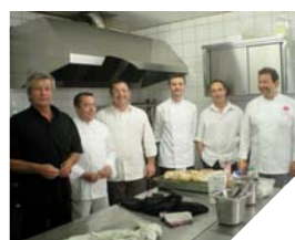
L'opération « cuisinons ensemble » permet de déguster un menu élaboré par différents chefs.

Déguster un menu dont chaque plat est préparé par un chef différent, telle est l'idée originale proposée dans le Sud Vendée.