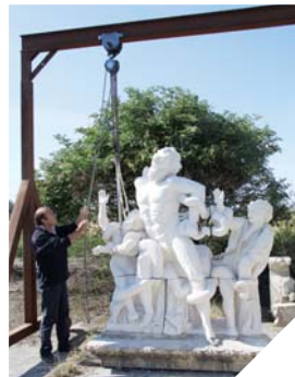
Le groupe de sculptures du XVII e représente le Laocoon et ses fils dévorés par des serpents de mer.