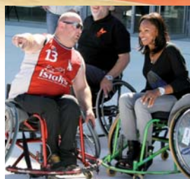
Laura Flessel initiée au handispport.