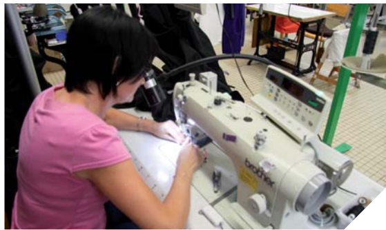
Beaucoup d'entreprises vendéennes du secteur de la confection évoluent et forment leur personnel pour pouvoir conquérir de nouveaux clients dans le domaine du luxe.