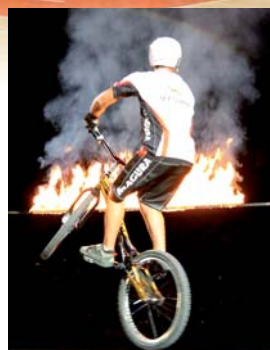
Soirée Sports Extrêmes époustouflante.

athlète français à avoir dépassé la barre des 6 mètres. Chaque fois que je suis venu faire une compétition en Vendée, j'étais très excité et très motivé. Les enfants, il va falloir que vous rapportiez de nombreuses médailles. Avec un tel lieu pour pratiquer, vous n'avez plus d'excuse pour ne pas être champion. Je suis sûr que ce site va créer des vocations ». Mais il y a eu aussi Nicolas Mahut et Arnaud Clément. Les tennismen ont été les premiers à disputer un