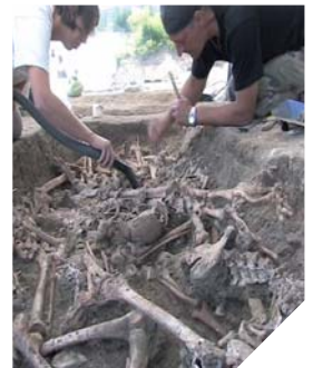
Les fouilles archéologiques du Mans donnent de riches enseignements sur l'un des épisodes majeurs de la guerre de Vendée.

Cette soirée affirmera ou non les premières hypothèses dévoilées en mai 2011, lors d'une première conférence à l'Historial, suite aux premières fouilles effectuées au Mans.