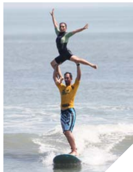
Le surf tandem permet de partager le plaisir de surfer.