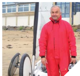
Chaque participant au défi est invité à se prendre en photo avec date et heure, preuve de leur trajet.

Renseignements : 06 88 45 68 56 (Comité Départemental de Char à voile); cdcav85@club-internet.fr ou csimoens@club-internet.fr