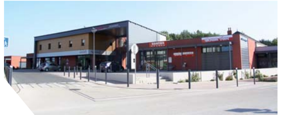
Le pôle commercial situé au cœur du bourg a permis d'attirer de nouveaux commerces.

Boulangerie, superette, salon d'esthétique, fleuriste, salon de coiffure... Dans quelques mois, ces commerces seront également rejoints par le café du village qui rallie le nouveau pôle commercial situé en plein cœur du bourg de La Genétouze. Une opération qui confirme la renaissance du centre-bourg de cette petite commune vendéenne de 1 760 habitants.