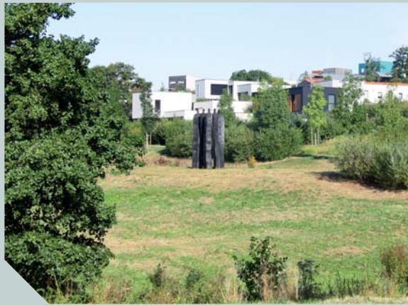
Le Val de la Pellinière est situé dans un écrin de verdure de 9 hectares.