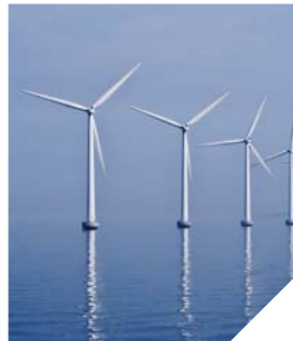
L'appel d'offres pour le projet d'éolien offshore vendéen est prévu pour la fin de l'année.

On vient de l'apprendre, le deuxième appel d'offres pour l'éolien en mer sera lancé à la fin de l'année. Cet engagement pris par le précédent gouvernement