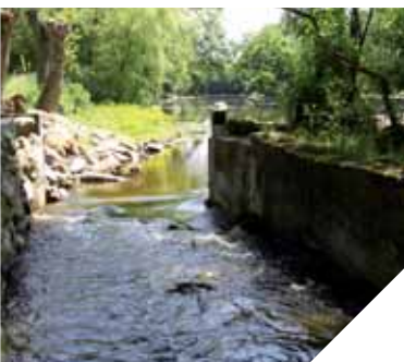
Des travaux sur la Petite Maine ont permis de la rendre plus « courante ».

jour comme sur la Petite Maine, à St-Hilaire-de-Loulay, où le syndicat mixte du bassin des Maines Vendéennes a réalisé une brèche dans la chaussée St Charles. Grâce à l'ouverture, sa pente légère et ses blocs de granit, les différentes espèces, comme le brochet, peuvent se déplacer le long de la rivière.