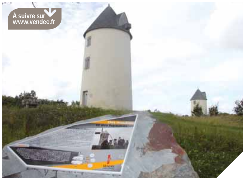
La colline des moulins fait l'objet d'aménagements qui permettent aux piétons et aux cyclistes de découvrir ce lieu emblématique de la Vendée.

Depuis cet été, de nouveaux aménagements permettent de redécouvrir à pied ou à vélo un haut lieu de la mémoire vendéenne : la colline des moulins à Mouilleron-en-Pareds. De l'histoire des moulins à l'évocation de Clemenceau et De Lattre, le vent de l'histoire souffle sur la colline.