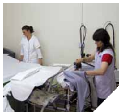
Atout Linge aide les personnes éloignées de l'emploi à retrouver un travail et à se réinsérer socialement.

Renseignements: 02 51 00 41 98, atout.linge@orange.fr