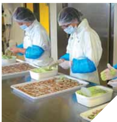
L'entreprise PMT Vendée Diffusion propose des plats cuisinés surgelés.

constamment à l'affût de la nouveauté. Notre petite taille nous permet d'être très réactifs et ainsi d'être présents sur des secteurs qui ont le vent en poupe comme le bio ».