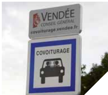
Avec le site internet et les aires de covoiturage, rien de plus simple que de covoiturer en Vendée.

Depuis la fin août, deux nouveaux points stop covoiturage ont été installés rue de la Mongie et rue de l'Arée sur le Vendéopôle de la Mongie aux Essarts et à Sainte-Florence. Ces panneaux ont pour objectif de