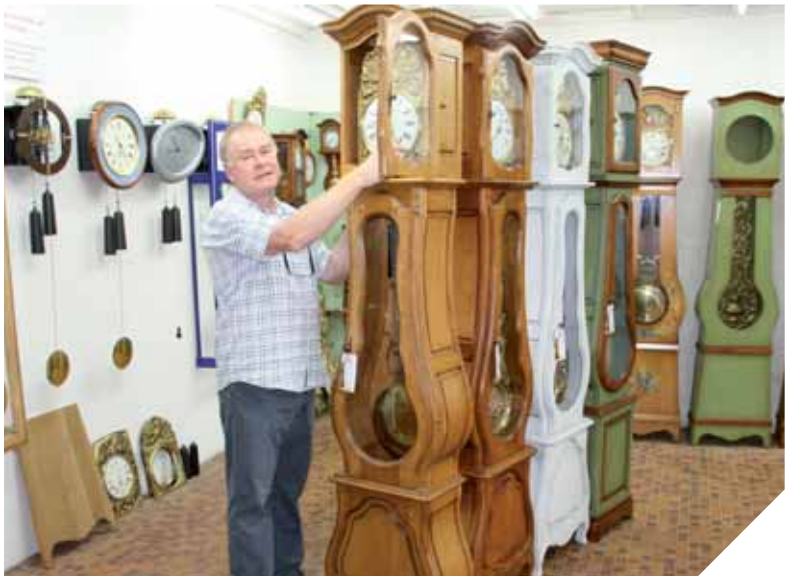
Le mode d'emploi de l'horloge comtoise est très simple. Il suffit de remonter le mécanisme une fois par semaine. Un mécanisme qui marche plusieurs centaines d'années.