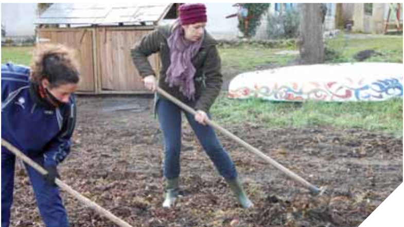
Différents stages et chantiers permettent aux stagiaires de découvrir de nombreux métiers.