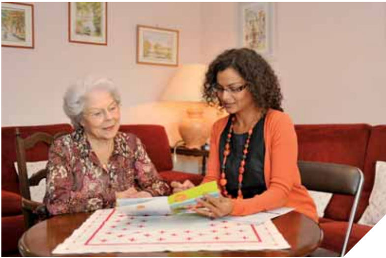
Les équipes du Clic informent, orientent, conseillent et facilitent les démarches des personnes âgées.

Clic. Derrière cet acronyme se cache une mine de services et d'informations pour les personnes âgées et leur famille. Hébergements, aide à domicile, soutien aux aidants, ateliers mémoires... les Clic coordonnent une multitude d'activités pour bien vieillir en Vendée. Zoom sur le Clic du Littoral, aux Sables-d'Olonne.