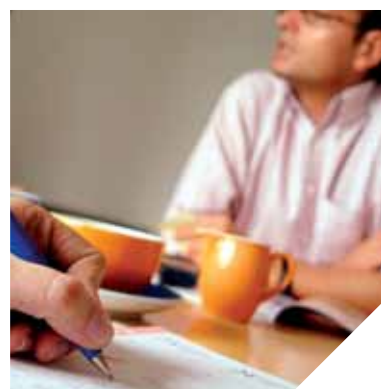
Les bénévoles de l'association EGEE proposent des simulations d'entretien d'embauche aux plus jeunes.

Cet été, c'est avec bonheur que Tranchais et visiteurs ont pu de nouveau arpenter cet ouvrage typique du paysage tranchais.