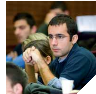
Le Cnam Vendée propose des formations qui suivent différents rythmes.

Mais une fois ouvert, le réseau fait encore l'objet de beaucoup d'attentions. Il faut trois ans en moyenne pour réaliser une piste, après nous veillons à son entretien sans aucun produit phytosanitaire et nous essayons de réagir au plus vite dès qu'il y a une dégradation ». Dans les années à venir, les projets sont encore nombreux et plusieurs années seront encore nécessaires pour terminer le réseau.