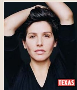
Sharleen Spiteri, chanteuse du groupe Texas.

22 septembre Les talents vendéens aux côtés de Texas!