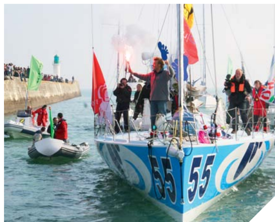
Le tournage de « En solitaire » devrait s'étaler d'octobre à décembre.

« Nous commencerons le tournage en octobre. Bien sûr, nous prendrons toutes les précautions nécessaires pour ne pas gêner les marins ». Le tournage se poursuivra ensuite en mer jusqu'en décembre. « C'est un vrai défi de tourner en mer. Pour les ambiances de mer chaude, nous tournerons vers les Canaries et pour les mers froides au large de la Norvège ». Le film distribué par Gaumont devrait sortir sur les écrans en novembre 2013. Une diffusion télé est également prévue pour fin 2014.