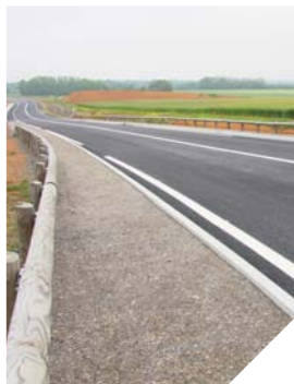
Une déviation de 5,5 km au sud de Talmont évite désormais aux véhicules de passer par le centre de la commune.

Depuis le début du mois de juin, la déviation de Talmont permet aux véhicules qui utilisent la RD 949 entre Luçon et les Sables-d'Olonne d'éviter de passer par le centre de la commune.