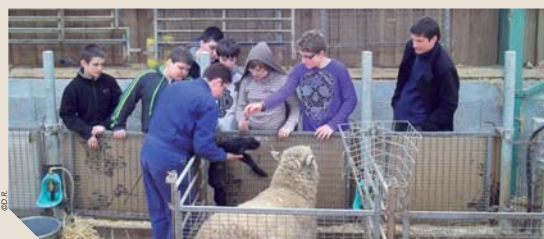
Des sorties sont régulièrement organisées pour les jeunes de l'ITEP, comme ici dans une exploitation.

À l'Institut Thérapeutique Éducatif et Thérapeutique (ITEP) L'Alouette à La Roche-sur-Yon, les deux chèvres Isis et Blanchette font l'objet de tous les soins. Les jeunes leur construisent un abri, leur donne de la nourriture et de l'affection. Pour financer ce projet, les jeunes de l'ITEP ont fabriqué puis vendu des