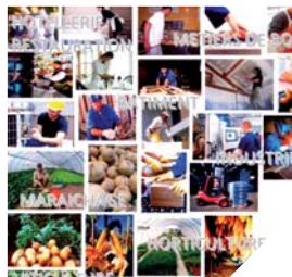
Un guide pour les travailleurs saisonniers.

L'objectif à terme de cette initiative est de faciliter la mise en place des groupements d'employeurs qui pourraient proposer à leurs employés saisonniers des contrats à durée indéterminée. Le guide est consultable dans les