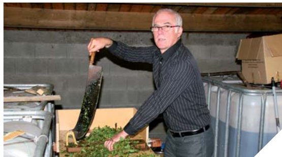
Dans les heures qui suivent leur cueillette, les pousses d'épines noires sont plongées dans l'eau de vie.