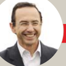
Bruno Retailleau, Président du Conseil Général