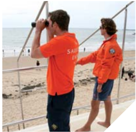
Les nageurs-sauveteurs de la SNSM assurent la sécurité jusqu'à 300 mètres au large. Au-delà, les incidents sont pris en charge par les sauveteurs en mer.

La plage du Veillon, qui peut accueillir jusqu'à 6000 personnes en plein été, est caractérisée par plusieurs sources de dangers potentiels, des rochers, une baigne (bassine), et différents courants. « Le week-end dernier, nous sommes venus au secours de deux personnes. Notre rôle est d'éviter aux nageurs de se mettre dans des situations de danger et le cas échéant de les sortir d'une mauvaise passe ». En 2011, sur l'ensemble des 19 postes de la SNSM de Vendée, 216 interventions ont eu lieu : 40 personnes sauvées