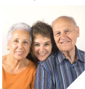
L'ADMR propose un programme de formation sur les secteurs de La Roche-sur-Yon, Mouzeuil-Saint-Martin et Maillezaix.