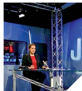
Tous les jours, l'actualité vendéenne est au cœur des programmes de TV Vendée. Ici, le plateau du journal.

Renseignements : TV Vendée est diffusée sur la TNT, chaîne 24 (canal 56), www.tvvendee.fr