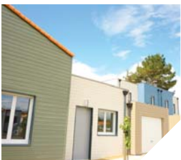
Huit logements locatifs en ossature bois ont été livrés par Vendée Habitat à Saint-Hilaire-de-Riez.

Les modules sont entièrement équipés en usine, ce qui présente de nombreux avantages : coûts