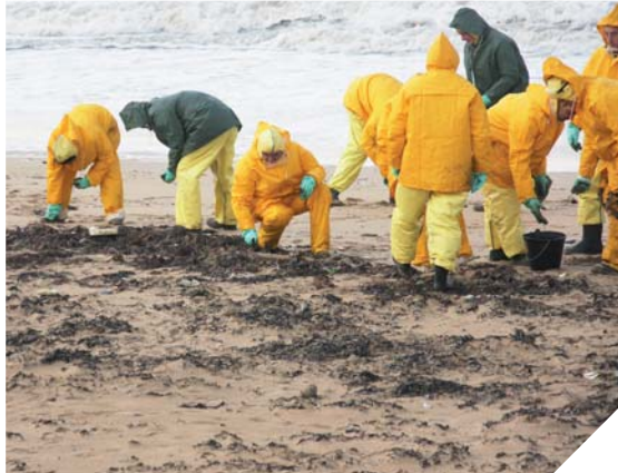
De nombreux bénévoles se sont engagés dans le nettoyage des plages.

« Quelle que soit la décision que prendra la Cour de cassation à l'automne, il est temps de sécuriser ce qui a été construit progressivement en le formalisant dans notre Code Civil, insiste Bruno Retailleau. Y inscrire le préjudice écologique et ses réparations est une sécurité indispensable ».