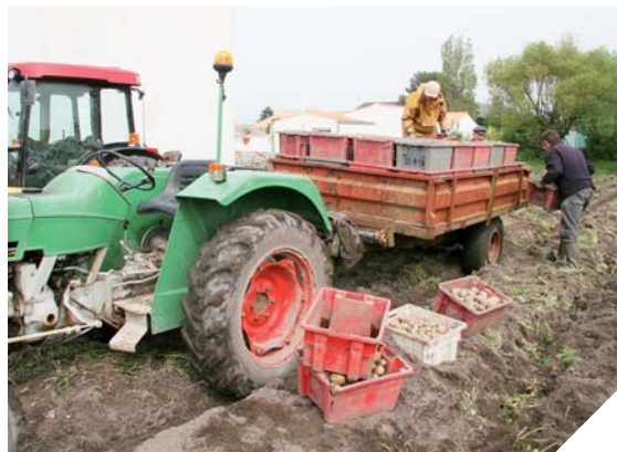
La bonnote de Noirmoutier est récoltée à la main depuis des décennies. Sa petite taille et sa forme atypique ne permettent pas une récolte à la machine.

« bonnote »? « Le mystère demeure sur ce nom de bonnote, poursuit le directeur de la coopérative. Des archives datant des années 20 la mentionnent déjà mais sans donner d'explication sur son nom. Bonnote, avec cet orthographe, est un nom de famille de l'île, peut-être le nom de celui qui aurait déposé cette variété? »