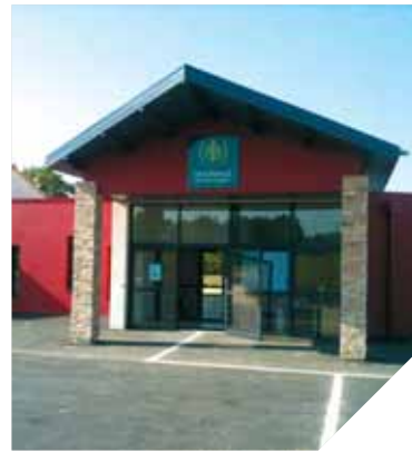
Les Saisonales, une solution pour l'hébergement temporaire.

Formule inédite de l'hébergement des personnes âgées, deux maisons de vie « les Saisonales » sont en phase d'expérimentation dans les communes de Saint-Fulgent et Olonne-sur-Mer. Dédiées à l'hébergement temporaire, les résidents n'y sont accueillis que pour des séjours de trois mois maximum, renouvelables une seule fois. Elles répondent à un véritable besoin qui ne pouvait jusqu'à présent être pris en compte. Faute de place, l'accueil temporaire ou dans l'urgence ne pouvait être assuré. La solution consistait souvent à placer la personne en maison de retraite