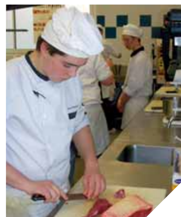
Les apprentis du CFA de St-Michel-Mont-Mercure partent dans toute l'Europe.

AU CFA des métiers de bouche à St-Michel-Mont-Mercure, les apprentis partent trois semaines à l'étranger au cours de leur cursus. L'occasion d'une expérience