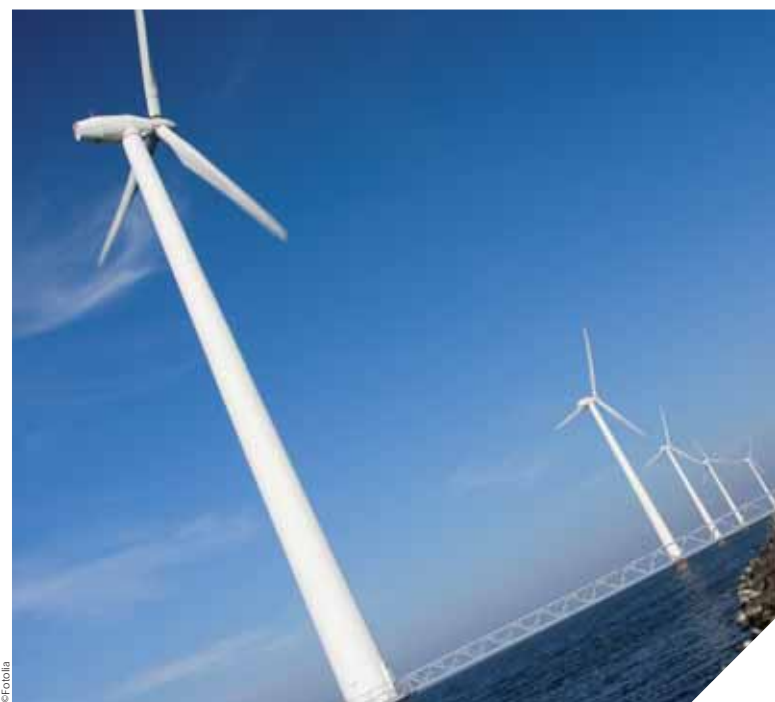
Pour maximiser les retombées économiques du projet éolien vendéen en mer les entreprises vendéennes s'organisent en filière économique.

« Ce que nous voulons dès aujourd'hui, c'est organiser un réseau capable d'entraîner dans son sillage d'autres entreprises vendéennes susceptibles d'avoir des débouchés », ajoute Bruno Retailleau.