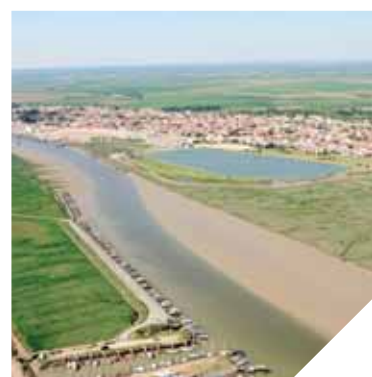
L'Union Européenne a apporté une aide financière pour les victimes de la tempête Xynthia du département.

Compte tenu de cet engagement pris, l'Union Européenne a accepté en janvier 2011 d'apporter une aide financière au Département au titre du Fonds de Solidarité de l'Union Européenne. Ainsi, plus de 3 M€ ont été attribués au département pour 40 dossiers présentés au titre de ce fonds, pour des dépenses engagées par la collectivité sur le territoire de dix communes éligibles pour des biens non assurables.