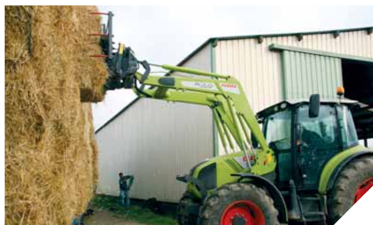
Livraison de 40 tonnes de paille sur l'exploitation de Michel Nicolleau, au Bourg-sous-la-Roche.

paille) ont été livrées en Vendée, en quelques mois. Des camions sont même venus d'Espagne.