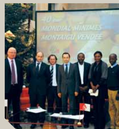
Les élus vendéens aux côtés des représentants de l'équipe Foot Solidarité Afrique.

Le Mondial Minimes Montagu Vendée a lieu, cette année, du 3 au 9 avril. Cette 40 e édition, très attendue par les amateurs de ballon rond, met en compétition 12 équipes, issues des 4 continents, pour le Challenge des Nations: POULE A: France/Cameroun/États-Unis; POULE B: Portugal/Mexique/Émirats Arabes Unis; POULE C: Angleterre/Maroc/Japon et POULE D: Russie/Côte d'Ivoire/Chine. Le tirage au sort pour le Challenge des Clubs a donné ces résultats: POULE 1: FC Nantes/AJ Auxerre/US Dallas (USA)/FC Cologne; POULE 2: AS St-Étienne/Stade Rennais/EC Bahia (Brésil)/Foot Solidarité Afrique; POULE 3: G Bordeaux/Sélection de Vendée/Profil FC (Ouganda)/FC Boavista (Portugal).