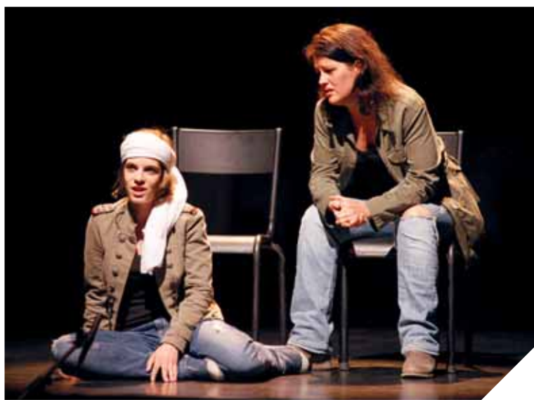
De 109 ans à quelques mois, les troupes de théâtre amateur de Vendée ont chacune leur propre histoire et leurs spécificités.

Qu'elles aient 109 ans comme celle de la Génétouze ou quelques mois, les troupes attirent les comédiens amateurs pour l'ambiance qui y règne. « C'est