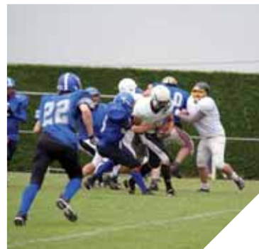
Les Squads, équipe de football américain de La Roche-sur-Yon entrent dans l'univers de la compétition.

La toute jeune équipe de football américain, les Squads de La Roche-sur-Yon, s'apprête, pour la première année, à affronter les autres équipes régionales.