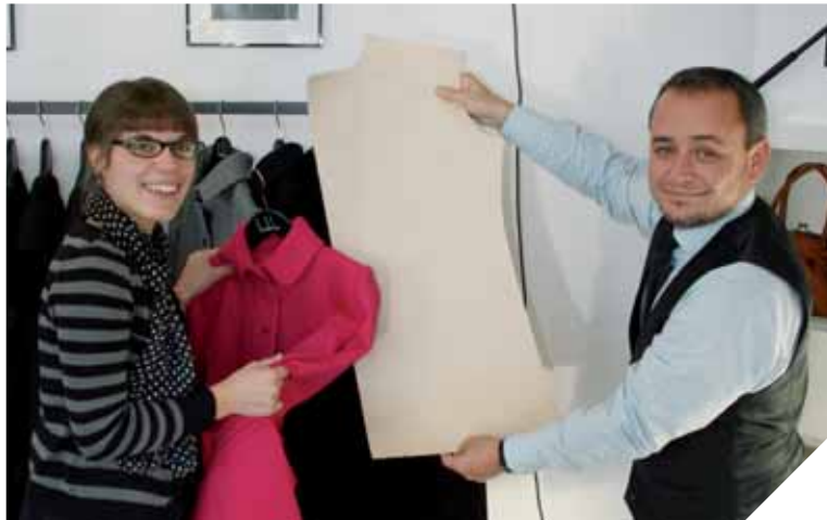
Bouche Bée pour les femmes, Monsieur Strozza pour les hommes, les deux maisons de couture vendéennes s'unissent sous une même enseigne Le Mod.

De fil en aiguille la marque prend de l'ampleur lorsqu'au début de l'année 2011, Monsieur Strozza rencontre Bouche Bée, créée par Blandine Barré, jeune vendéenne. Cette ligne féminine est basée sur le même principe: des vêtements