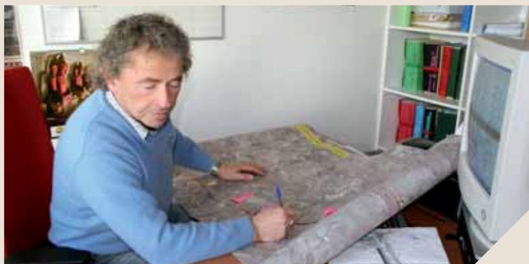
Les techniciens des routes veillent bien en amont des chantiers à la sécurité, la fluidité et la visibilité des routes du département.

viron 2,5 %, les voitures ne pourraient jamais rouler à 90 km/h sans faire d'aquaplaning », ajoute Marc Vialard. Autre préoccupation des techniciens, en plus de la signalisation et des aménagements paysagers, l'assainissement des eaux. D'une part, l'eau de la chaussée doit être traitée avant de repartir dans la nature. D'autre part, les eaux alentours ne doivent jamais inonder la voie.