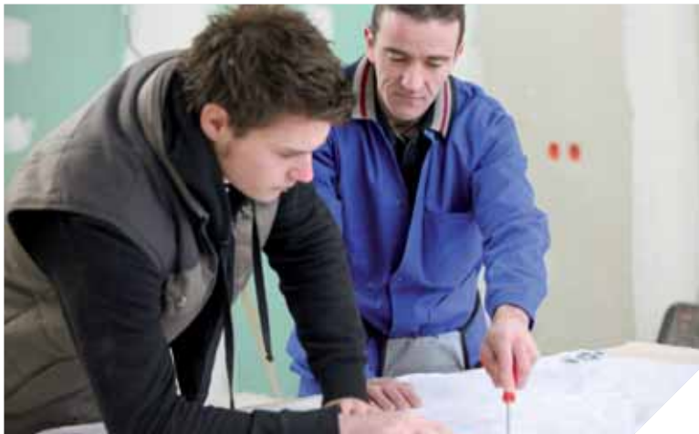
Les jeunes de Réussir Vendée seront amenés à découvrir le métier qui leur convient.