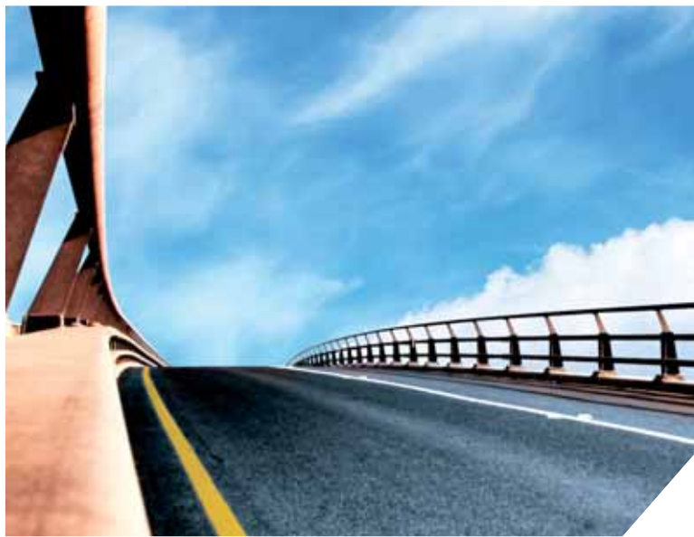
Quatre scénarii de ponts sont mis en avant pour ce nouveau franchissement de la Loire, deux à l'Ouest et deux à l'Est de Nantes.

Quatre scénarii de ponts, étudiés par l'État, sont d'ores et déjà exposés: deux à l'Ouest de Nan-