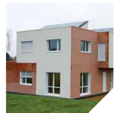
Le bâtiment d'Axénergie produit plus d'énergie qu'il n'en consomme.

Un an après l'ouverture, le bilan est supérieur aux prévisions. La consommation d'énergie a été de 3483 kWh alors que la production d'énergie des capteurs photovoltaïques a été de 4406 kWh. Un résultat qui est le fruit d'un travail sur l'isolation, l'orientation, la mise en place de puits géothermiques, d'une VMC double flux, ainsi que de nombreuses autres techniques et astuces. Ainsi, même la chaleur du local technique est utilisée pour chauffer les bureaux en hiver. « Ce projet innovant a été soutenu par