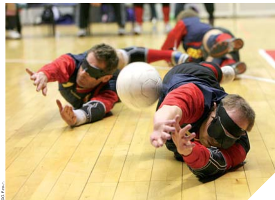
Les joueurs de torball ont dix minutes pour marquer le plus de buts en s'orientant sur le terrain grâce au ballon sonore.

sport que nous proposons depuis plusieurs années dans le cadre de démonstrations par exemple, ex-