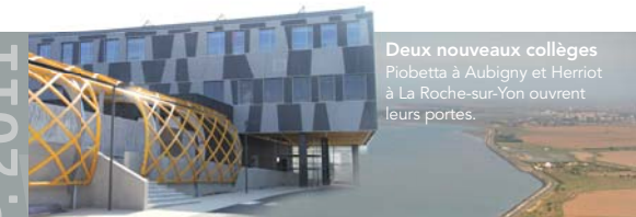
Deux nouveaux collèges Piobetta à Aubigny et Herriot à La Roche-sur-Yon ouvrent leurs portes.

Notre modèle vendéen possède les atouts pour surmonter la crise, qui n'est pas seulement économique et financière, qui est aussi une crise des valeurs. Mais cette crise passera, et il faudra être au rendez-vous de la reprise. La Vendée y sera, croyez-moi ; Comme tous les Vendéens, notre équipe départementale y travaille chaque jour.