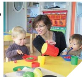
La micro-crèche peut accueillir dix enfants en même temps.