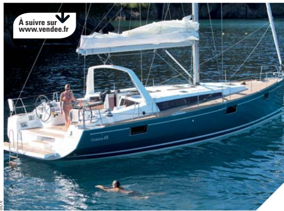
Pour remporter de nouveaux marchés, les entreprises nautiques vendéennes multiplient les innovations comme ici, l'Océanis 48, l'une des nouveautés de Bénéteau.

de bateaux neufs stable. Les marchés traditionnels sont en mutation. L'Europe du Nord demeure un marché porteur, l'Allemagne redémarre mais la reprise se fait attendre aux États-Unis. Plus que jamais, le grand export constitue un relais de croissance significatif, mais contraignant pour les entreprises qui doivent être en mesure d'aborder des marchés porteurs lointains comme l'Asie, le Pacifique, les Émirats Arabes Unis et l'Amérique Latine, et en même temps continuer à disposer d'une offre adaptée à la demande locale, tant en terme de prix que