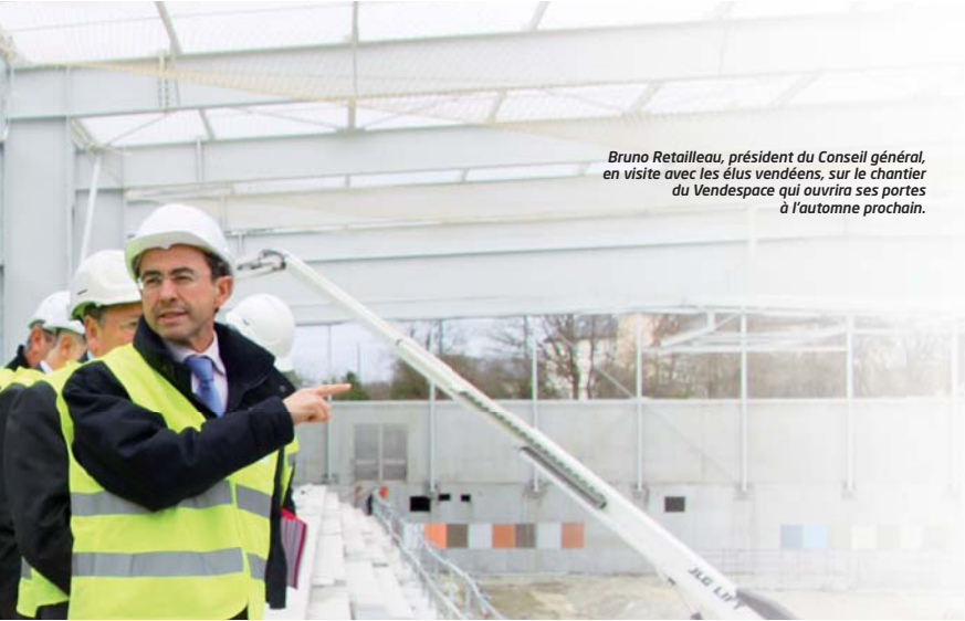
Bruno Retailleau, président du Conseil général, en visite avec les élus vendéens, sur le chantier du Vendespace qui ouvrira ses portes à l'automne prochain.