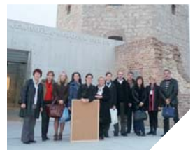
En novembre, quatre médiateurs de l'École Départementale des Arts et du Patrimoine ont été reçus en Serbie.