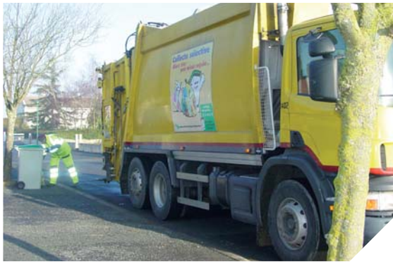
L'application de la redevance incitative a un impact direct sur le volume de déchets produits.

En Vendée, le tri des déchets progresse notamment grâce à la redevance incitative. Un dispositif qui a fait ses preuves et qui permet de lier bénéfices économiques et écologiques.