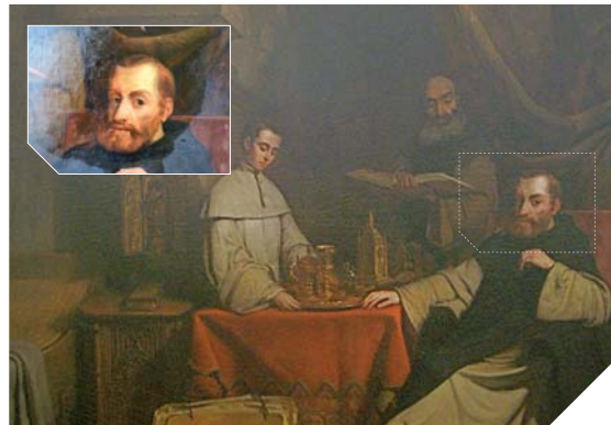
La restauration du tableau a permis de retrouver l'exceptionnel jeu d'ombre et de lumière de l'œuvre. Dans le médaillon, le visage de Charles Quint en cours de restauration.

Il se cache parfois bien des surprises sous la peinture de certaines œuvres. C'est le cas pour ce « Charles Quint au couvent de Saint-Just », peint en 1846 par Claudius Jacquand, qui met en scène le célèbre empereur au monastère après son abdication. Accroché dans la chapelle du Boistissandean, aux Herbiers, cette œuvre romantique vient de faire l'objet d'une restauration commandée par le Conseil général. En plus des différentes opérations classiques de restauration comme l'allègement de vernis et le travail de retouche, le tableau a également été radiographié. Une manière de pénétrer au cœur de l'œuvre. Une étonnante découverte a ainsi pu être mise à jour. Sous Charles Quint peint en habit de moine, on découvre Charles Quint en tenue d'empereur. L'artiste avait donc initia-