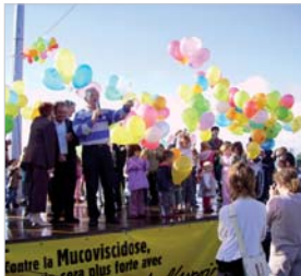
Les Virades de l'Espoir permettent de soutenir l'association Vaincre la Mucoviscidose.

Pour cette édition 2011 des Virades de l'Espoir, les initiatives se multiplient. En plus de la grande journée du 25 septembre, deux grandes soirées sont organisées les 13 et 16 septembre.