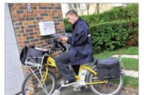
Des numéros précieux pour une bonne desserte.

malisées et permet d'engager une action de dénomination et de numérotation. La Poste peut accompagner les communes dans la mise en œuvre de cette action. Une attention particulière est portée à la préservation de l'identité locale. L'adresse normalisée peut ainsi reprendre les lieux-dits et même y ajouter des éléments de l'histoire locale.