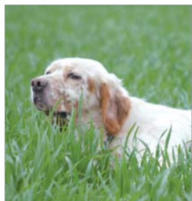
Cham du Val de Ruth a remporté l'Open de France de grande quête.