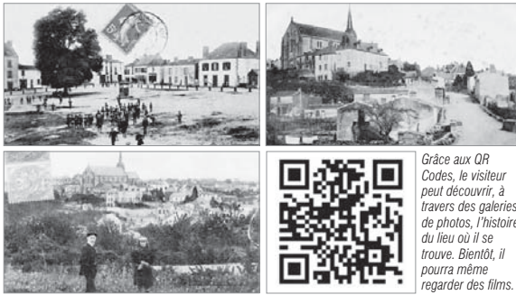
Grâce aux QR Codes, le visiteur peut découvrir, à travers des galeries de photos, l'histoire du lieu où il se trouve. Bientôt, il pourra même regarder des films.