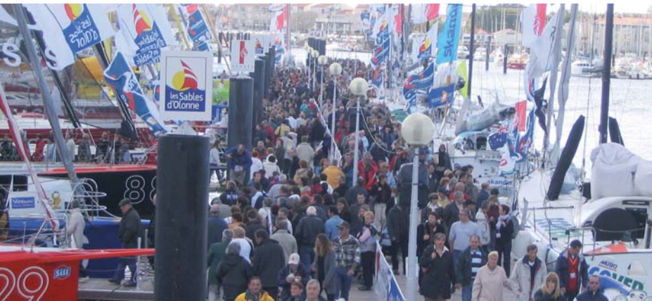
D'ici à 2040, 240 000 habitants supplémentaires vont s'installer dans notre département.

En septembre, www.vendee-avenir.fr s'ouvre à tous les Vendéens. Une fois sur la page d'accueil, choisissez une des trois thématiques : Environnement et Habitat, Solidarités ou Nouvelles technologies. Vous pouvez alors commencer à répondre aux différentes questions. Quelques minutes suffisent. Une fois le questionnaire d'une thématique rempli, vous pouvez passer à une autre thématique. Les questionnaires sont anonymes. Quelques questions vous permettent simplement de vous situer suivant votre sexe, votre tranche d'âge ou votre type d'activités. La consultation se termine le 19 septembre. Les résultats serviront à alimenter les Forums Vendée Avenir qui se tiendront dans les mois qui viennent.