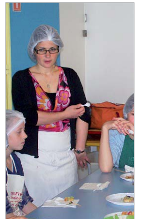
Collégiens mais aussi professionnels de la santé et de la restauration profitent de l'expertise de l'IQA.