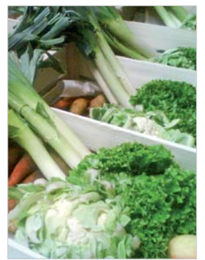
En septembre, la culture de fruits et légumes bio commence aux « Jardins du Bois Joly ».

afin de privilégier les circuits courts de distribution.