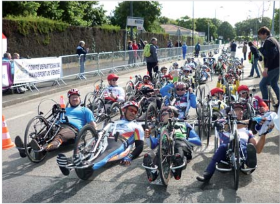
Départ du Championnat de France de handicycling 2011 à Fontenay-le-Comte.

À l'heure de la rentrée, le comité départemental handisport rappelle que tout sport est adaptable aux personnes handicapées. Le comité est prêt à étudier toute demande.