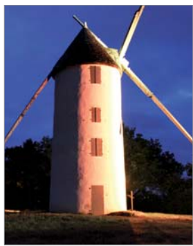
La solution technique à base de leds permet de faire varier les couleurs et la puissance d'éclairage.

de couleurs et de puissance. Cet équipement permet également de moduler la luminosité suivant le cycle lunaire. Lors des périodes favorables à l'observation du ciel, la puissance peut ainsi être réduite.