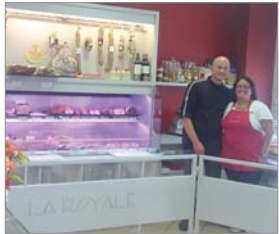
L'installation d'un commerce de proximité, ouvert toute l'année, est un plus pour la vie locale.

Sur une île, la vie quotidienne a ses contraintes. Cela explique l'im-