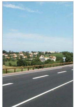
Les différents contournements font partie du plan routier départemental 2010.

À Chauché, la réalisation du contournement est également en marche puisqu'une première partie est ouverte depuis juillet. À terme,