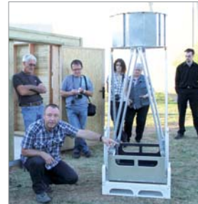
Le télescope construit par l'association est en cours de finition.

Les parties optiques ont été achetées car la fabrication de grands miroirs est