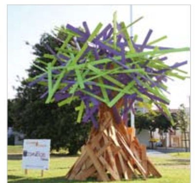
Les œuvres mettent en valeur le savoir-faire de l'entreprise.

Parce que le Pays des Olonnes ne se résume pas uniquement au tourisme, la jeune chambre économique de Vendée lance un concours pour valoriser les entreprises locales. Durant l'été, elles exposent leurs œuvres sur des ronds-points. Codes Rousseau, Agence Barty Architectes, Glassy Glass, Technibois, ID Jardin et Fabrice Morin construction : elles sont six à avoir répondu présentes pour exposer leur savoir-faire.