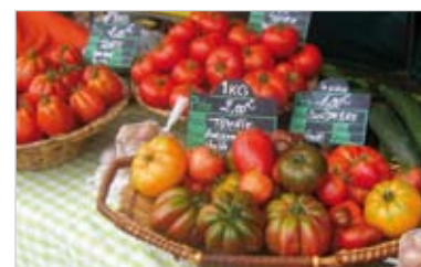
En Vendée, une quarantaine de producteurs proposera une multitude de produits de qualité.

Les marchés se tiennent régulièrement au Perrier, à Fromentine, aux Epesses, à Beaurepaire, à Mouchamps et à Longeville-sur-Mer. Premier département des Pays de Loire à mettre en place ces rendez-vous, la Vendée propose également des marchés festifs à La Chabotterie le 10 juillet, à Puybelliard le 24 juillet ou à La Roche-sur-Yon le 20 août. L'occasion de déguster les bons produits dans une ambiance conviviale.