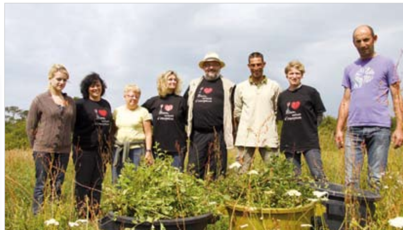
En une journée, près de 200 kilos d'épines noires seront ramassés.

■ Renseignements : 02 51 95 27 94, 📧 www.maison-terroir-vendee.com