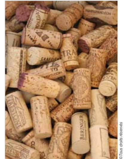
La vente des bouchons est reversée à la recherche contre le cancer.

L'intégralité de la vente au liégeur est reversée à la recherche contre le cancer.