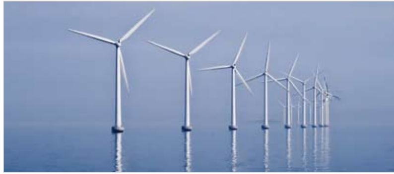
Le projet de parc éolien offshore des deux îles comprendrait 96 éoliennes en mer.