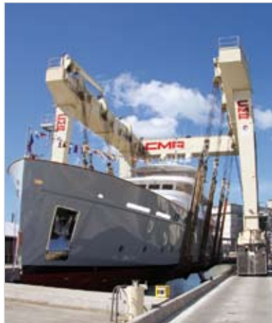
Le yacht « Elisabet » peut atteindre une vitesse de 17 nœuds.

été conçu pour une navigation autour du monde. Une fierté pour l'entreprise qui dispose également d'un site à Fontenay-le-Comte.