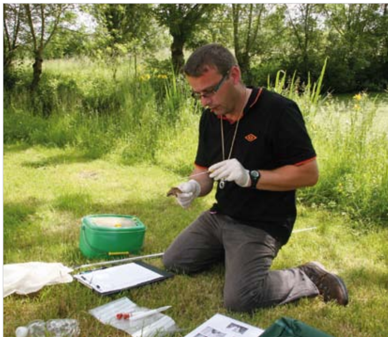
Des analyses préventives sont effectuées sur les amphibiens, comme ici sur une grenouille.