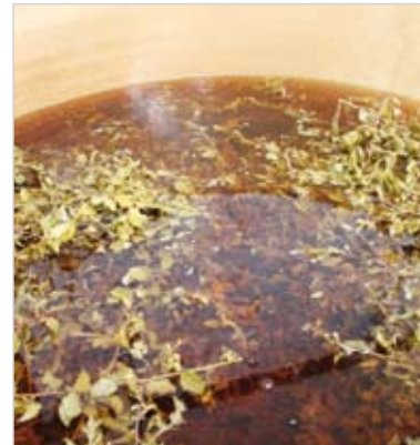
Les épines noires macèrent trois semaines dans le vin, l'eau-de-vie et le sucre.

re collective à laquelle les viticulteurs de Brem prennent une grande part. Ce matin-là, ils sont deux couples de vigneron à participer au ramassage. Pour la suite, ils fourniront le vin et l'eau-de-vie réalisée à partir de la lie. L'apéritif, très populaire, aussi bien auprès des Vendéens que des touristes, est également une porte d'entrée pour découvrir la richesse et la qualité des vins de Brem. Les 15 000 bouteilles de Troussepinette rouge et 4 000 de blanc sont distribuées à la Maison du terroir, à Brem, chez les viticulteurs partenaires mais aussi chez de nombreux cavistes.