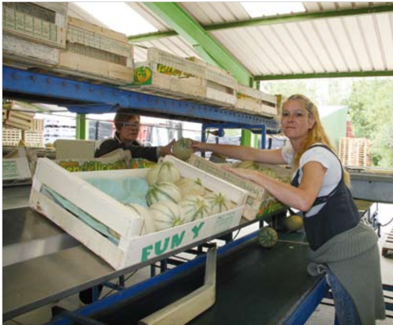
Les atouts du melon du sud Vendée s'expliquent par deux décennies de savoir-faire.

Il est beau. Il est tendre. Et en plus il habite à deux pas de chez vous! Le melon du sud Vendée gagne à être connu. Trois producteurs ont uni leurs forces, il y a deux ans pour faire goûter au plus grand nombre toute la saveur de ce produit du terroir juteux à souhait.