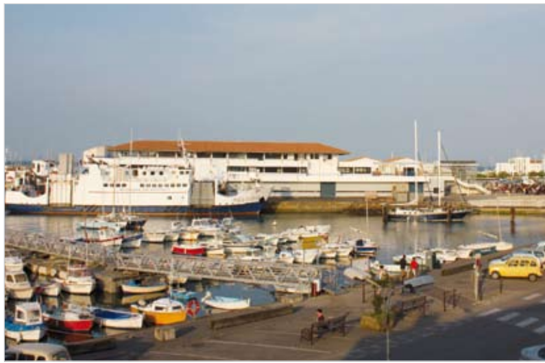
La nouvelle gare maritime de l'île d'Yeu va accroître la qualité de service rendu aux Îslois et aux touristes.

Engagés depuis janvier 2010, les travaux se sont étalés sur un peu