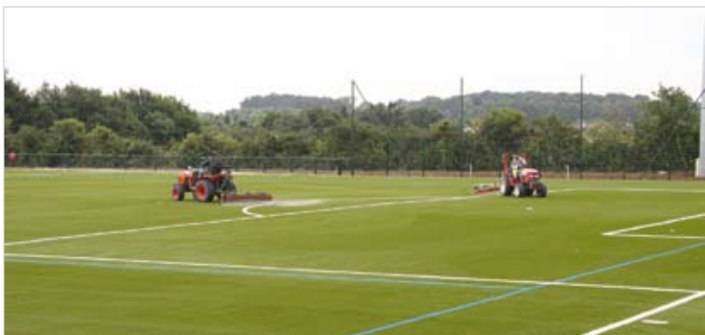
Le terrain synthétique est comblé par du sable et du caoutchouc provenant du recyclage de pneus.

En mai dernier, le Football Club des Essarts a remporté le Trophée de la Fondation du football dans la catégorie programme vert. Une récompense qui vient saluer le management environnemental du Club. Dernière initiative : la mise en place d'un terrain synthétique.