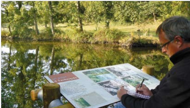
En Vendée, une vingtaine de pupitres ont été installés pour les passionnés de marche et de dessin.

La Communauté de communes du canton de Rocheservière lance les Randocroquis®. Le concept, inédit dans le grand ouest, consiste à initier les promeneurs au dessin.