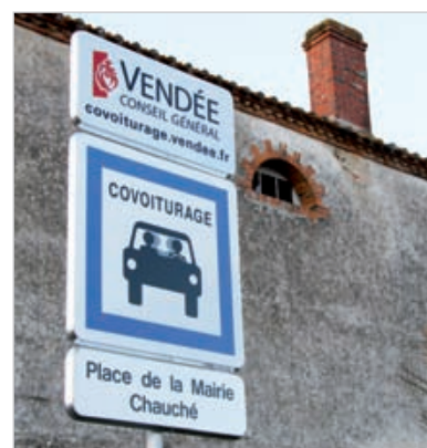
Une signalétique spécifique a été mise en place sur les nouvelles aires de covoiturage.

C'est en recensant les pratiques existantes sur des points bien localisés, accessibles et visibles que le Conseil général a pu aménager, avec l'aide des communes, 55 aires dédiées au covoiturage. Un effort particulier a été porté sur la signalétique qui permet à la fois d'informer et de sensibiliser les automobilistes. « Le déploiement de ces aires va de pair avec le lancement du site covoiturage.vendee.fr, a indiqué Bruno Retailleau, Président du Conseil général, lors de l'ouverture de l'aire de La Boissière-des-Landes. Le site permet bien sûr de localiser ces aires, mais offre également des services prati-