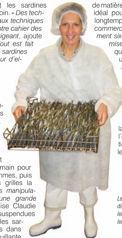
Les sardines millésimées donnent le meilleur de leur goût dix ans après leur mise en boîte.

Après dix ans de conservation, toute l'huile a pénétré dans la chair et toute l'eau en est sortie. L'idéal pour les consommer.