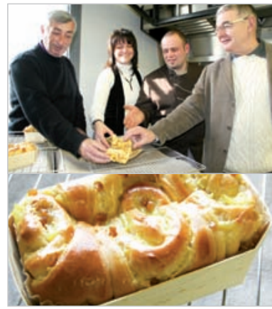
Crème pâtissière, brioche, fruits et caramel au beurre salé sont les ingrédients du « St Pient ».