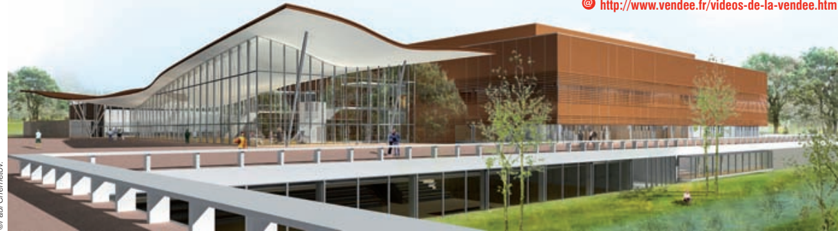
Un grand soin est porté à l'intégration paysagère du bâtiment.