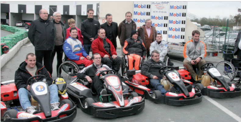
Les quatre nouveaux karts de Belleville sont adaptables aux personnes handicapées.

En parallèle à ces investissements matériels, l'association travaille à mettre en place une coupe de France Handi Kart. La première devrait avoir lieu cette année.