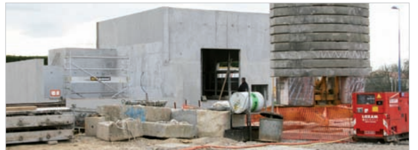
La chaudière-bois permettra de satisfaire une grande partie des besoins énergétiques du complexe sportif de l'école primaire et du futur EHPAD du Poiré-sur-Vie.

Au Poiré-sur-Vie, sur le quartier de l'Idonnière, une chaudière-bois permettra bientôt de satisfaire près de 90% des besoins annuels en énergie de trois équipements publics majeurs de la commune. Un projet qui montre l'exemple en matière d'énergie renouvelable.