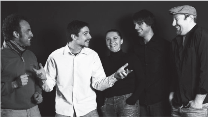
La pièce est suivie d'un débat avec des spécialistes du don d'organes.

Pousser les spectateurs à se poser la question « et nous, on ferait quoi? ». Tel est l'objectif de la dernière création de la compagnie vendéenne « Vent des scènes » sur le don d'organes. Les cinq comédiens ont rencontré professeurs, gendarmes et associations pour monter un spectacle qui sonne juste et interpelle le spectateur. Rencontre avec les comédiens.