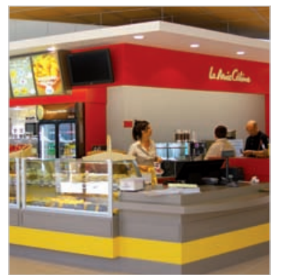
D'ici à 2020, une vingtaine d'enseignes de La Mie câline seront réparties sur les différentes autoroutes.

Depuis sa création, en 1985, l'entreprise a bâti sa réputation autour de la qualité de ses produits fabriqués à