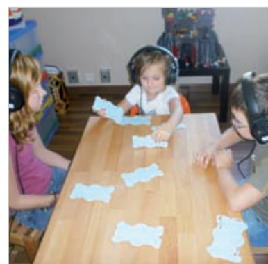
Le centre d'écoute au Château d'Olonne.