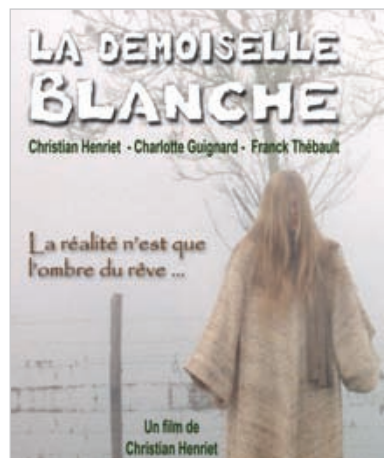
Le tournage du film a réuni une quarantaine de personnes dans les plus beaux paysages du Sud Vendée.

culière ». Au gré du film, on peut effectivement découvrir les paysages du Sud Vendée et les spectateurs