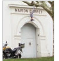
Une fusion des deux établissements est envisagée.