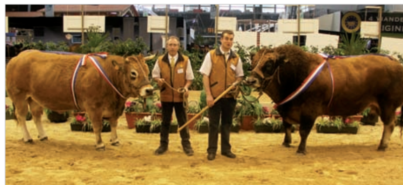
Ulla et Batailleur, champions de France de la race parthenaise. Cette année, 3 animaux vendéens ont été primés pour les 4 sections de la race parthenaise.

Casimir, Ulla, Batailleur et les autres portent l'élevage des charolais et des parthenaises du département au faite de leur gloire.