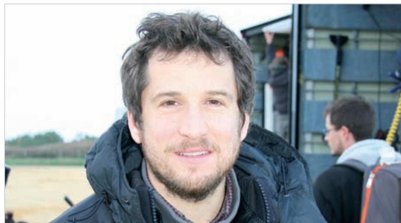
Guillaume Canet, acteur et réalisateur, ici, plage de Sauveterre, à Olonne-sur-Mer.

Le célèbre acteur et réalisateur Guillaume Canet était, fin février, en tournage sur les plages vendéennes. Il tient le rôle phare du prochain film de Cédric Kahn, « Une vie meilleure », sur les écrans début 2012. Rencontre.