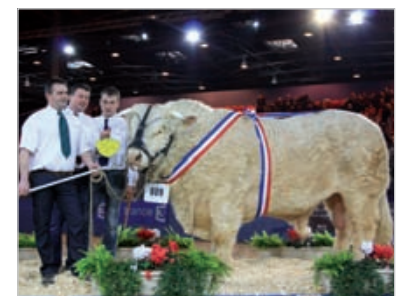
Casimir, un champion 100% vendéen, 1610 kg, record à battre.

Ces titres de champion de France, sont une excellente carte de visite pour les éleveurs. Ils rejouissent sur l'ensemble des élevages du département. Blonde d'Aquitaine, Monbeliard mais aussi mouton vendéen, en 2011, l'édition du Salon de l'Agriculture a été une nouvelle fois l'occasion de mettre en avant la qualité des élevages du département.