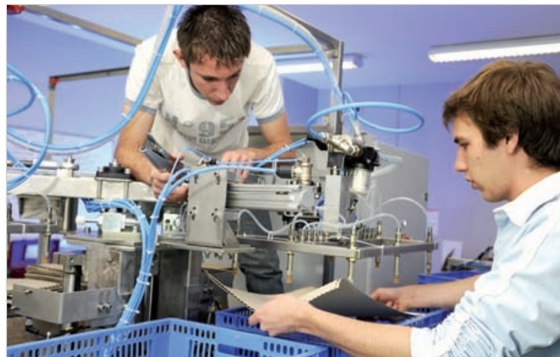
Les élèves de l'ICAM Vendée se forment autour de commandes réelles d'entreprises.

Entre les contrats d'apprentissages et les prestations industrielles (études, conseils et machines spéciales) l'école a aujourd'hui créé un réseau de près de 300 entreprises.