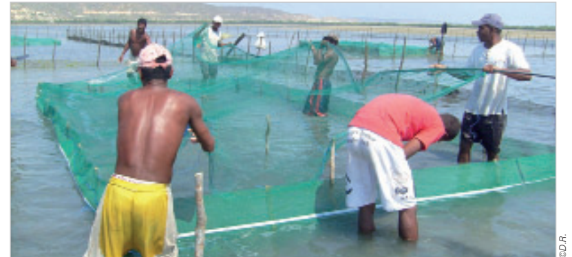
Des pêcheurs malgaches en train d'installer un filet pour les holothuries en pleine mer.

Le développement de l'aquaculture villageoise est l'une des autres grandes priorités de l'association TMD, notamment à travers l'élevage d'holothuries, plus communément appelé