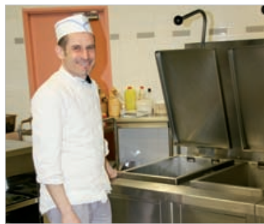
Le chef cuisinier suit un plan alimentaire, formidable outil d'équilibre et de simplicité.

En parallèle à ce travail sur l'équilibre et la qualité, le chef cuisinier commande les aliments, fabrique les repas et entretient la cuisine. Des tâches qui sont facilitées par de nouvelles machines comme ces outils de cuisson à basse température qui permettent de lancer une cuisson la veille pour le lendemain. Pour l'entretien, un nouveau système vapeur, où l'eau est propulsée à plus de 100 degrés, permet de dégraisser, désinfecter le restaurant et la plonge. Cela permet aussi de gagner du temps, d'économiser de l'eau et de moins polluer.