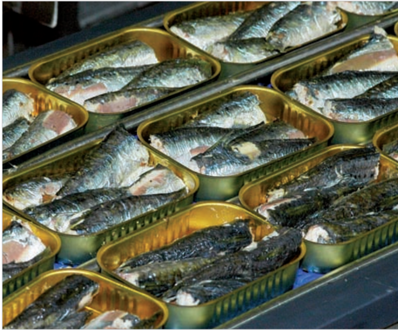
Mise une à une dans les boîtes, les sardines sont manipulées avec la plus grande délicatesse.

Avec le printemps, la pêche à la sardine reprend son cours dans le port de Saint-Gilles-Croix-de-Vie. Les employées de la conserverie se préparent à mettre en boîte le savoureux petit poisson bleu.