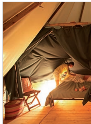
À Noirmoutier, les vacances se passent aussi sous un tipi, face à la mer et au cœur d'une forêt.

mais aux Vendéens et aux touristes de passer du rêve à la réalité. Une jolie façon de s'évader tout en baignant dans un cadre verdoyant.