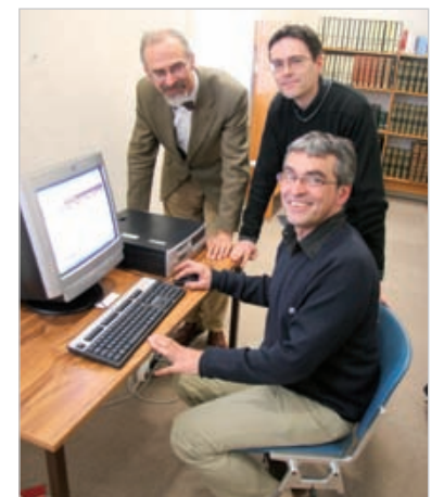
« Noms de Vendée » est une base de données qui ne cesse de se développer depuis sa création.