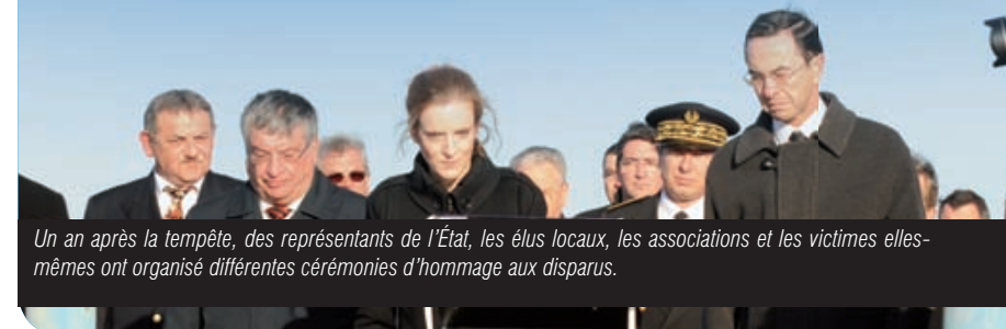
Un an après la tempête, des représentants de l'État, les élus locaux, les associations et les victimes elles-mêmes ont organisé différentes cérémonies d'hommage aux disparus.