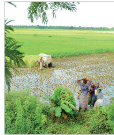
Les animateurs mettent en place des actions sur place.