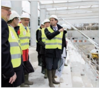
Bruno Retailleau, Président du Conseil général lors de la visite de chantier.

À 18 mois de son ouverture, le Vendespace commence à révéler ses volumes. Alors que 200 personnes s'activent quotidiennement sur le chantier, les premiers projets concernant la programmation se dessinent.