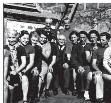
L'exposition présente de nombreux documents qui illustrent cet épisode historique.

Après avoir tournée en Vendée ces cinq dernières années, l'exposition « Des Ardennes à la Vendée :