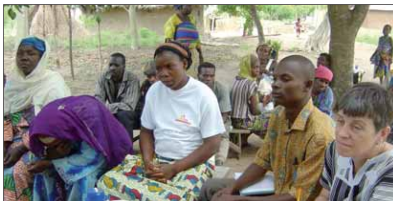
Réunion d'information dans un village du Bénin : « votre santé est votre première richesse. »

les mentalités. Mais petit à petit les choses avancent. »