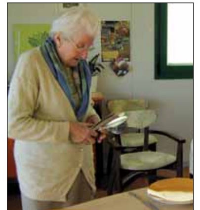
Les personnes atteintes de la maladie d'Alzheimer sollicitées ici pour la mise du couvert.

L'accueil s'adresse aux personnes de plus de 60 ans atteintes de la maladie d'Alzheimer ou troubles apparentés. Conçu comme un espace-relais dans un environnement adapté, il permet à la personne désorientée de participer à des activités et valoriser ses potentialités. Travailler sur les repères temporo-spatiaux, la psychomotricité, participer à des ateliers de cuisine, jardinage, informatique, musique de relaxation et gymnastique font partie des activités d'une journée type. Ces activités permettent de stimuler la mé-