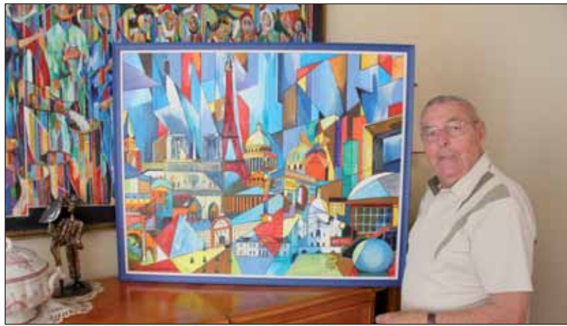
Présentée par Alain Bachelot, la peinture du bas a été retenue par la manufacture Four.

Des œuvres d'un Vendéen servent de modèle pour une manufacture de tapisserie d'Aubusson.