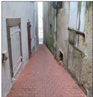
La rue de l'enfer, aux Sables d'Olonne.

C'est aux Sables d'Olonne que la rue la plus étroite du monde est homologuée par le Livre Guinness des records. Un record disputé par de nombreuses concurrentes à travers le monde.