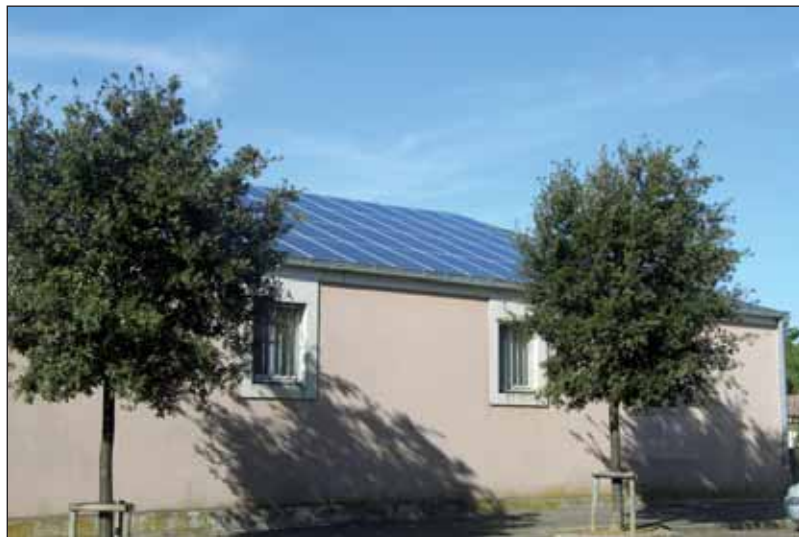
Le garage de la gendarmerie des Sables d'Olonne offre une surface de 230 m 2 .

« Cette installation est une nouvelle illustration de l'engagement particulier du Conseil général de la Vendée pour développer l'énergie solaire. Les actions du Plan Vendée Solaire adopté en 2009, permettent au Département d'équiper son propre patrimoine, d'aider les communes et partenaires et de sensibiliser et informer les Vendéens, explique Gérard Faugeron, conseiller général du canton des Sables d'Olonne. L'ensoleillement est un atout naturel exceptionnel de la Vendée, il faut en tirer partie pour développer la part des énergies renouvelables. »