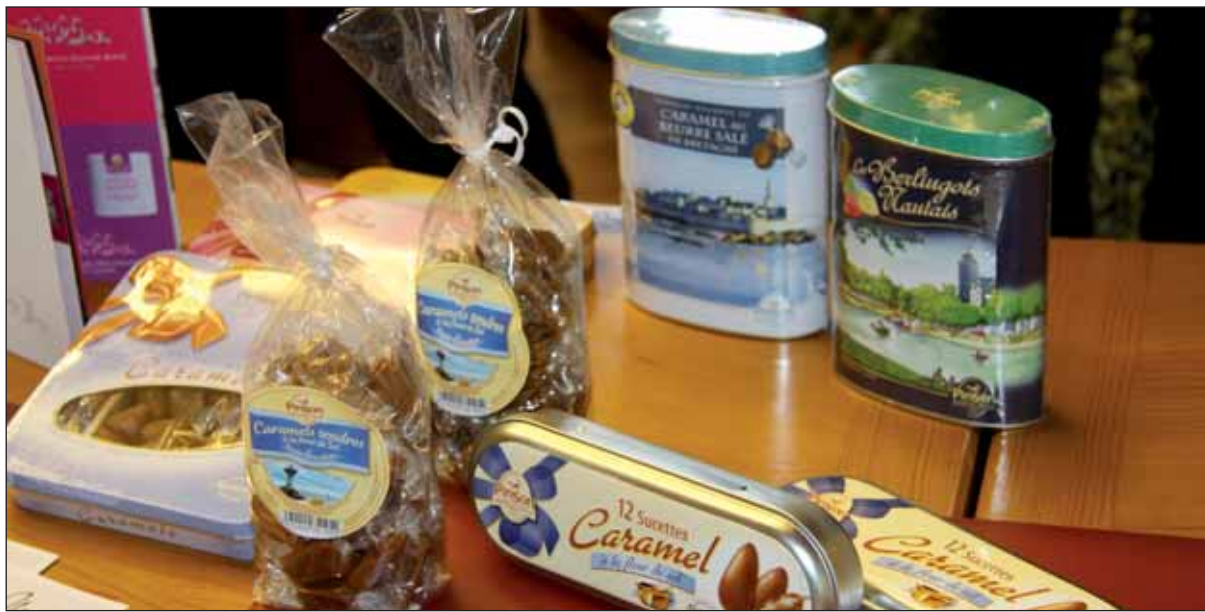
L'entreprise Bonté Pinson commercialise des bonbons historiques comme le berlingot nantais.

Caramels au beurre salé, bonbons à la violette, berlingots nantais... Toutes ces célèbres confiseries traditionnelles sont fabriquées par l'entreprise Bonté Pinson, fondée il y a 150 ans à Nantes. Aujourd'hui, pour faire face à un développement important, notamment à l'export, l'entreprise a décidé de s'installer sur un nouveau site, en Vendée, à Boufféré.