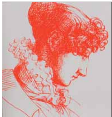
La vie de Félicie de Fauveau va bientôt faire l'objet d'une exposition à l'Historial de la Vendée.

Avec elle, l'aventure vendéenne se transforme en roman de chevalerie. Dixit Emmanuel de Waresquiel, auteur d'une biographie de Félicie de Fauveau, femme marginale et artiste du XIX e .