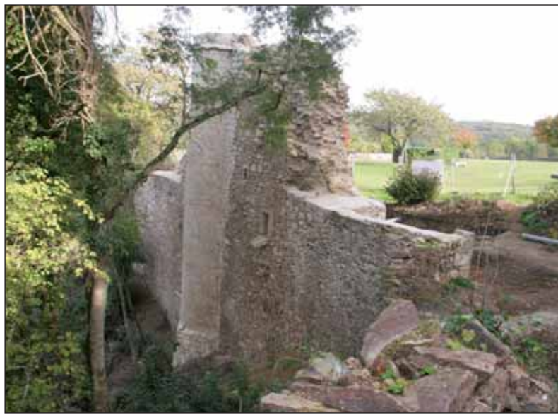
La première tour de la forteresse restaurée. Une vue imprenable sur le barrage et la forêt de Mervent.

Construite par la légendaire Mélusine, qui serait selon certains auteurs Eustache Chabot, fille de Thibaut II de Chabot et épouse de Geoyffroy I de Lusignan, elle a ensuite été transformée à maintes reprises par ses différents propriétaires. Probablement