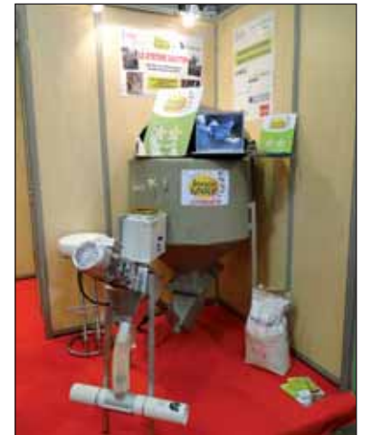
« Easy Top » a été primé au concours Innovspace.

Ce distributeur d'aliments a la particularité d'intégrer tel ou tel complément alimentaire, selon les besoins du lapin au cours de son cycle de production. Cette machine permet d'éviter tous les désagréments rencontrés avec les autres systèmes. Elle fait notamment gagner du temps à l'éleveur qui optait au préalable pour une distribution manuelle des compléments ali-