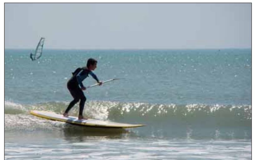
Les Stand Up Paddle permettent plusieurs pratiques comme ici, dans les vagues.

les marais, le Stand Up Paddle offre une randonnée tranquille au cœur de la nature. Dans tous les cas, la large planche permet une grande stabilité et la pagaie est un parfait moyen pour se propulser et tourner. Dans le domaine de la compétition, ce sport se développe également fortement. Ainsi, en septembre dernier, les Championnats régionaux de surf à Brétignolles-sur-mer ont accueilli une épreuve de Stand Up Paddle.