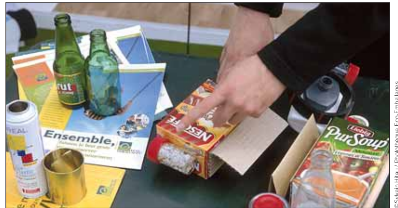
Le dernier sondage révèle que le tri des déchets est largement entré dans les habitudes des Vendéens.

Le dernier sondage de l'IFOP prouve que le civisme des Vendéens se renforce en matière de déchets. Le Conseil général lance en 2011 un plan de prévention des déchets en partenariat avec l'ADEME.