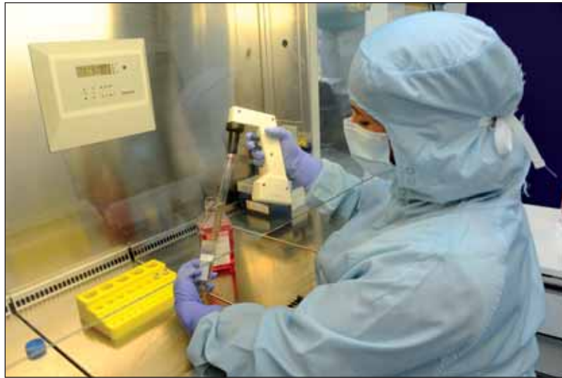
Un contrôle drastique pour repérer dans les médicaments les cellules dangereuses pour l'homme.