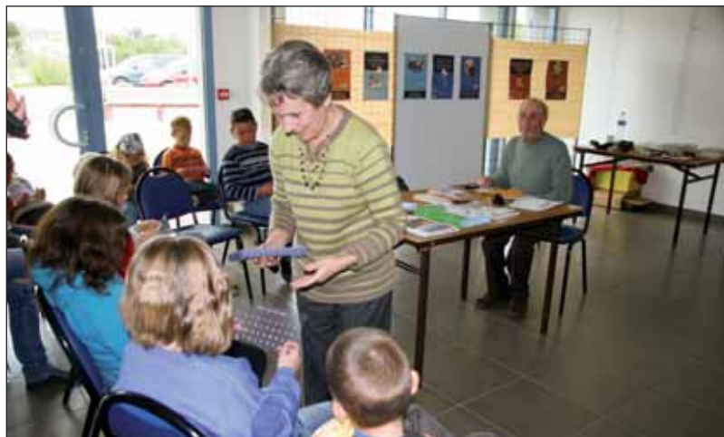
Les enfants du centre de loisirs de La Barre-de-Monts ont notamment découvert l'alphabet en braille.

■ Renseignements : 02 51 47 88 24 (CDT/service développement)