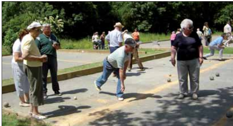
Un match disputé avec une boule de minimum 10 cm à 12 cm maximum de diamètre.

Les joueurs se retrouvent tous les week-ends du mois de mars à octobre. Ils jouent avec leurs propres boules. Fabriquées en bois dur de gayac, un bois exotique qui vient d'Amérique centrale, la boule en bois dur permet de jouer par tous les temps, été comme hiver. Elles sont réalisées par un tourneur sur bois du département. « Du printemps à l'automne, je participe à 45 concours de boules. Ce jeu m'ap-