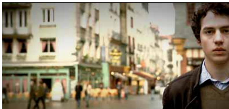
« Le Syndrome du timide », seul film français sur les 23 000 en lice, a conquis le jury outre-atlantique.

■ Pour voir le film : http://www.youtube.com/watch?v=e2fqFINx8CI