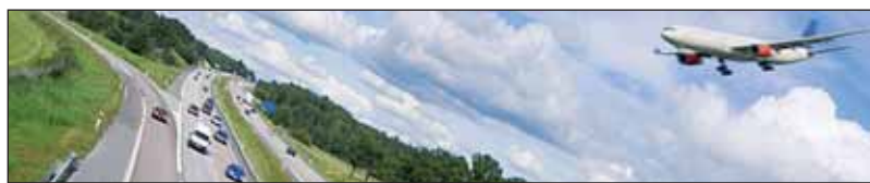
La Chambre de Commerce et d'Industrie de la Vendée propose des services adaptés aux entreprises vendéennes qui se lancent à l'export.

Le Déclic Export est l'outil d'échange entre le conseiller et les dirigeants, pour connaître les points à renforcer. Viennent ensuite, le Planning d'actions, le Business-plan, l'Eval RH et l'Eval marché. Ces outils, CCI International les a développés pour permettre à l'entreprise d'avoir un aperçu de l'action à mener selon les pays de destination. Le Dinamic Entreprise a un rôle d'information et de réflexion pour mettre en confiance l'entreprise et la renforcer sur l'approche à l'export.