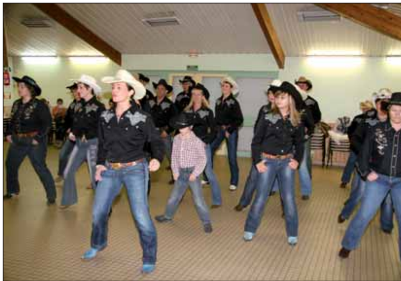
Au Tablier, les aficionados de la danse country se retrouvent chaque semaine pour s'entraîner.