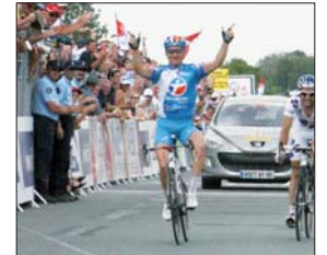
Thomas Voeckler, ici lors des derniers Championnats de France de cyclisme.

marrage nerveux. Il a réussi à créer l'écart et a tenu la courte distance qui le séparait de la ligne. Il est ainsi parvenu à devancer d'une poignée de secondes le Norvégien Boasson Hagen, le Néerlandais Gesink et le Canadien Hesjedal. Tout au long du parcours, Thomas Voeckler a senti beaucoup d'encouragements de la part du public québécois. Cette victoire vient s'ajouter aux bonnes performances de l'année 2010. Thomas Voeckler avait été vainqueur d'une étape du Tour de France, à Luchon.