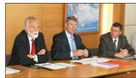
Les élus locaux et représentants des associations contestent la valeur juridique du rapport Pitiié Puech.

les associations concernées aboutisse à une décision rapide. Enfin, il semble plus que nécessaire qu'une cohérence parfaite soit respectée entre le zonage de solidarité et les projets de plan de prévention des risques d'inondation, PPRI.