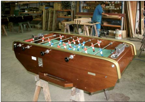
Le « baby » vendéen a un signe particulier : il est le seul à avoir des cages en fer grillagé.

ses parties de « baby-foot », comme « pissette », « gamelle », « reprise » ou « roulette », résonne depuis plusieurs décennies de bar en café, de salle de jeux en foyer, en passant par les cours de récré et chez les particuliers.