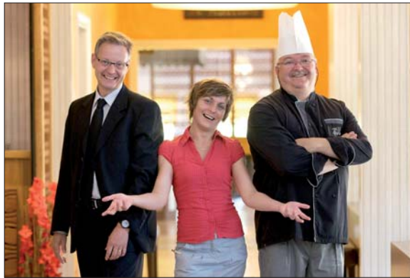
19 chefs revisitent les produits du terroir.

■ Renseignements : Du 9 au 17 octobre, www.vendee-hotels-restaurants.com