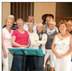
Les bénévoles préparent le concert cabaret.