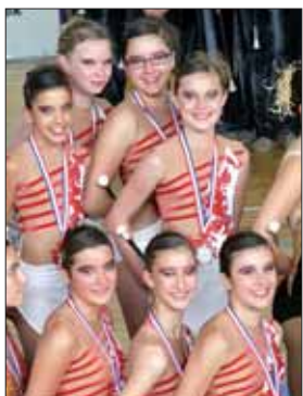
Les jeunes sportives de Saint-Hilaire-des-Loges ont porté au plus haut les couleurs de leur club vendéen.

Deux ans seulement après avoir rejoint la FFFB (Fédération Française de Twirling Bâton), le club de Saint-Hilaire-des-Loges a achevé sa saison sur un très bel exploit.