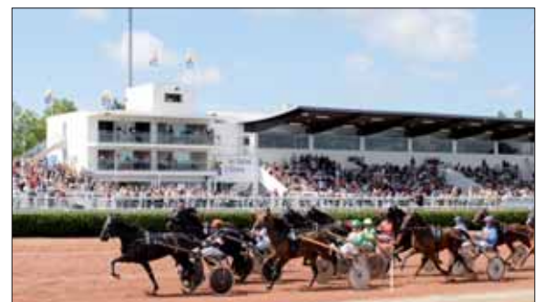
Le 2 août prochain lors de la fête des courses, animations et jeux gratuits sont prévus pour toute la famille.

comme l'élection de Miss Côte de lumière.