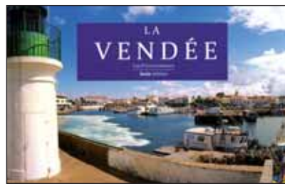
La Vendée se dévoile au fil des pages.

De Noirmoutier au bocage, de l'île d'Yeu au marais poitevin en passant par la plaine et la forêt, en quelques pages, le recueil « la Vendée, les p'tits cadeaux », entraîne le lecteur à travers tout le département. Réu-