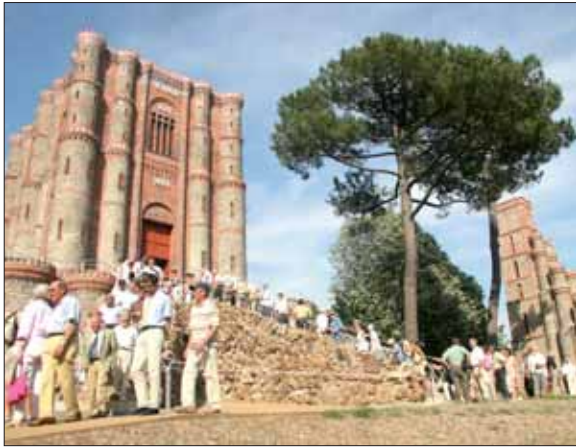
Construit par leurs aïeux, de nombreux Rabastos se sont rendus sur le site du sanctuaire de la Salette.

Unique en son genre, le sanctuaire Notre-Dame de la Salette à La Rabatelière a retrouvé la sérénité que lui avaient donnée ses bâtisseurs, les habitants de la commune.