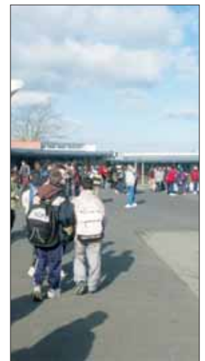
Le collège des Essarts ouvre ses portes en 2013.

À noter que les élus de l'opposition, en s'abstenant, ont marqué leur refus de soutenir les actions lancées par le Conseil général pour permettre l'ouverture du collège des Essarts à la rentrée 2013.