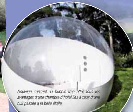
Nouveau concept, la bubble tree offre tous les avantages d'une chambre d'hôtel liés à ceux d'une nuit passée à la belle étoile.

En Vendée, le camping, c'est un vaste panel de propositions hors du commun. À Saint-Julien-des-Landes, par exemple, le camping « La forêt », offre la possibilité de passer une nuit au milieu des étoiles. Tout nouveau concept, à peine répandu en France, la « bubble tree », est une bulle maintenue sous pression d'air qui permet de passer une nuit à la belle étoile sans être dérangé par la rosée du matin ni par les va-et-vient des insectes nocturnes. « Chaque année, nous essayons de mettre en place un nouveau concept. Cette année, nous avons la bulle, nos premiers clients en ont déjà apprécié tous les atouts. Logés comme dans une chambre d'hôtel, ils passent une soirée au milieu de nulle part. Comme s'ils étaient posés en apesanteur dans une navette spatiale au milieu du cosmos. Ce genre de formule attire aussi bien une clientèle vendéenne qu'une clientèle parisienne venue prendre le « vert ». L'an dernier nous avons mis en place deux cabanes construites en haut d'un arbre. L'année prochaine nous développerons le concept d'une nuit en roulotte », explique Axel de Mauduit, propriétaire du camping.