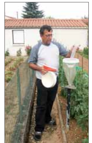
Chaque matin, 15 bénévoles vendéens relèvent la pluviométrie pour Météo France.

fiées, les données sont disponibles autour du 10 de chaque mois.