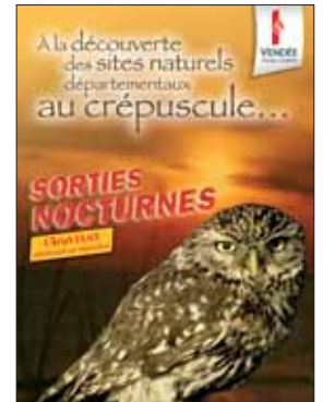
Une plongée en douceur dans le monde de la nuit.

Enfin, mardi 24 août, à 19h30, le massif dunaire de la Tresson lève le voile sur des plantes rares et protégées.