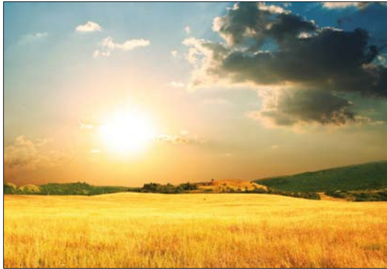
L'agriculture, un secteur en plein essor pour le Sud Vendée.

Le Département et Vendée Expansion ont mis en place une stratégie de développement et de soutien aux entreprises du bassin du Sud Vendée Est. Ce plan est destiné à