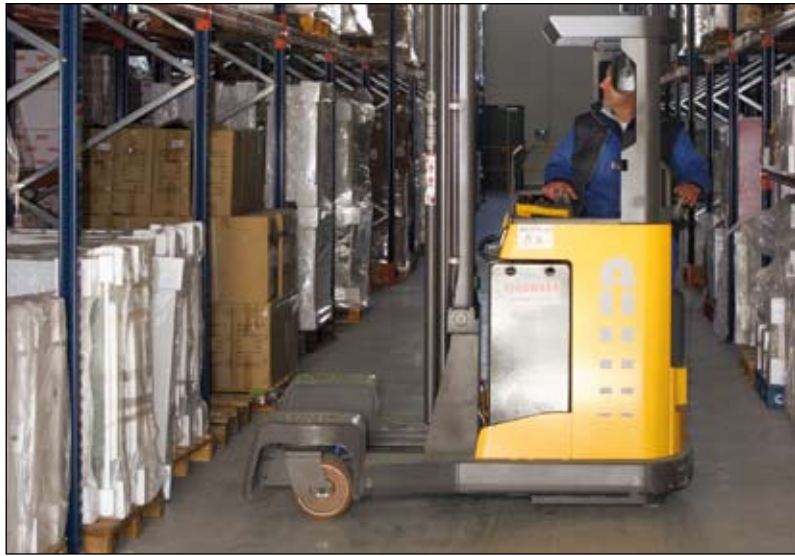
La nouvelle plateforme logistique de 14 000 m 2 à la Covap (La Chaize-le-Vicomte).

Plus de propriétaires, plus de constructions, plus de maisons, plus d'entretiens : les artisans doivent faire face à une demande toujours croissante. Et la demande suppose du