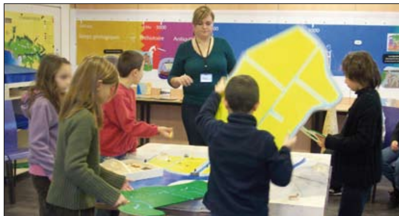
Excellent outil pédagogique, la maquette du Marais permet aux élèves de s'immerger dans l'histoire.