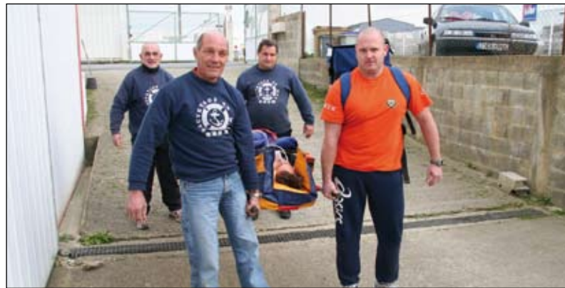
De nombreuses heures de formation pour un sauvetage encore plus efficace.

Encore plus de formations pour les sauveteurs. Les bénévoles de la SNSM (Société Nationale de Sauvetage en Mer) présenteront leurs activités les 12 et 16 janvier à Olonne-sur-Mer.