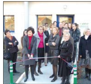
Le CAMSP aide les enfants qui présentent des difficultés de développement.

Âgés de 0 à 6 ans, les patients du CAMSP originaires des Herbiers bénéficieront d'un suivi de proximité. Une nouvelle antenne vient de s'y installer.