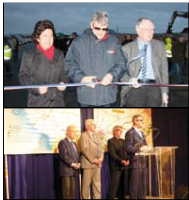
2 aménagements pour 14 km de nouvelles routes.

À peine ouverte, la partie ouest du contournement sud des Herbiers attend plusieurs milliers de véhicules chaque jour. Sur la RD 753, entre Challans et St-Jean-de-Monts, 10 nouveaux kilomètres permettent de désengorger cet axe. « Grâce à ces travaux routiers, le désenclavement de la Vendée ne cesse de progresser et son corollaire, le développement économique avec l'installation de nouvelles entreprises. Nous devons continuer nos efforts », a déclaré Philippe de Villiers, Président du Conseil général.