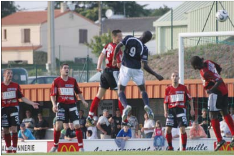
L'équipe du Vendée Les Herbiers Football (VHF) se prépare au match contre Toulouse.

Pour la première fois depuis dix ans, les joueurs du Vendée Les Herbiers Football (VHF) sont en 32 e de finale de la Coupe de France. Les Vendéens du bocage affrontent les Toulousains, samedi 9 janvier, à domicile.