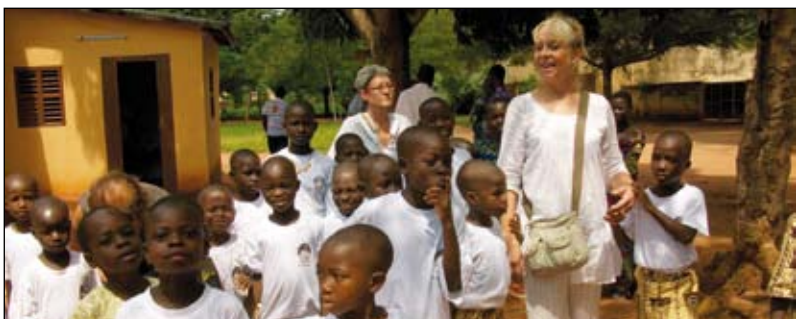
Les vingt enfants accueillis à Toviklin, au Bénin.

Par ailleurs, le Conseil général a fait une place pour les livraisons de l'association dans le container embarqué pour Cotonou. Du mobilier, des fournitures scolaires et du linge de maison ont fait le voyage jusqu'à Toviklin.