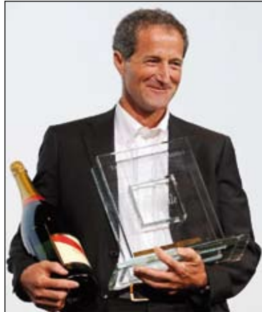
Michel Desjoyeaux, vainqueur du dernier Vendée Globe, vient d'être sacré « marin de l'année 2009 ».

Michel Desjoyeaux a été élu « marin de l'année 2009 » par la Fédération Française de Voile (FFV). Cette distinction honore sa victoire dans le dernier Vendée Globe, à bord du Foncia.