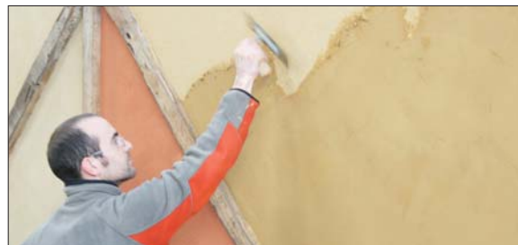
Nouvel enduit, produit du sous-sol vendéen, entièrement naturel.

Il sert à solidifier les murs, à les entretenir autant qu'à les décorer. « Surtout, dans 15 ans, quand il faudra gratter l'enduit pour le remplacer, ce dernier pourra servir de terreau à mon jardin », conclut le repreneur de l'entreprise Gillaizeau qui voit depuis quelque temps son activité redynamisée. Il entreprend, dès 2010, la création d'un enduit extérieur.