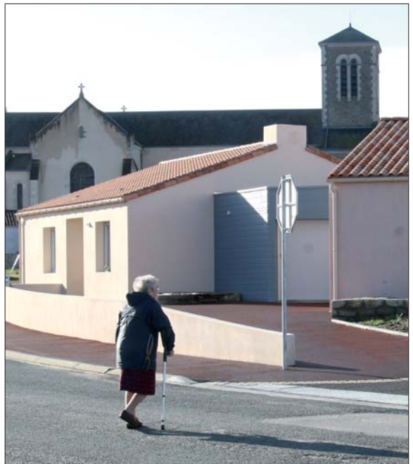
Des aides multiples, adaptées à chaque personne pour pallier la perte d'autonomie.

En plus de ces aides de maintien à domicile, de nombreuses actions ont été réalisées pour les personnes malades Alzheimer. En 4 ans, 602 places en maison de vie spécialisées ont été créées. Elles ont permis de doubler la capacité d'accueil du département. Et 93 places d'accueil de jour ont été ouvertes. « Il faut que nous multiplions ces places. Elles permettent aux familles de confier leurs proches en toute sérénité certains jours », ajoute Véronique Besse.