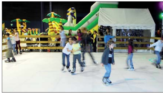
Les sensations de glisse sont quasiment identiques dans une patinoire en polyéthylène.

Pour un patinage dans des conditions optimales, chaque matin, les plaques de polyéthylène doivent être entretenues par un produit qui les alimente et permet la sensation de glisse et surtout les virages. La mollesse des plaques amortit les chocs. Enfin, la patinoire n'est plus tributaire des aléas du climat. Elle peut même