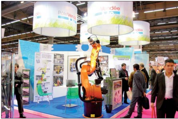
Le pôle Vendée a permis à 14 entreprises vendéennes de la métallurgie à mettre en avant leur savoir-faire au Midest.