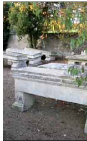
Le cimetière du Champ aux draps, restauré et ouvert au public.

été trouvées, par hasard, dans une grange. Leur propriétaire nous les a données. Le socle de cette tombe, vient d'un autre endroit ».