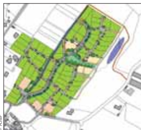
Le futur quartier de Treize-Septiers se situe à l'entrée de la commune, à La Papière.

Dans quelques mois, Noé et ses parents vivront à quelques centaines de mètres du bourg. Soixante-cinq habitations formeront à terme leur quartier. Les travaux des vingt-cinq premières parcelles débutent en 2010.