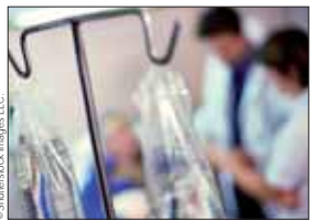
Le registre EPIC-PL recense les nouveaux cancers.

Depuis 1998, l'association EPIC-PL (Epidémiologie des Cancers en Pays de la Loire) recense tous les nouveaux cancers chez les personnes domiciliées en Loire-Atlantique ou en Vendée (1,8 millions d'habi-