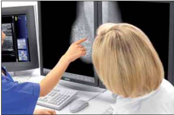
Le dépistage sauve de nombreuses vies.