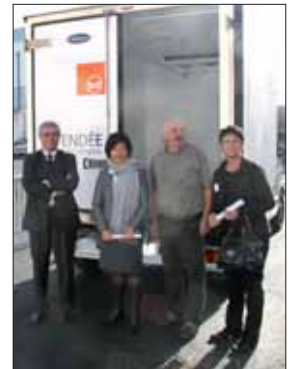
Nouveau camion de la Banque alimentaire. Il permet de transporter jusqu'à une tonne de denrées.

■ Renseignements : 02 51 37 06 55 Les 27 et 28 novembre, la Banque Alimentaire organise une grande collecte nationale.