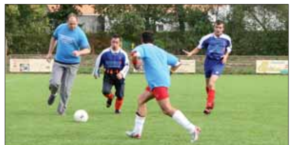
Le premier tournoi de foot handicap, organisé par le District de Vendée, s'est déroulé à Venansault.

■ Renseignements : 02 51 44 27 33 ou 06 60 39 14 73.