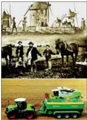
L'histoire des moulins du Bocage sur toile.

Les projections ont lieu au cinéma du Sully, à Chantonay, les vendre-