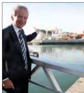
Une fosse de déquillage complètera les prestations proposées par le port des Sables.

Dès 2011, le port des Sables-d'Olonne disposera d'une fosse pour le quillage et de déquillage des grandes unités. Cet espace de plusieurs mètres de profondeur permettra de