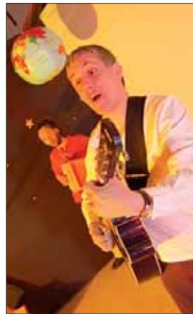
« Manque pas d'air » sensibilise les enfants au respect de l'environnement.