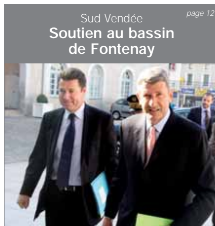
Sud Vendée Soutien au bassin de Fontenay