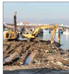
Les travaux ont commencé au port de l'Herbaudière.

Actuellement, le port départemental de l'Herbaudière sur l'île de Noirmoutier comporte un bassin dédié à la pêche et un autre à la plaisance, séparés par un môle central. Cinq nouveaux pontons destinés à la pêche seront livrés et le ponton d'avitaillement existant va être allongé de cinq mètres. Le môle central va être complètement réhabilité et modernisé avec l'installation de trois nouveaux pontons flottants dédiés à la plaisance pour en augmenter la capacité de 25 places. Les travaux s'achèveront avant la saison estivale 2010.