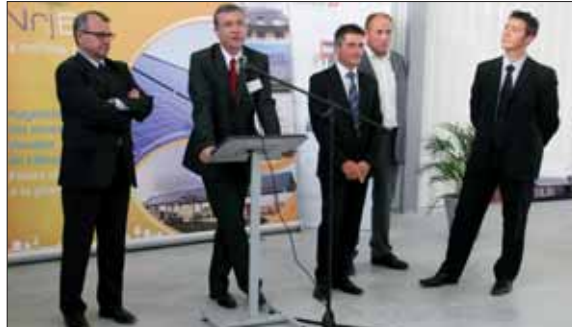
De nombreuses entreprises s'installent en Vendée grâce au travail de l'équipe de prospection.