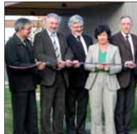
« Le Clos du Paradis » favorise l'autonomie des personnes handicapées.

Situé en lisière du bourg, « Le Clos du Paradis » accueille désormais des personnes handicapées pouvant vivre en foyer de vie. Tous les handicaps ne sont pas les mêmes. C'est pourquoi, le Conseil général privilégie des lieux de vie qui favorisent l'autonomie des personnes selon les difficultés rencontrées. En témoigne cet établissement, inauguré le 19 octobre dernier.