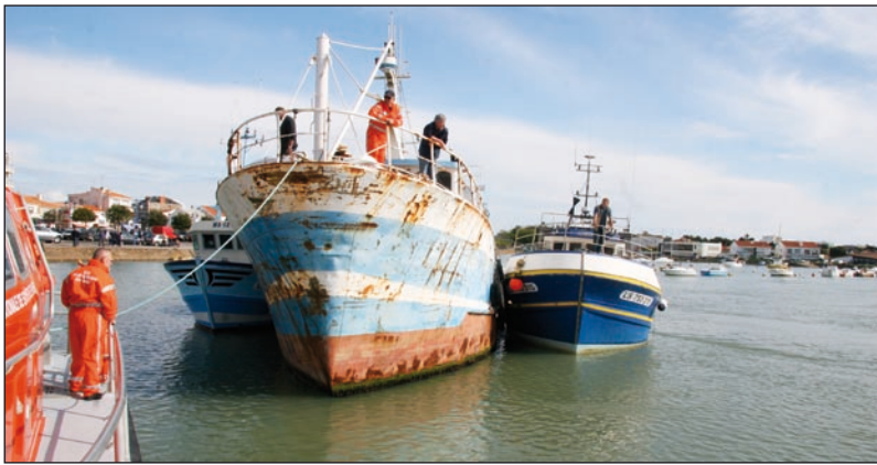
Le Conseil général de la Vendée s'est substitué au propriétaire du « Méfi » pour procéder rapidement et efficacement à sa démolition.