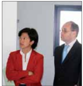
Le portage des repas permet aux personnes âgées de vieillir à domicile.

« Avec les « Mots bleus », notre canton dispose maintenant d'une capacité d'accueil de 550 places », assure Philippe de Villiers, conseiller général du canton de Montaigu et président du Conseil général. Pour renforcer l'aide au maintien à domicile, un nouveau véhicule de portage de repas a été mis à la disposition de la communauté de communes. Il va permettre aussi de couvrir l'ensemble de la communauté de communes.