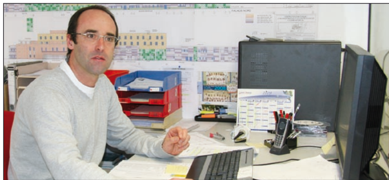
Les dessinateurs projeteurs sont indispensables dans de nombreuses entreprises.

Des normes techniques à faire respecter, des performances de machines à améliorer... Entreprises industrielles et entreprises du bâtiment, peuvent difficilement se passer des compétences des dessinateurs projeteurs. Aujourd'hui, plusieurs d'entre elles recrutent.