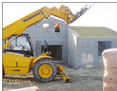
Le Département apporte des solutions à tous les Vendéens dans leurs projets de logement.

priété n'est pas toujours envisageable, en particulier pour les ménages à revenus modestes, les familles monoparentales et les jeunes salariés. « Construire des logements aidés de qualité fait également partie de nos priorités. La location est souvent une étape nécessaire avant l'accession à la propriété, » explique Véronique Besse. « En 2008, nous avons financé la construction de 500 logements dans le parc locatif public