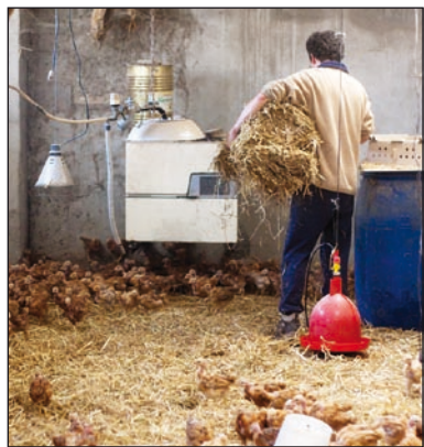
De nombreux éleveurs de volailles attendent la relève.

En septembre 2009, une nouvelle formation, le Certificat de spécialisation pour la conduite d'élevages avicoles, proposée par l'Institut rural des Herbiers, permettra à des jeunes apprentis agricoles de se spécialiser dans l'élevage de la volaille. L'objectif est de dévelop-