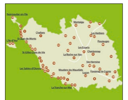
57 hot-spots Wi-Fi seront disponibles.

repérables grâce à une signalétique spécifique. Le réseau Vendée Wi-Fi est disponible dans un rayon de 100 mètres autour de ces points. Ensuite, le navigateur web d'un ordinateur portable se connectera automatiquement au portail d'accueil. L'utilisateur pourra alors visiter gratuitement des sites d'informations pratiques. Pour 1€ et pendant 24 heures, il pourra surfer librement et intégralement sur Internet.