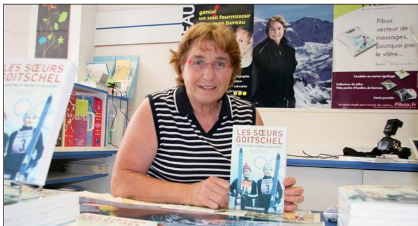
Marielle Goitschel lors de la dédicace de son livre : « il faut redonner aux jeunes la valeur du travail ».

Sept titres mondiaux, trois titres olympiques, Marielle Goitschel, l'une des plus grandes skieuses françaises est venue à Challans dédicacer son livre, « Les sœurs Goitschel, les étoiles des neiges ». « J'aime la Vendée parce que j'y ai des amis et que c'est un département avec lequel je partage des valeurs, explique l'ancienne championne. J'espère que ce livre fera comprendre à la jeune génération de Français que pour arriver à quelque chose, il faut travailler et se donner du mal. »