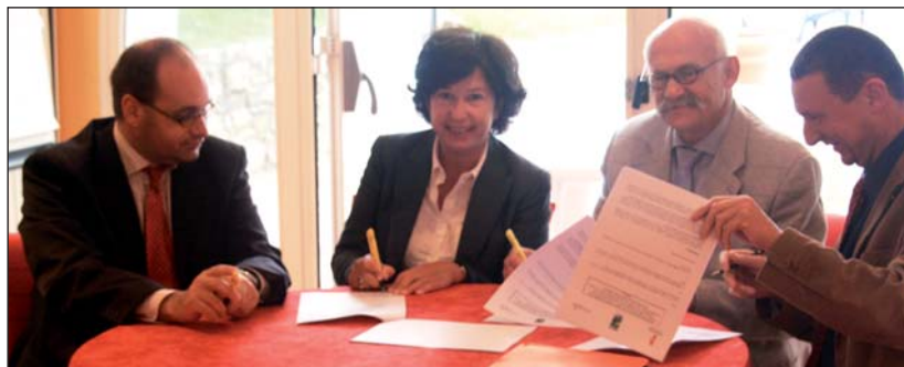
Le Conseil général a signé un partenariat pour une meilleure prise en charge des personnes âgées.

Des places d'accueil de nuit vont être créées, de nouveaux services, comme les Visiteurs du Soir, ou encore, de courts séjours, sont en train d'être mis sur pied. Le Conseil général développe de nouvelles solutions pour « Bien vieillir en Vendée ». Il s'agit d'offrir aux personnes âgées les meilleures conditions de vie et d'accompagner les familles.