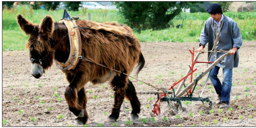
Le baudet, le cheval de trait et la mule du Poitou fêtent cette année les 125 ans de leur stud book.

Tête forte, plutôt longue, cuisses musclées, encolure pyramidale... Cette année, les races mulassières poitevines (baudet, cheval de trait et mule) fêtent les 125 ans de leur stud book, standard officiel de la race, ouvert en 1884. À cette occasion plusieurs manifestations sont organisées en Vendée.