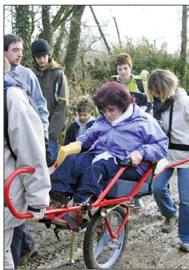
Cinq Joëlettes sont à la disposition des Vendéens.

■ Renseignements : Journée Découverte le dimanche 21 juin à partir de 10h30 à l'école publique de Montreuil. Vélo-poussoir, hippocampe et joëlette seront à la disposition pour s'initier à ce matériel d'activité nature. Tél. : 02 51 51 93 16 - nadine.robins@wanadoo.fr