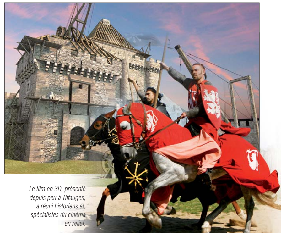
Le film en 3D, présenté depuis peu à Tiffauges, a réuni historiens et spécialistes du cinéma en relief.

■ Renseignements : 02 51 65 70 51 ou www.vendee.fr