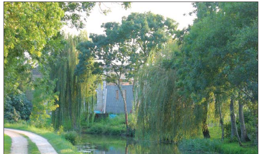
Le projet de charte du Marais Poitevin n'a pas eu l'approbation du Conseil national pour la protection de la nature.