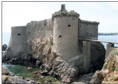
Les abords du Vieux Château.