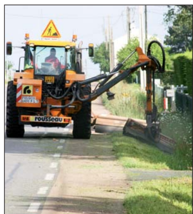
Un fauchage raisonné sur la RD746.

Le Département expérimente le fauchage raisonné le long de quelques routes départementales. En fauchant les bas-côtés à une hauteur raisonnable, cette technique assure la sécurité et protège la faune qui se réfugie dans les fossés.