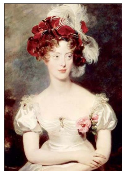
Marie-Caroline, duchesse de Berry.

■ Renseignements : « La Vendée et Madame », inédit d'Alexandre Dumas - Editions Alphonse - 268 pages - 18,90 €.