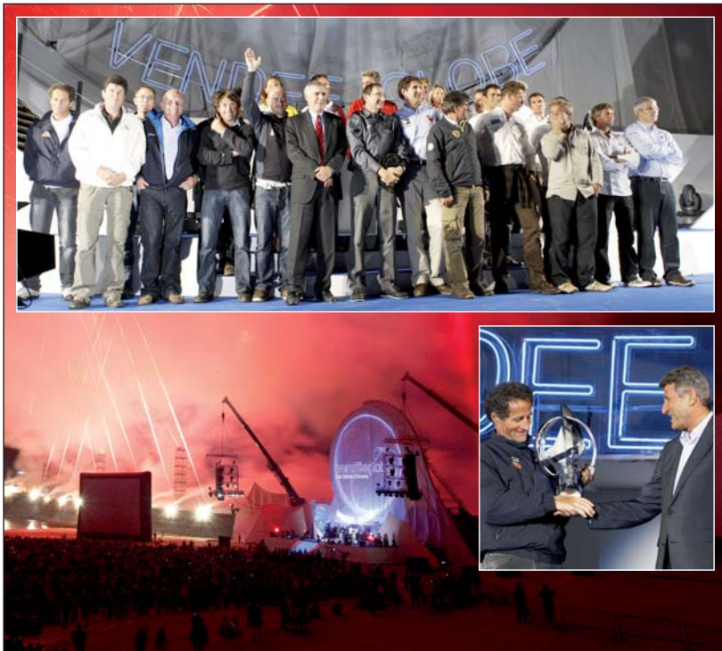
Une soirée de légende pour une course de légende.

Une multitude de Vendéens et de passionnés de la course au large s'étendait à perte de vue sur la plage des Sables-d'Olonne pour accueillir une dernière fois ses héros. Et les skippers n'ont pas hésité à lui rendre hommage, ainsi qu'aux 1,6 millions de personnes venus suivre le départ et les arrivées des skippers. « Je