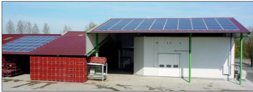
Les bâtiments de Vendélice à Chaillé-les-Marais, sont équipés depuis peu de panneaux photovoltaïques

Et du soleil, à Chaillé-les-Marais, il y en a. L'étude conduite à la demande du Conseil général, l'avait mis en évidence, mais Érable, l'installateur de cette centrale photovoltaïque le confirme largement. Selon son patron, le taux d'enso-