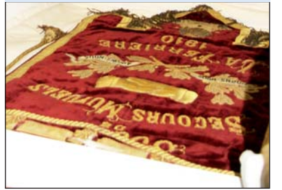
Des œuvres qui témoignent d'un riche passé.

Soixante-dix-sept bannières des Sociétés de Secours Mutuels ont été confiées dernièrement par les communes à l'Historial de la Vendée.