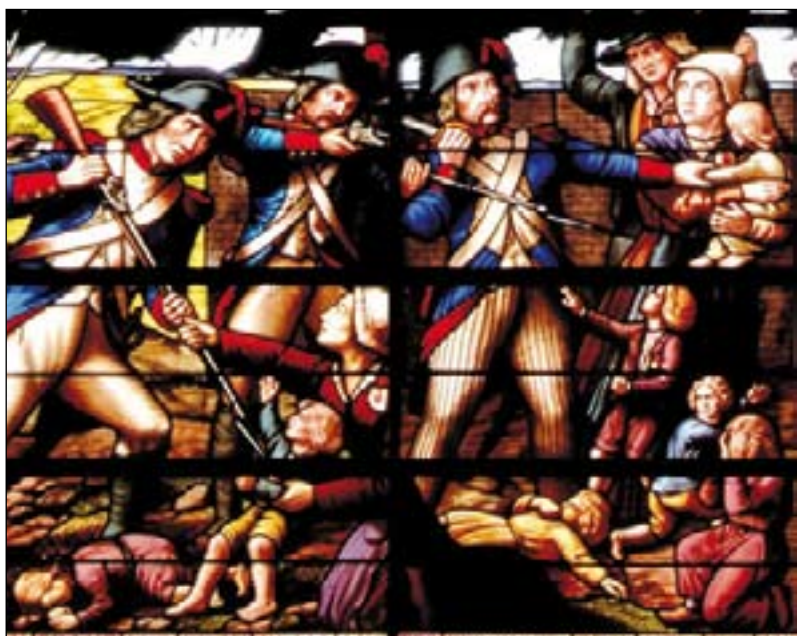
La bataille du Mans, qui a surtout consisté en un massacre de civils par les armées révolutionnaires, a préfiguré ce que seront, les colonnes infernales.

Dans la première des deux fosses dédagées, dans le quartier appelé