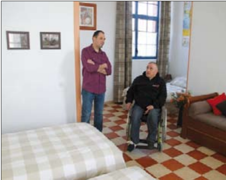
Le label « Tourisme Handicap », un confort supplémentaire apprécié autant par les personnes handicapées que les personnes valides.

À l'heure actuelle, plus de 60 lieux d'accueil touristiques et de loisir du département sont labellisés « Tourisme et handicap ». À l'occasion des