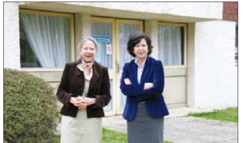
Bientôt, l'hôpital Georges Mazurelle disposera de 162 nouveaux lits.

Le Centre hospitalier Georges Mazurelle fait peau neuve. En 2010, un grand chantier sera lancé. À son issue, le centre disposera de 162 nouveaux lits.