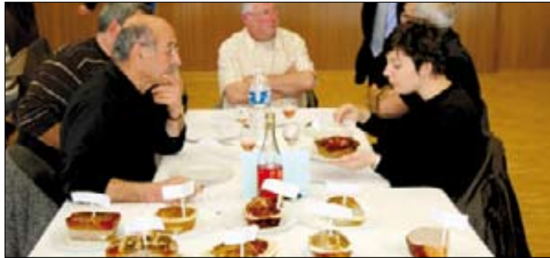
Le pâté de campagne à l'honneur au concours départemental des produits de Vendée.

Lundi 23 mars dernier, le concours départemental des produits de Vendée a couronné pour la première fois un pâté de campagne vendéen à côté des nombreuses recettes qui ont fait, en 2008, la richesse de la gastronomie vendéenne.