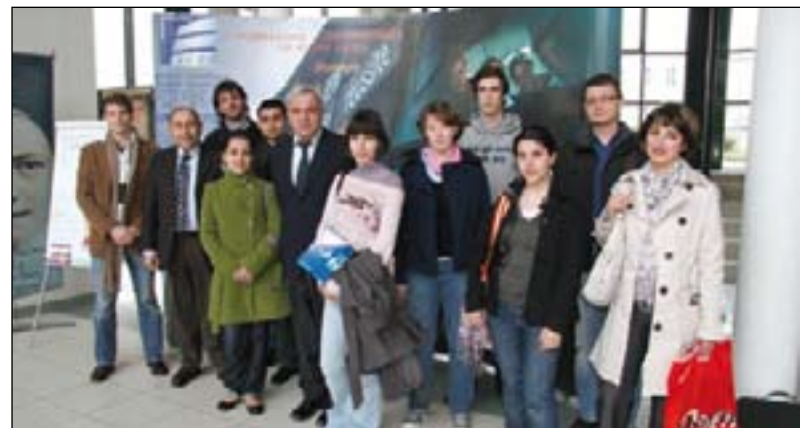
Avec l'association Politeia ( http://politeia.ices.free.fr/ ) les Arméniens ont découvert la vie étudiante française.