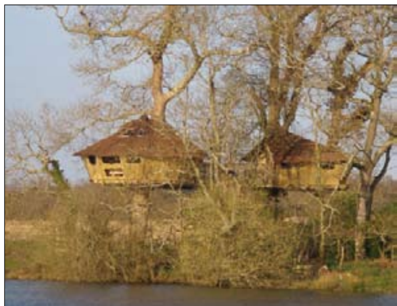
La cabane se niche dans un chêne plusieurs fois centenaire.

Suspendue à un chêne plusieurs fois centenaire, la « cabane » surplombe un étang. De la terrasse, qui se dresse à six mètres de hauteur, on découvre une jolie vallée qui se perd en paysage bocager. La maison de bois qui épouse les branches maîtresses de l'arbre, est hors du temps, sans eau ni électricité. On s'y éclaire à la bougie et on n'y dispose, pour toute commodité, que d'une toilette sèche, à la mode écolo. Pour l'eau courante, il faut se rendre aux sanitaires situés un peu plus loin.