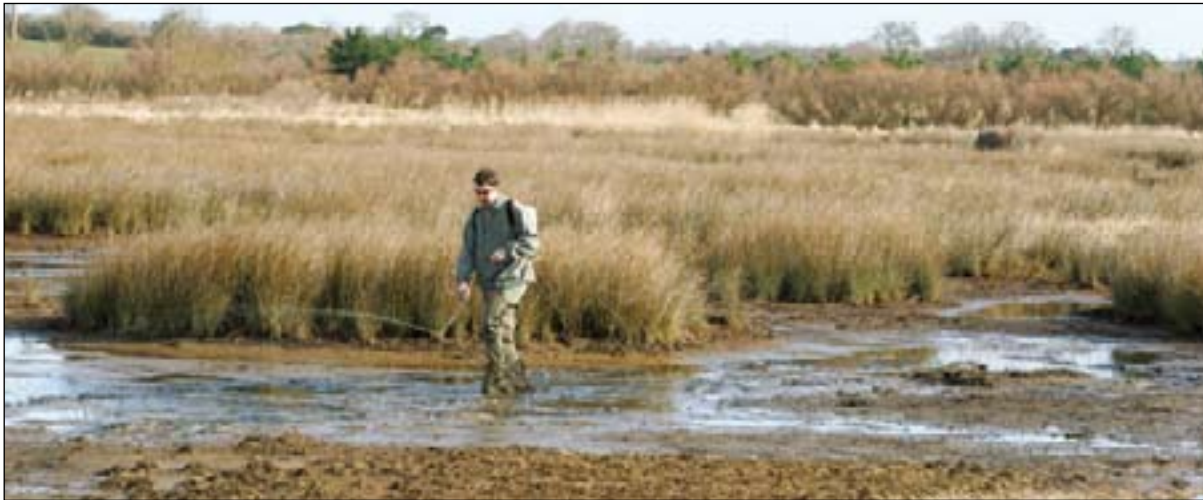
La campagne pour la démoustication a commencé sur les marais de Cochetière à Olonne-sur-Mer.