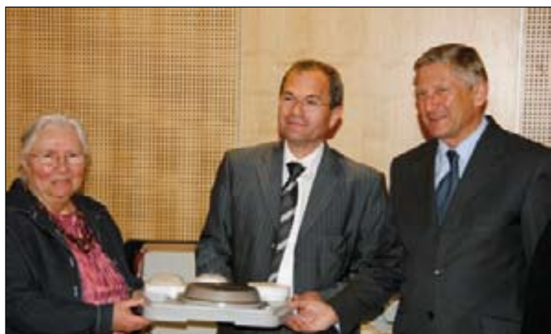
Pour les personnes âgées, les repas sont désormais livrés à domicile.