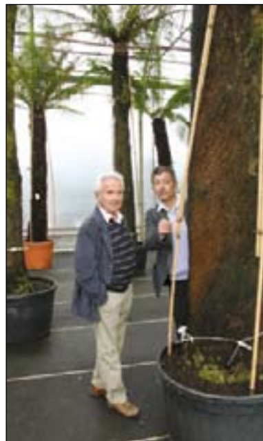
« Ces fougères venues d'Australie s'adaptent très bien à nos climats. »

Les 8 et 9 mai prochains, les Pépinières Ripaud présenteront aux Floriales de Nantes des spécimens de fougères arborescentes de près de 5 mètres de hauteur. L'occasion de présenter le savoir-faire de ces pépiniéristes du bocage.