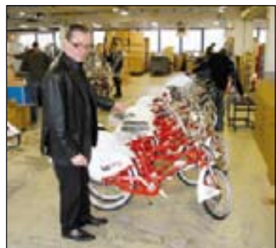
Intercycles fabrique actuellement les futurs vélos en libre-service de Barcelone.