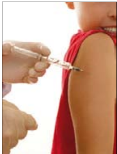
Bien penser à faire vacciner son enfant contre la rougeole.

Le centre de vaccination de Vendée rappelle l'importance du vaccin contre la rougeole, maladie infantile (et adulte) n'ayant pas dit son dernier mot.