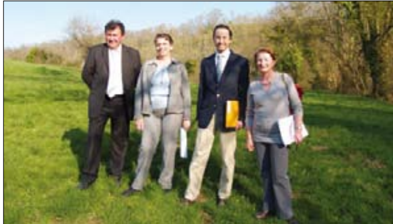
L'espace naturel du Sauvaget vient d'être ouvert au public.

Le Département a ouvert au public les aménagements de l'Espace Naturel du Sauvaget. Un autre site emblématique du Sud Vendée bénéficie des soins du Conseil général le dernier chevelu du Marais Poitevin.