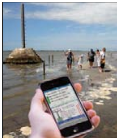
Les horaires du Gois peuvent être téléchargés directement sur les téléphones.

tion se fait avec le point de curiosité le plus proche, comme la Tour Eiffel pour Paris. Après, le logiciel nous donne la direction. »