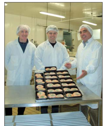
Fruit de la coopération vendéo-gaspésienne, le partenariat entre Cusimer et le Marin Vendéen.