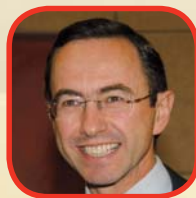
Bruno Retailleau, canton de Mortagne-sur-Sèvre

M. Balladur ne s'est pas aperçu que l'on a changé de siècle. La France du