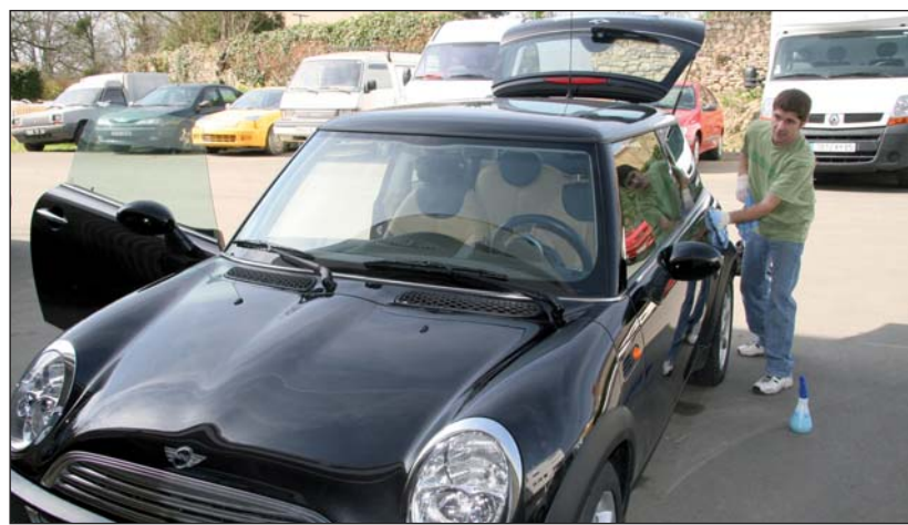
Une voiture toute propre sans une goutte d'eau et avec des produits « bio ».

■ Renseignements : 06 21 98 63 75 ou www.nettoyage-auto-vendee.fr