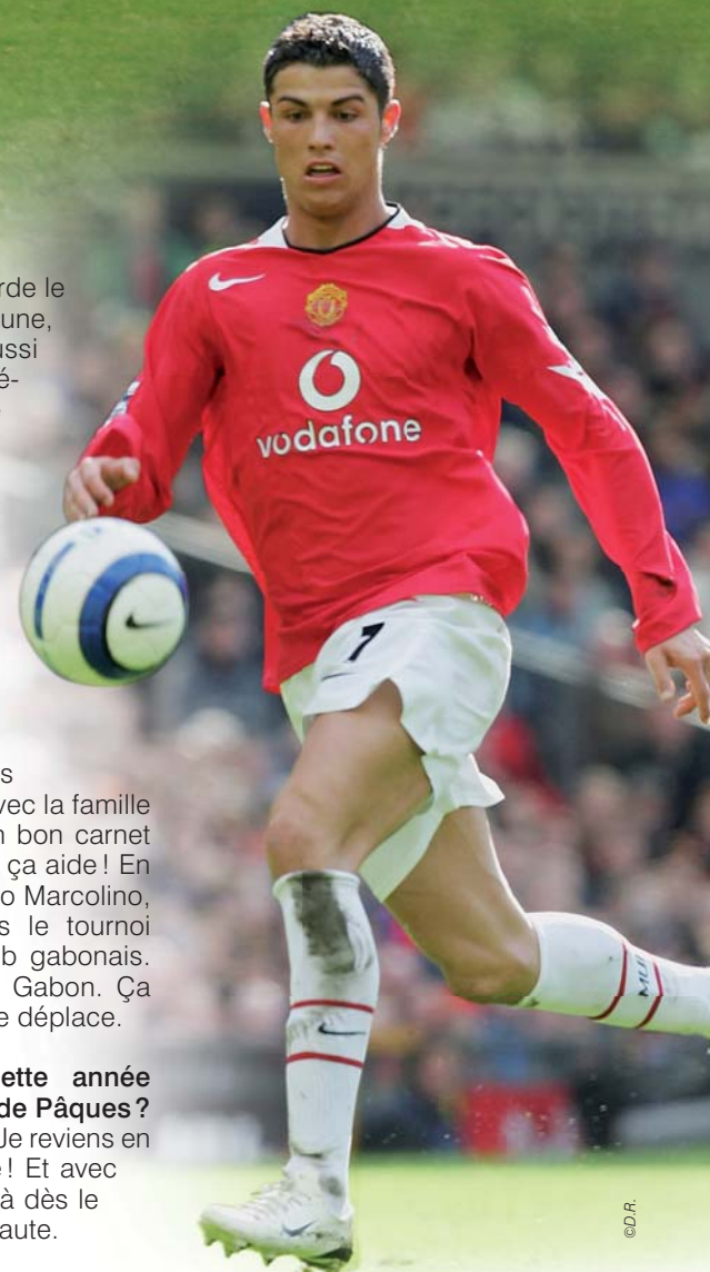
Les grands noms du ballon rond, comme Cristiano Ronaldo, sont passés par la Vendée.

Je viens en Vendée ! Je reviens en Vendée, devrais-je dire ! Et avec grand plaisir. Je serai là dès le mercredi 8 avril. Sans faute.