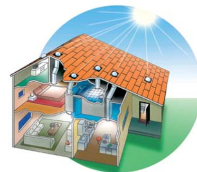
Seule la lumière naturelle illumine cette chambre.

ler un tube de lumière, comme une cheminée, souvent, sur le toit du bâtiment », explique Daniel Pussa. « La lumière est ainsi véhiculée à l'autre bout d'un tube, jusqu'à la pièce souhaitée. » De la cave au grenier, dans les maisons ou les collectivités, la lumière solaire éclaire ainsi chacune des pièces équipées. Le système, dit Solarspot®, a été adopté par des usines ou des grandes surfaces, séduites par les économies d'énergie engendrées.