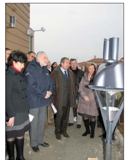
Les Myosotis sont équipés de lampadaires solaires.

À la tombée de la nuit, les lampadaires solaires installés çà et là éclaireront leur chemin. La particularité des Myosotis est d'être à la fois moderne et respectueux de l'environnement.