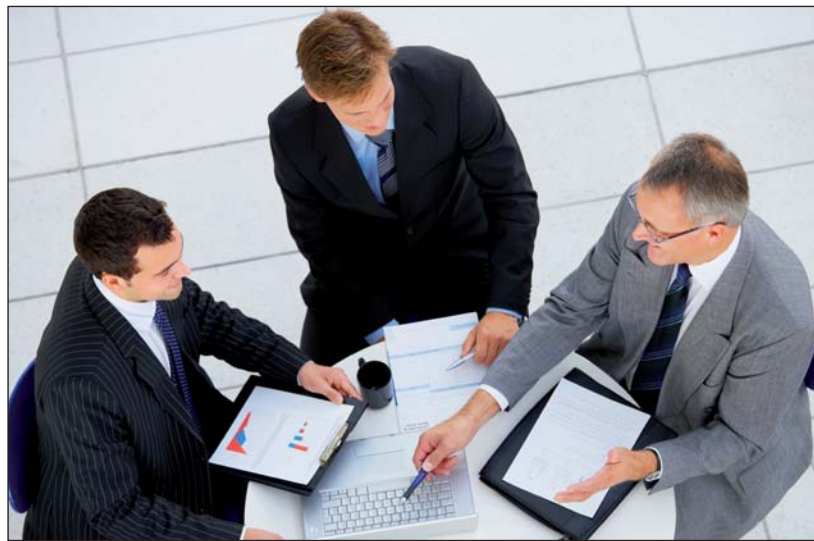
L'école des managers apprend aux futurs entrepreneurs vendéens à gérer leur entreprise de demain.