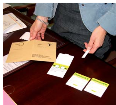
Grâce au test, 90 % des cancers dépistés sont guérissables.