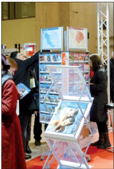
Le CDT a accueilli des milliers de visiteurs sur son stand des gares de Bruxelles.