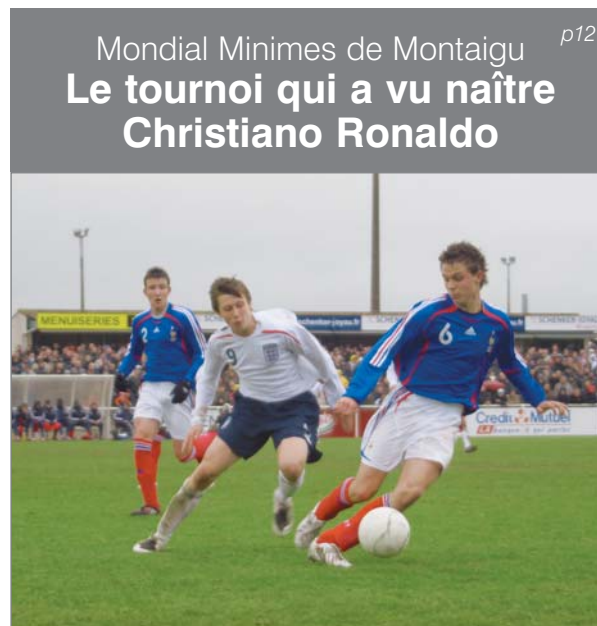
Mondial Minimes de Montaigu p12 Le tournoi qui a vu naître Cristiano Ronaldo