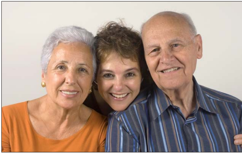
En Vendée, les personnes âgées qui le souhaitent peuvent vieillir à leur domicile, avec le soutien du Département.

En juin prochain, le département va présenter ses actions en faveur des personnes âgées pour les cinq années qui viennent. Maintien à domicile, plus de places en maisons de retraite, accueil des personnes âgées souffrant de la maladie d'Alzheimer, meilleure coordination entre la santé et le social sont les grandes orientations.