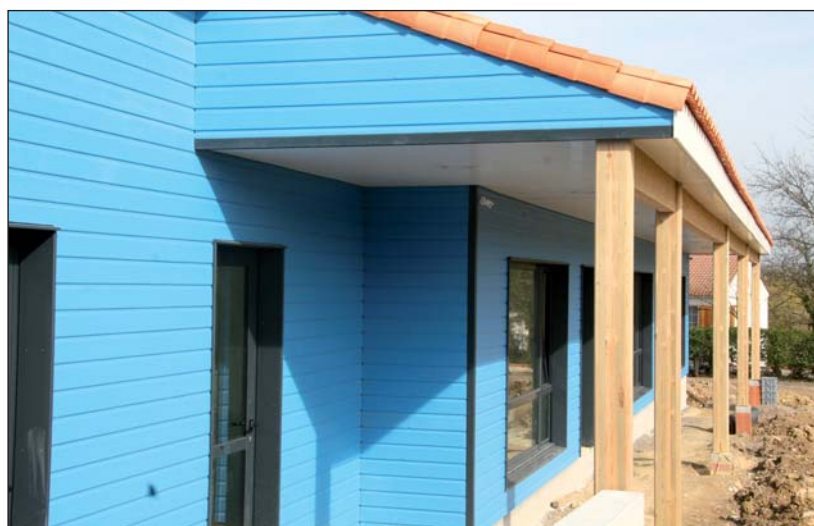
L'école privée de La Chapelle Achard est la première du département à opter pour le bois.

La laine de bois, l'équivalent de la laine de verre, a la particularité