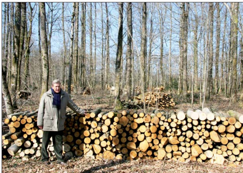
La forêt est forgée par la main de l'homme, notamment des propriétaires privés, qui doivent la gérer.

Une forêt peut-être destinée à la chasse, au commerce du bois et à la promenade. Si les chemins ne sont pas entretenus et si les arbres ne sont pas souvent coupés ni replantés, la forêt devient impénétrable et ne favorise plus le développement de la faune ni de la flore. À terme, c'est toute la biodiversité locale qui peut être menacée.