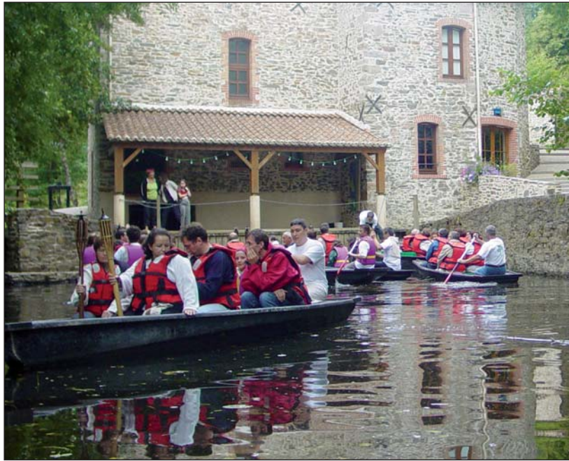
Les balades au fil de l'eau attirent chaque année de nombreux visiteurs, avides de calme et de nature.

Les randonneurs ont quelque dix hectares de sentiers pour flâner à proximité. Par ailleurs, les Vendéens et les touristes profiteront bientôt,