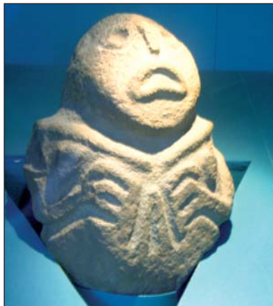
La délégation vendéenne en Serbie a préparé la prochaine exposition à Faymoreau.