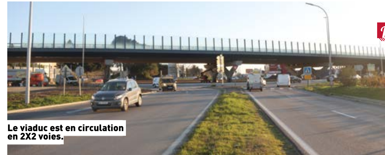
Le viaduc est en circulation en 2X2 voies.