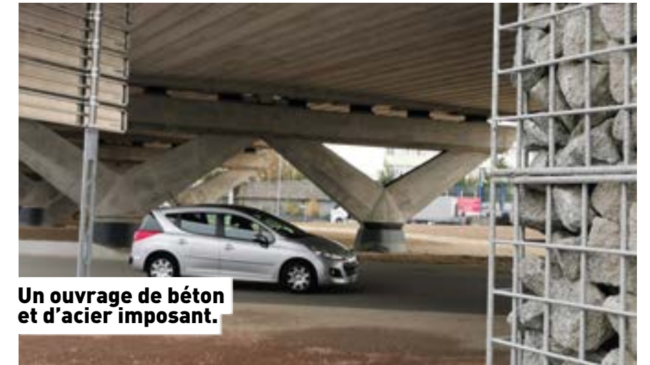
Un ouvrage de béton et d'acier imposant.

Cette réalisation complète celle de la 2X2 voies qui relie la Roche-sur-Yon au rond-point des Établères et aux grands axes autoroutiers. Le chantier est même en avance sur ses prévisions. Les travaux débutés en février 2019 auront duré moins de 2 ans alors même que les entreprises mobilisées ont dû affronter la crise sanitaire. « Le contournement de La Roche-sur-Yon constitue un aménagement indispensable, un vrai service pour tous les usagers de la route et il contribue à désenclaver tous nos territoires », se félicite le Département qui poursuit dès cet été les travaux avec l'aménagement du giratoire des Oudairies-Napoléon Vendée.