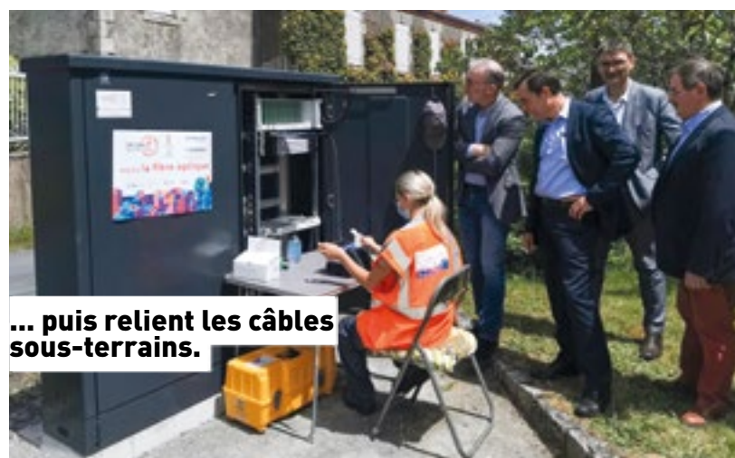
... puis relie les câbles sous-terrains.