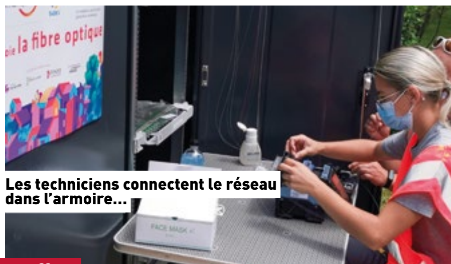
Les techniciens connectent le réseau dans l'armoire...