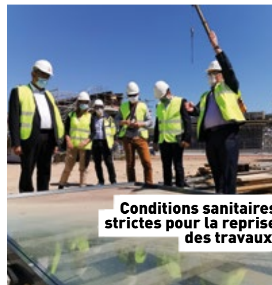
Conditions sanitaires strictes pour la reprise des travaux.