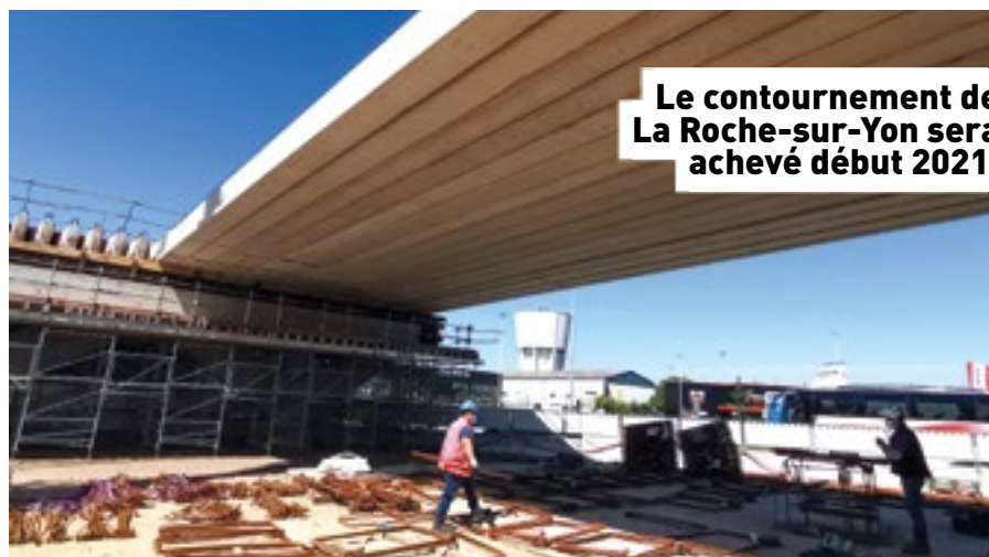
Le contournement de La Roche-sur-Yon sera achevé début 2021.