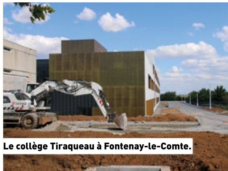
Le collège Tiraqueau à Fontenay-le-Comte.