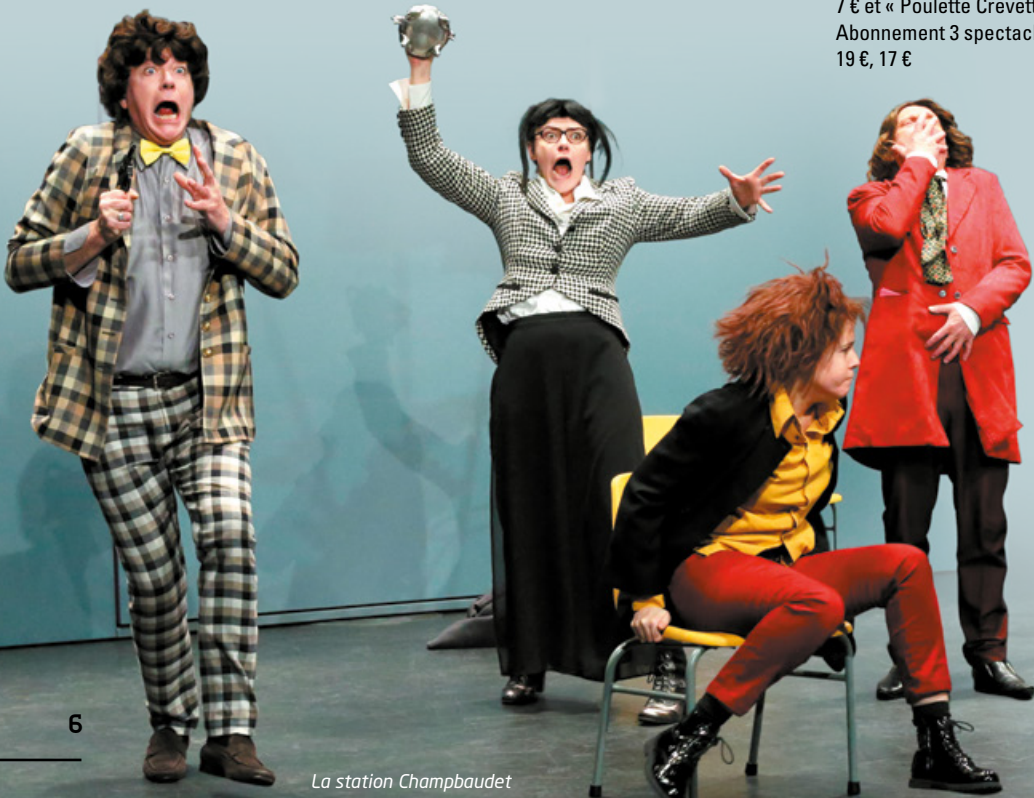
La station Champbaudet

Réservations: www.trpl.fr Tarifs: 22 €, 18 € ou 13 € (sauf pour « Le Bal à Bobby »: 12 €, 7 € et « Poulette Crevette »: 6 €, 4 €) Abonnement 3 spectacles: 19 €, 17 €