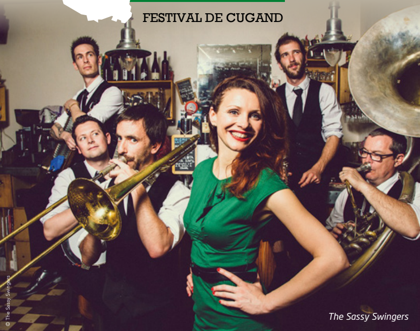
The Sassy Swingers