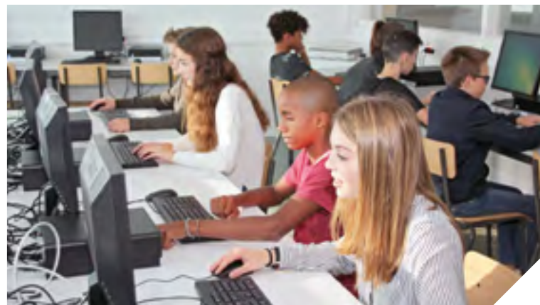
Au collège Paul Langevin à Olonne-sur-Mer, 94 nouveaux PC ont été renouvelés sur un parc informatique de 137 ordinateurs, soit les deux tiers des postes.

Dix-neuf collèges publics ont bénéficié en octobre dernier de la première étape du plan de renouvellement des postes informatiques. Au total, plus de 870 PC ont été changés et financés par le Département. « L'objectif est de mettre à la disposition des collégiens un outil performant pour leur permettre d'apprendre efficacement » souligne Laurent Boudelier,