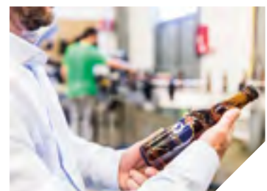
En janvier 2019, Mélusine devrait être en capacité de produire 30 000 hl de bière par an.

Renseignements: www.brasserie-melusine.com