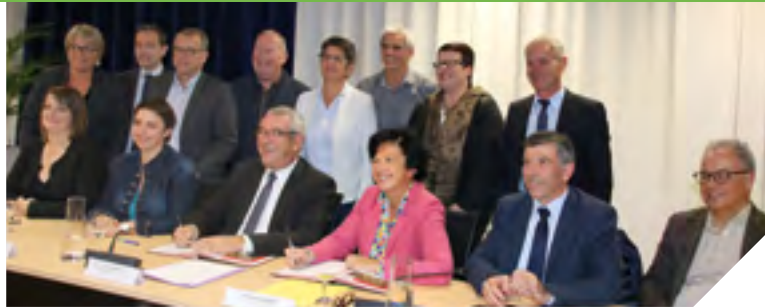
Parmi les 19 projets au Pays des Herbiers figure la création d'un nouveau cinéma de 700 places.