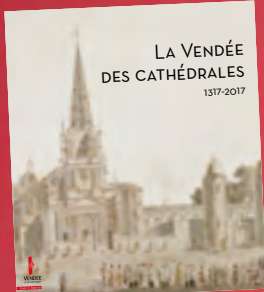
Le catalogue de l'exposition disponible à l'Historial.

vient affaiblir l'Église avant de connaître un nouvel élan dans la deuxième moitié du XIX e siècle. Toutes ces périodes sont présentées lors de l'exposition, jusqu'à la venue du Pape Jean-Paul II, à Saint-Laurent-sur-Sèvre, en 1996. Manuscrits enluminés, objets liturgiques, tableaux, sculptures... De nombreux objets évoquant les lieux emblématiques du christianisme vendéen sont exposés à cette occasion. « Pour rendre accessible cette exposition au plus grand nombre, plusieurs historiens apportent leur éclairage, via des vidéos, dans chaque espace », souligne Yves Auvinet, président du Département. Un aspect qui sera sans aucun doute apprécié par le jeune public.