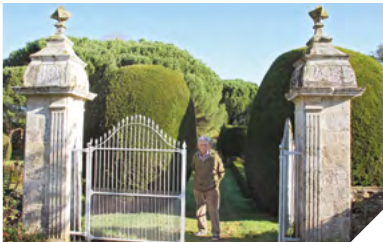
François Garret pose derrière la magnifique grille qui, une fois ouverte, dévoile des alignements d'ifs qui ont traversé les siècles.

Effectivement, le dessin des jardins et, merveille des merveilles, les alignements d'ifs (90 au total!) ou encore cet étonnant dénivelé formant des terrasses naturelles sont l'œuvre du prieur de l'époque.