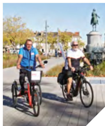
« AVC, tous concernés » et « France Adot » à vélo pour une opération de sensibilisation.

L'association « AVC, tous concernés » sensibilise la population aux signes d'alerte d'un AVC.