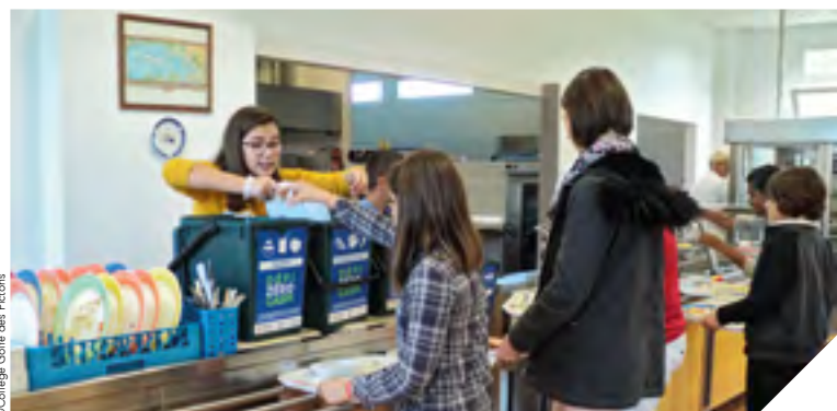
Les bio-seaux, fournis par le Département, permettent de trier les déchets mais également de peser séparément les composantes d'un repas: entrée, viande, poisson, dessert...

540 000. C'est la quantité, en tonnes, de nourriture jetée dans les restaurants scolaires en une année, en France. Un gaspillage contre lequel le Département lutte en lançant le DéfiZéroGaspi dans tous les collèges publics. « L'objectif est de réduire de 30 % le volume des déchets, explique Laurent Boudelier, vice-président du Département en charge des collèges. Des kits anti-gaspillage, comprenant notamment des