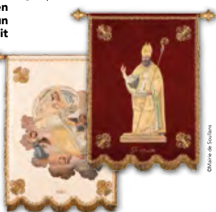
La bannière de l'Assomption, recto et verso, à Soullans, après sa restauration.

est de nouveau visible, dans un coffre-fort vitré, financé par le Département. De quoi la protéger pour les décennies à venir.