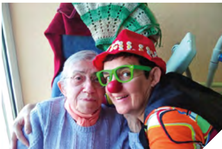
Les membres de l'association « Clowns et Vie » interviennent aussi en Ehpad.