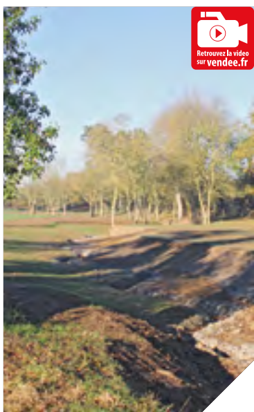
Une renaturation du cours d'eau de l'Issoire sur la base du cadastre napoléonien.

à venir épier ou admirer lors d'une balade sur le site sulpicien.