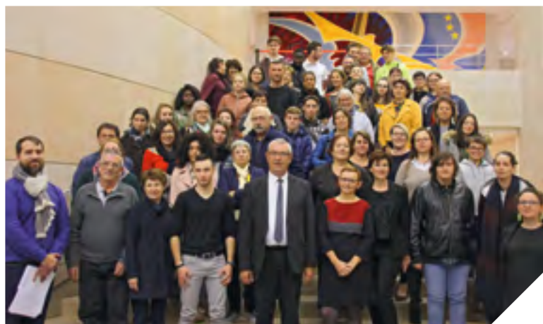
Reconnaissance et récompenses aux jeunes de l'Aide Sociale à l'Enfance pour leurs bons résultats. Un encouragement pour l'avenir.

Vingt-neuf jeunes étaient reçus à l'Hôtel du département, le vendredi 10 novembre pour fêter leur réussite.