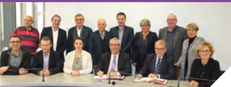
Le Contrat comprend notamment la construction d'une salle de gymnastique à Chavagnes-en-Pailleurs.

PAYS DE SAINT-FULGENT - LES ESSARTS (10 COMMUNES, 27 000 HABITANTS) : 11 PROJETS POUR 2,1 MILLIONS D'EUROS