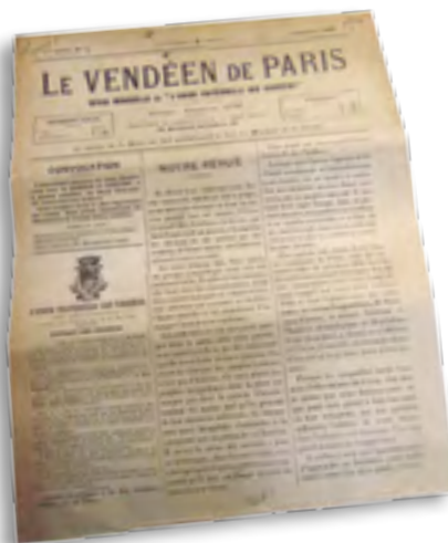
La Une du premier numéro de Le Vendéen de Paris , décembre 1897.

Et aujourd'hui? La ligne éditoriale du journal n'a pas vraiment changé depuis décembre 1897. Faire vivre l'identité vendéenne et ce lien à la Vendée demeurent notre objectif.