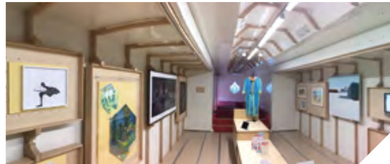
Le semi-remorque se déploie comme un accordéon pour révéler l'exposition du Frac.

Invitation également à la curiosité face aux quatorze œuvres issues des collections du Frac (Fonds régional d'art contemporain). L'exposition sera visible du 11 au 15 décembre à La Châtaigneraie, du 8 au 12 janvier à Luçon, du 15 au 26 janvier à Pouzauges et du 29 janvier au 9 février à Fontenay-le-Comte. Impossible de passer à côté sans le voir, le camion pèse