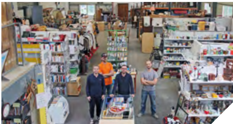
Une partie de l'équipe de Recyc'la Vie dans les 900 m² de la boutique.

ÉDUCATION / PARC INFORMATIQUE DES COLLÈGES