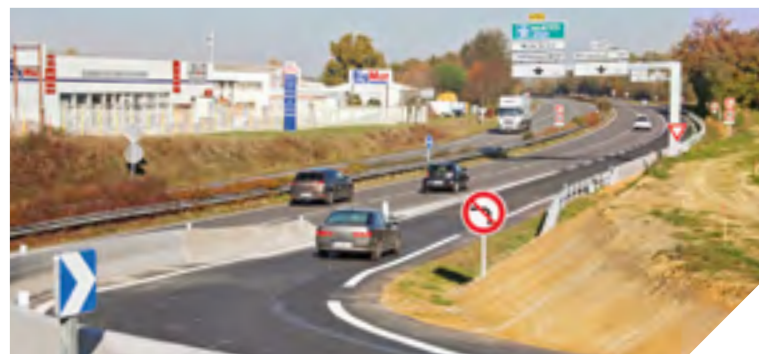
La bretelle de Bellevigny est ouverte depuis le lundi 20 novembre.

empruntent cette route départementale entre Dompierre-sur-Yon et Belleville-sur-Vie (Bellevigny). Ce nouvel aménagement permet désormais aux automobilistes et aux poids lourds, venant du sud de la commune, d'éviter de traverser le bourg (et la zone à proximité du collège Saint-Exupéry) pour rejoindre la 2x2 voies en direction de Montaigu. Grâce à ces travaux, le trafic est plus fluide et la sécurité renforcée.