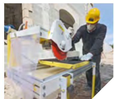
Les disques de découpe de Samédia sont utilisés par de nombreux professionnels.