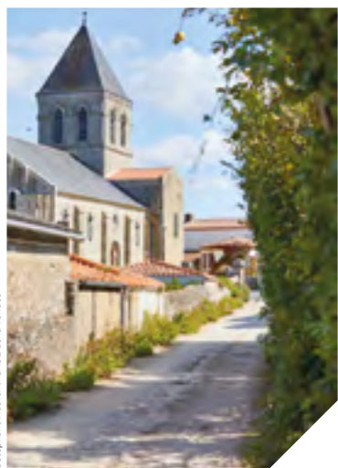
La Chaize-Giraud a reçu le 1 er Prix départemental des communes.

Où se situent les plus beaux jardins de Vendée? C'est à cette