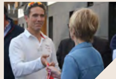
Le skipper Tanguy de Lamotte lors de l'inauguration de la résidence qui porte son nom.

C'est une résidence pas comme les autres qui a été inaugurée début septembre aux Sables-d'Olonne. 30 logements en accession à la propriété ont été livrés par Vendée Habitat. Et le skipper Tanguy de Lamotte a accepté de parrainer l'opération en donnant son nom à la résidence. Présent le jour de l'inauguration, le marin a remis les clés aux futurs propriétaires. Le programme, qui est le fruit d'un partenariat entre BMP Promotion et Vendée Habitat, comprend également 45 locatifs. Cette opération vise la mixité sociale tout en facilitant l'accès à la propriété aux ménages modestes. Un projet humain et solidaire, à l'image des valeurs portées par Tanguy de Lamotte qui parcourt les océans au profit de Mécénat Chirurgie Cardiaque.