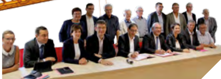
Signé le 1 er septembre avec la Communauté de communes Vie et Boulogne, le contrat Vendée Territoires va permettre de soutenir 31 projets.

Début septembre, deux nouveaux contrats Vendée Territoires ont été signés entre le Département et les Communautés de communes Vie et Boulogne et Moutierrois-Talmondaï. Des contrats qui permettent de soutenir la réalisation de près de 70 projets.