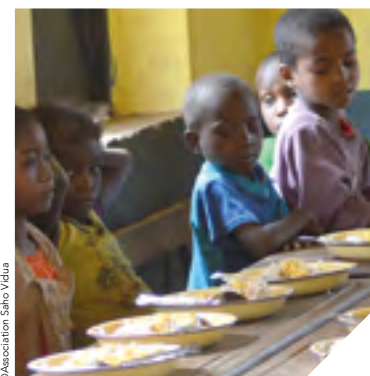
Les enfants de Sahokifa prennent désormais leur repas dans leur cantine scolaire.

L'association Saho Vidua est basée à Mervent. Elle a pour objectif de soutenir la communauté malgache, notamment les enfants, par le biais de projets éducatifs. L'année dernière, une cantine scolaire a été construite à Sahokifa grâce au soutien du