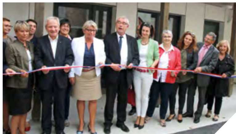
Le nouveau bâtiment offre 15 places en internat 365 jours par an et 24h/24.

adolescents et une unité « mère enfants ». 177 enfants ont été accueillis courant 2016.