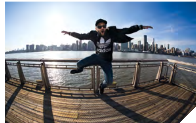
DJ Gramatik à l'affiche de la 1ère édition du Festival Les Nuits Courtes à Fontenay-le-Comte.