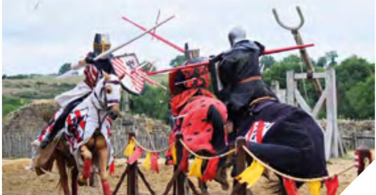
La compagnie Capalle se produit sur 320 spectacles par an.

Pendant tout l'été, ils ont fait rêver la Vendée avec leurs spectacles équestres. « Ils », ce sont les douze cavaliers de la compagnie Capalle, située à Saint-Malô-du-Bois. Depuis trois ans, ils enchaînent cabrioles, joutes et pirouettes sur chevaux dans les châteaux de Tiffauges et de Talmont mais aussi lors de fêtes médiévales, loin des frontières vendéennes: « La saison s'est très bien passée, confie Eddy Riot et Charlyne Martin, les deux cogérants de l'écurie. Beaucoup de spectateurs viennent nous voir après le show pour nous féliciter. C'est encourageant! »