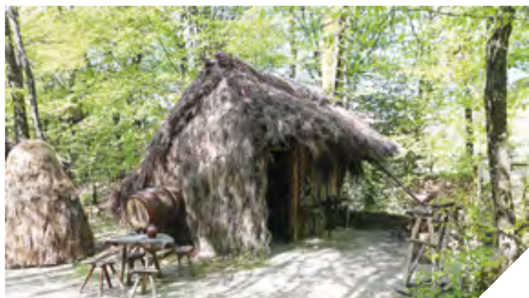
Après sa défaite début 1794 à Machecoul, Charette se réfugie dans la forêt de Grasla, aux Brouzils. Il y établit un camp avec un hôpital de campagne, des forges, des fontaines...

Grâce au guide « Avec Charette, roi de la Vendée » édité par le Département dans la collection Vendée Patrimoine, il vous est désormais possible de partir sur les traces du célèbre Général. Du Logis de Fonteclose à la forêt de Grasla, en passant par le château de la Boulaye, découvrez l'incroyable parcours de François-Athanase Charette de la Contrie.