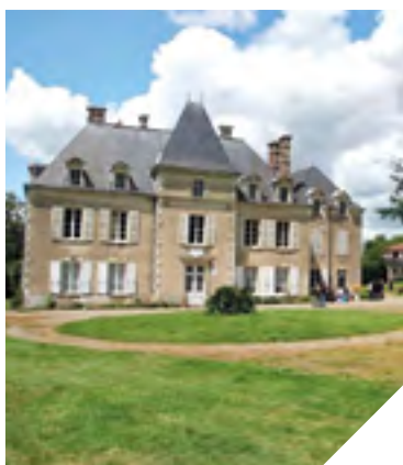
Le château du Bois-Tiffrais à Monsireigne.

détour pour le château du Bois-Tiffrais, dans lequel il se trouve. Les visiteurs pourront y apprécier les intérieurs d'une véritable demeure du Second Empire.