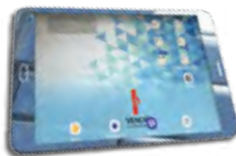
Une tablette figure notamment dans le kit.

L'objectif est que les bibliothèques, via les bénévoles, se familiarisent avec les outils et les contenus numériques (livres, musique, applications...). La BDV (Bibliothèque Départementale de Vendée) propose un accompagnement et/ou une formation au préalable (utilisa-