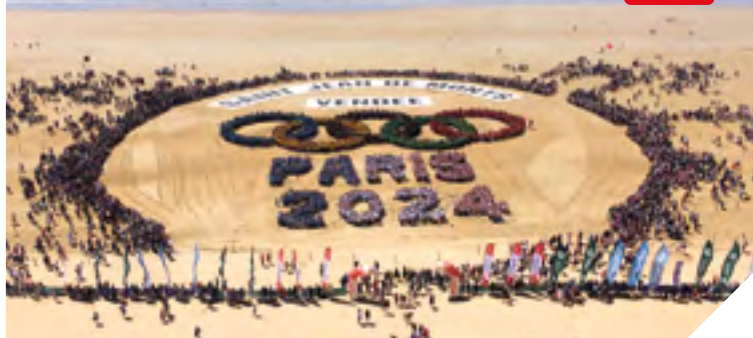
À St-Jean-de-Monts cet été, les jeunes sportifs de Footocéane ont réalisé une fresque géante.

La Vendée terre de sportifs a les yeux tournés vers Paris 2024! Le Département de la Vendée et le CDOS 85 ont ainsi créé le Club Vendée 2024: « Le Club Vendée existe depuis plusieurs années, expliquent-ils. Il est composé d'athlètes de haut niveau, en sport et en handisport, évoluant dans des disciplines olympiques ou non ». Aujourd'hui,