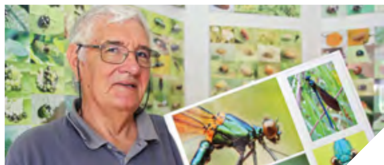
« Il faut apprendre à connaître les insectes pour savoir les photographier » Jean-Luc Trichereau.

SPECTACLE / COMPAGNIE CAPALLE, À ST-MALÔ-DU-BOIS