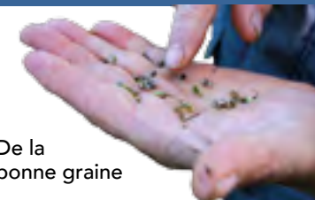
De la bonne graine

N'oublions pas la graine, le chènevis, prise elle aussi. Elle se mange et, si les oiseaux en raffolent, les hommes ne sont pas en reste. Transformée en farine ou en huile aux notes de noisettes (alimentation, cosmétiques, peintures ou vernis), elle semble assurer au chanvre croissance et prospérité.