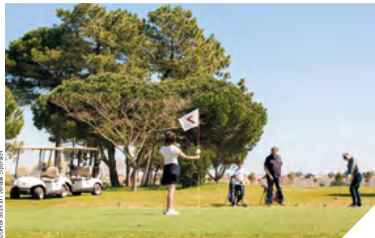
Le golf de la Presqu'île constitue un nouvel atout pour le tourisme vendéen.

Le golf de la Presqu'île comprend un parcours de 9 trous, un pitch and put de 6 trous, un putting-green et un practice. La maison du golf est un vrai lieu de convivialité. Ouverte sur le port, elle accueille les golfeurs mais aussi les plaisanciers et les promeneurs. Une association sportive a également été créée. Comportant déjà une centaine de membres, elle propose animations, sorties et compétitions.