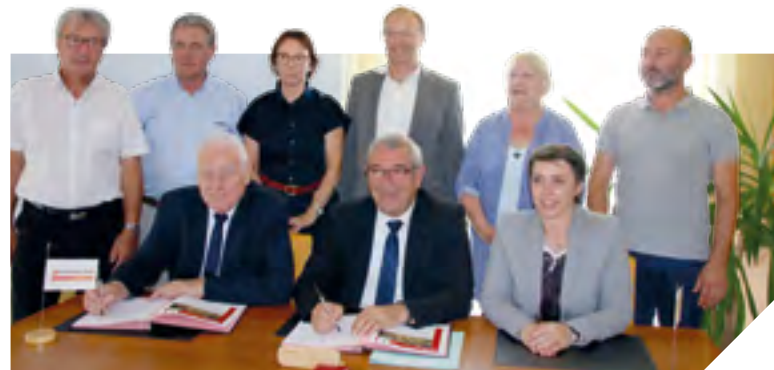
À Océan Marais de Monts, 19 projets composent le contrat Vendée Territoires.

Plus au nord, la Communauté de communes Océan Marais de Monts a signé son contrat Vendée Territoires lundi 10 juillet. Là aussi, de nombreux projets sont en jeu, notamment en matière de tourisme avec la création et la rénovation de points d'information touristique au Perrier et à Soullans ou encore la poursuite des aménagements du Daviaud. Plusieurs équipements sportifs vont également être modernisés tandis que la place de l'église, à Saint-Jean-de-Monts va être rénovée. Par ailleurs, ces deux contrats Vendée Territoires comprennent des projets d'intérêt communal comme la transformation de centres-bourgs ou la création de nouveaux équipements (cantine,