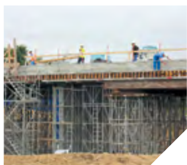
La section entre Aizenay et La Vie couvre quatre kilomètres.

Les travaux routiers prévus entre Aizenay et Challans se