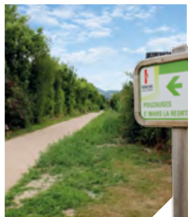
La piste cyclable a été inaugurée le 11 juillet.

Ces travaux profiteront notamment aux touristes. Ils pourront désormais se rendre à vélo au Puy du Fou mais aussi découvrir la Vallée de Poupet ou encore la petite cité de caractère de Mallièvre.