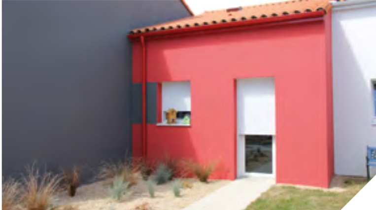
La maison « Les Lauriers d'Apprentis d'Auteuil », située à La Roche-sur-Yon, a ouvert ses portes à des jeunes âgés de 13 à 18 ans. Le cadre est lumineux et verdoyant.

L'objectif est d'accompagner les jeunes, filles et garçons, qui ont investi des locaux neufs depuis plusieurs mois. Deux maisonnettes et un studio familial de 30 m 2 forment des bâtiments lumineux, colorés et