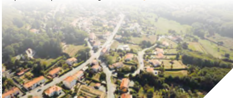
La démarche Bimby a pour but de limiter l'étalement urbain sur les campagnes.