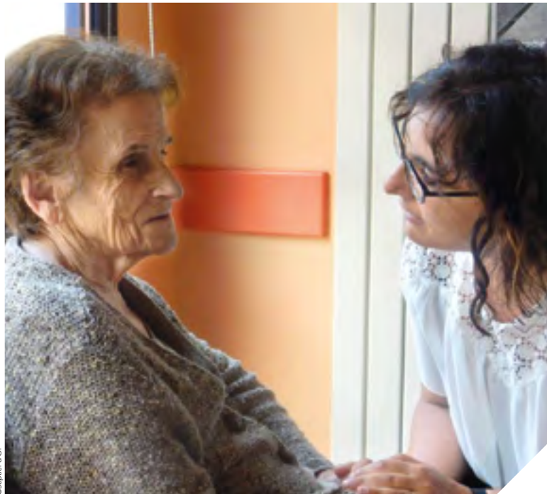
Selon la méthode Validation, le dialogue est une clé pour vivre avec la maladie d'Alzheimer.