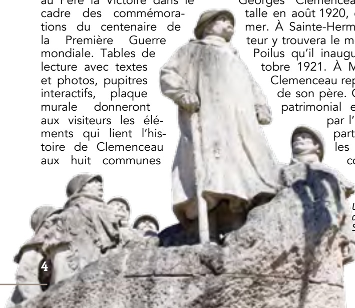
Le mémorial aux Poilus à Sainte-Hermine.

vendéennes précitées. Ce parcours, qui sera installé en novembre prochain, révèle l'homme d'État, l'écrivain, mais aussi le Vendéen, natif de Moulleron-en-Pareds, en 1841. À Saint-Vincent-sur-Jard, c'est plutôt l'écrivain, l'amateur d'art et le collectionneur qui est célébré. Georges Clemenceau s'y installe en août 1920, en bord de mer. À Sainte-Hermine, le visiteur y trouvera le mémorial aux Poilus qu'il inaugure le 2 octobre 1921. À Mouchamps, Clemenceau repose auprès de son père. Ce parcours patrimonial est soutenu par l'État, le Département et les communes concernées.