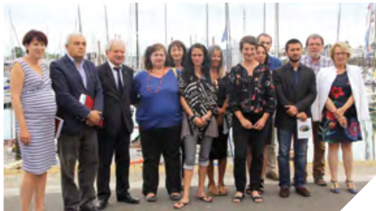
Fin juin, élus du Conseil départemental et participants aux ateliers Redynamisation ont dressé un bilan plus que positif.

Sortir de l'isolement et se remobiliser pour accéder à un emploi ou à une formation. Tel est l'objectif des ateliers « Redynamisation » portés par le Département pour les bénéficiaires du Revenu de Solidarité Active (RSA).