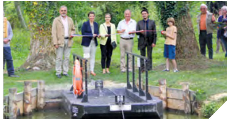
Inauguration le 12 juillet à Vouvant du bac à chaîne qui relie les deux rives de la Mère.

Bonne nouvelle pour les promeneurs : la Mère à Vouvant est désormais franchissable ! Un bac à chaîne permet en effet de relier les deux rives du cours d'eau. Il offre aux habitants et visiteurs la possibilité de boucler un itinéraire de promenade. « Avant le bac à chaîne, nous devions rebrousser chemin, témoigne un Vouvantais. Aujourd'hui il est possible de longer la Mère et de la traverser pour rejoindre notre point de départ ». La Mère, affluent de la rivière la Vendée, embrasse le centre-bourg de Vouvant. Cette petite cité de caractère, l'un des plus beaux villages de France (classé 8 e village préféré des Français), accueille plus de 80 000 visiteurs en juillet et août. « C'est un lieu d'exception où l'on s'efforce de concilier développement et gestion de l'héritage patrimonial, et valorisation auprès du public », a déclaré Cécile Barreau, vice-présidente du Conseil départemen-