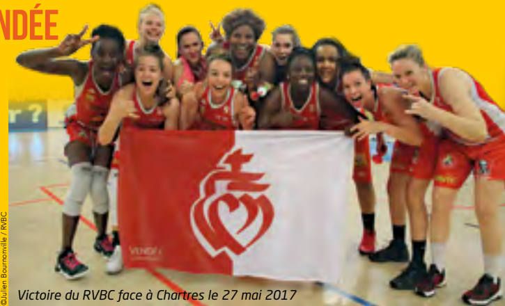
Victoire du RVBC face à Chartres le 27 mai 2017