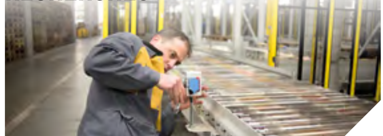
Dynamisme et envie de travailler en équipe sont des qualités requises pour travailler à Sodebo.