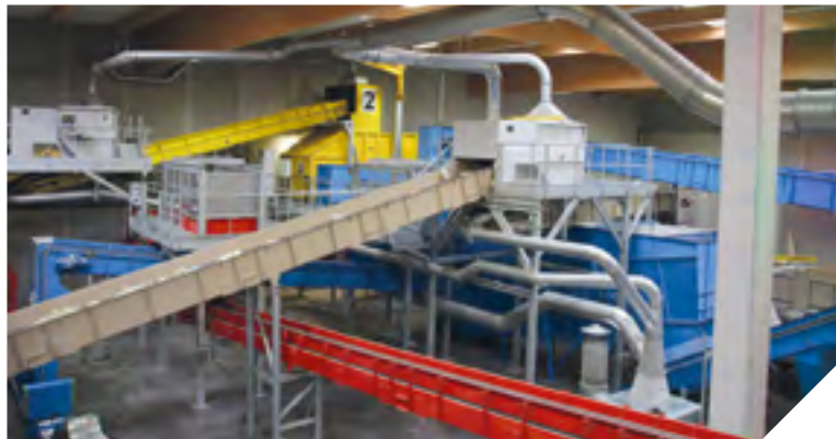
Chaque jour, 100 tonnes d'emballages arrivent dans ce centre à la pointe de la technologie.

Pour trier cette quantité impressionnante de déchets, Vendée Tri peut compter sur un équipement de haute technologie. Sur les 70 000 m 2 de l'usine, un trommel sépare ainsi les emballages par taille et par forme, un séparateur balistique différencie les creux des plats, des électroaimants extraient les déchets contenant du fer et enfin, une machine - un courant de Foucault - isole l'aluminium. Cinq trieurs optiques permettent également, à l'aide d'une caméra