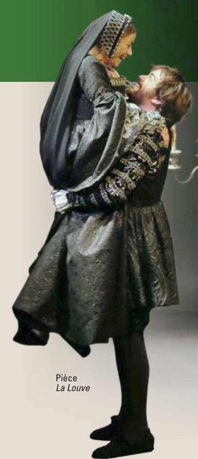
Pièce La Louve

Ce qui est sûr, c'est que chaque soir, à la lueur des premières étoiles, les nombreux spectateurs profiteront d'un cadre magnifique pour (re) découvrir les beaux textes du théâtre français.