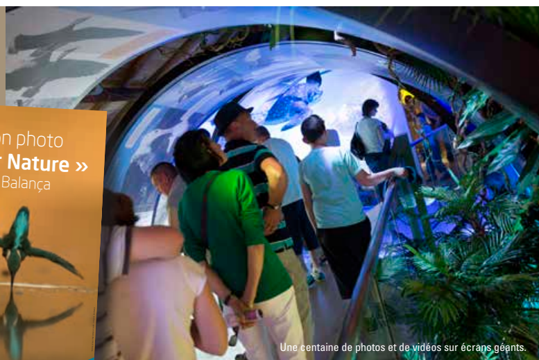
Une centaine de photos et de vidéos sur écrans géants.