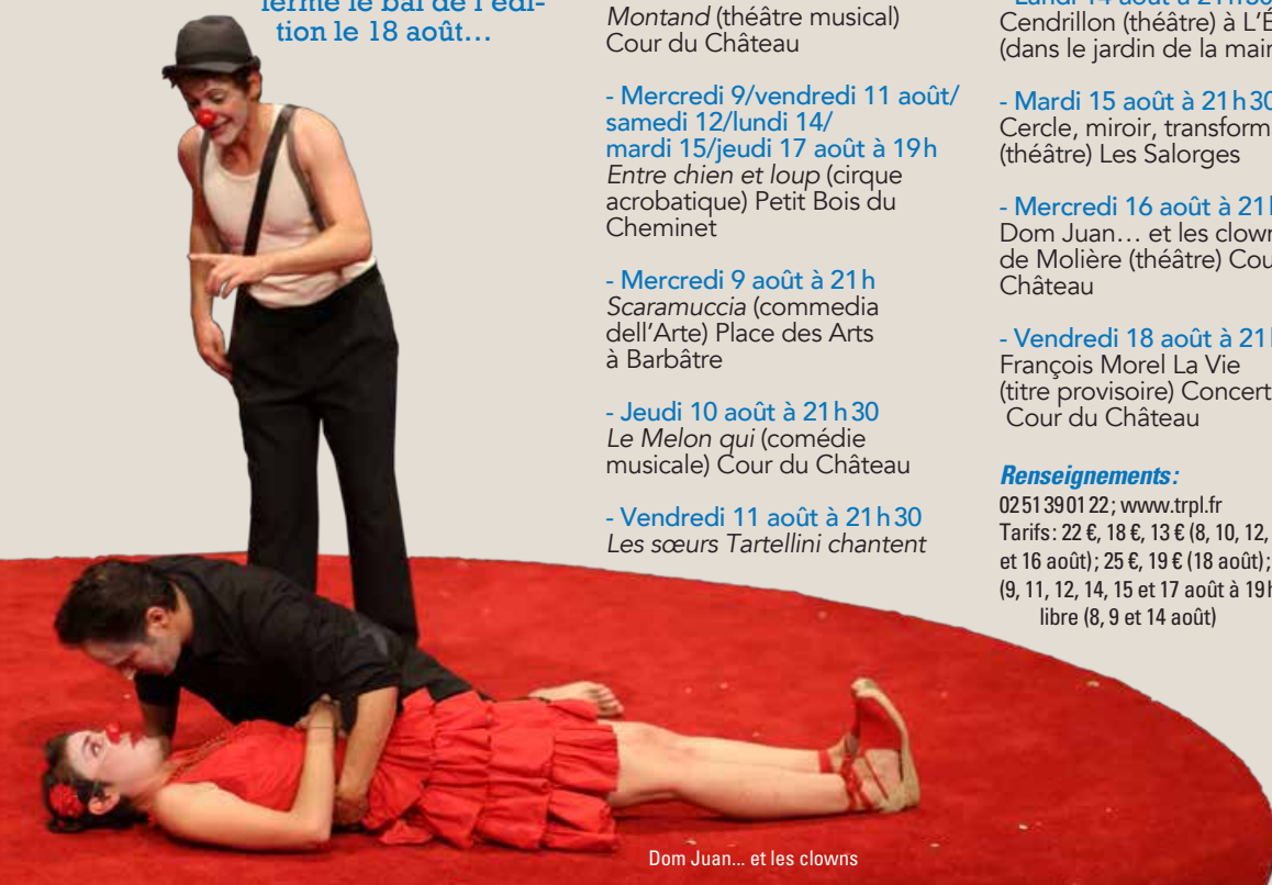
Dom Juan... et les clowns

Renseignements: 0251 39 01 22; www.trpl.fr Tarifs: 22 €, 18 €, 13 € (8, 10, 12, 13, 15 et 16 août); 25 €, 19 € (18 août); 10 €, 5 € (9, 11, 12, 14, 15 et 17 août à 19h); accès libre (8, 9 et 14 août)