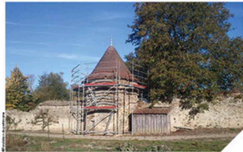
Le chantier devrait se terminer au printemps 2017.

Le Landreau est actuellement une maison de retraite pour les prêtres du diocèse. Au XVI e siècle, c'est probablement au seigneur Charles Rouault et son épouse Catherine de la Rochefoucauld que l'on doit la construction du potager de printemps, du verger et des carrés en îles. Suite aux guerres de religions, ce potager fut clos par un mur et deux tours rondes qui servaient de défense et de logement. De nos jours, ce potager est toujours en activité et constitue un véritable livre à ciel ouvert de l'histoire du XVI e siècle. Pour la restauration du mur et de la couverture des tours, la Fondation du Patrimoine lance une souscription. Le nom des donateurs sera apposé sur le mur.