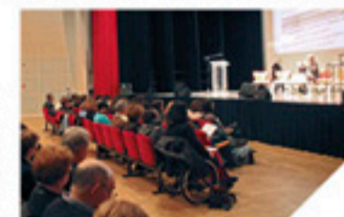
250 professionnels réunis autour de la question de l'incurie dans le logement.