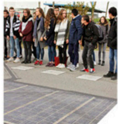
Les élèves du collège Saint Exupéry ont assisté à la mise en place de la route solaire devant leur établissement : elle alimente un panneau informatif.

Le Département de la Vendée est le premier à expérimenter le chantier mondial d'application