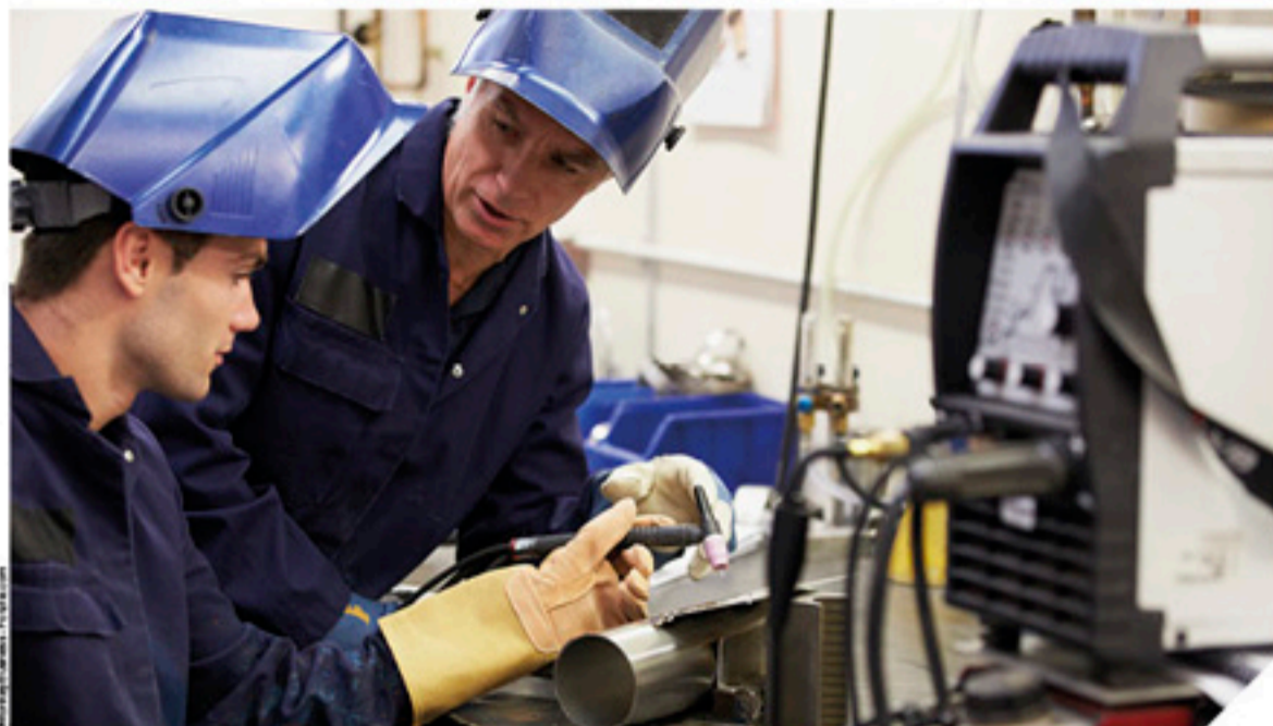
Le Département va expérimenter le contrat Vendée Emploi qui comprendra des incitations pour les employeurs et bénéficiaires du RSA.

Dans le domaine de l'accompagnement social, le Conseil départemental va recruter onze personnes pour mieux suivre les bénéficiaires, en partenariat avec Pôle Emploi. L'objectif est notamment de lever les freins à l'emploi. Parmi ces freins, la mobilité constitue bien souvent une pro-