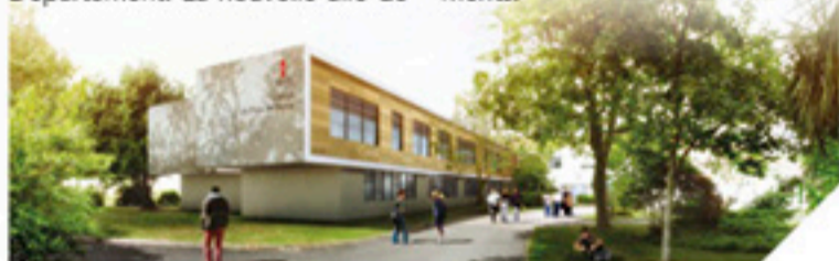
Un projet financé par le Département

1700 m 2 sera accessible pour la rentrée scolaire 2017. Une fois ces travaux terminés, le chantier portera sur le bâtiment actuel. Onze salles seront entièrement rénovées. Un foyer des élèves sera créé. Les cuisines seront modernisées et l'espace de restauration gagnera soixante places. Un préau couvert fera le trait d'union entre les deux bâtiments.