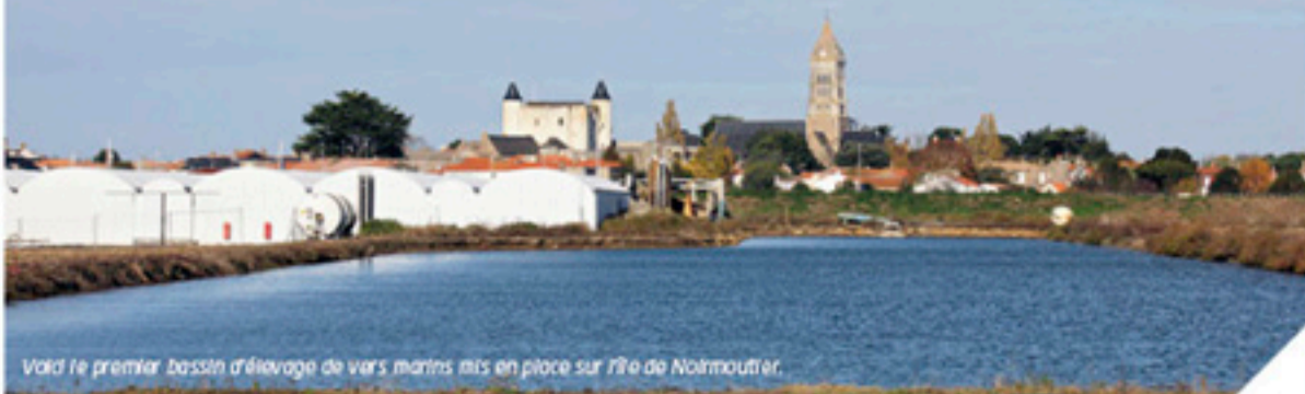
Voilà le premier bassin d'élevage de vers marins mis en place sur l'île de Noirmoutier.

À la Ferme Marine, basée sur l'île de Noirmoutier, l'élevage de vers marins a commencé. Ils possèdent une molécule capable d'oxygéner l'organisme humain. Une révolution médicale.