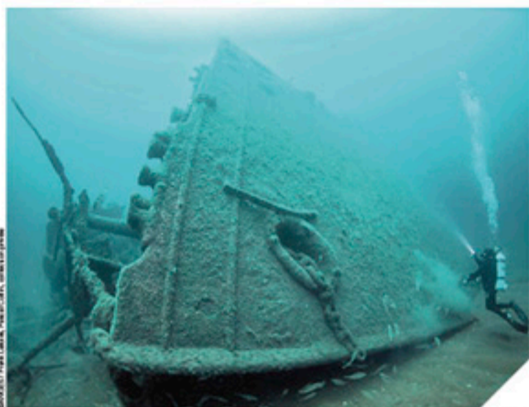
Un plongeur admire l'imposante épave du Sequana. On aperçoit un morceau de la chaîne de l'ancre à sa gauche. En haut de cette page, à droite, la photo du navire avant le naufrage.