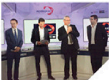
Le PC course partien du Vendée Globe a accueilli la dernière rencontre du Cercle Vendéen.