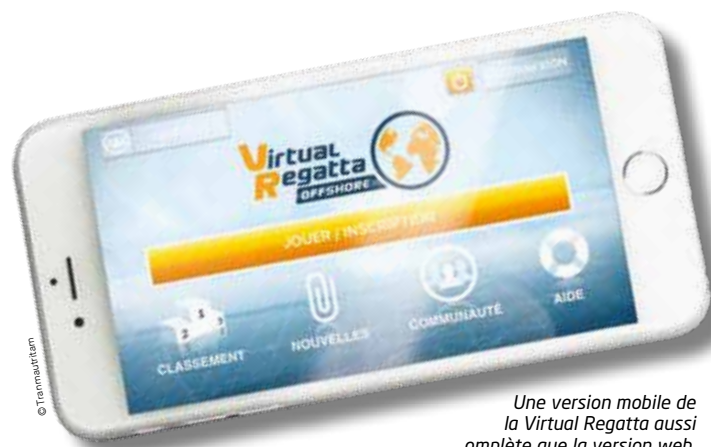
Une version mobile de la Virtual Regatta aussi complète que la version web.