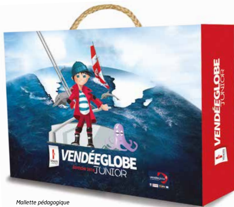
Mallette pédagogique Vendée Globe Junior

En route moussaillons! À l'image de leurs héros qui s'élancent autour du monde, les juniors plongent eux aussi dans l'aventure. Grâce au Département, le Vendée Globe Junior leur donne rendez-vous sur le Village, via une mallette pédagogique ou encore sur le site Internet www.vendeeglobejunior.fr .