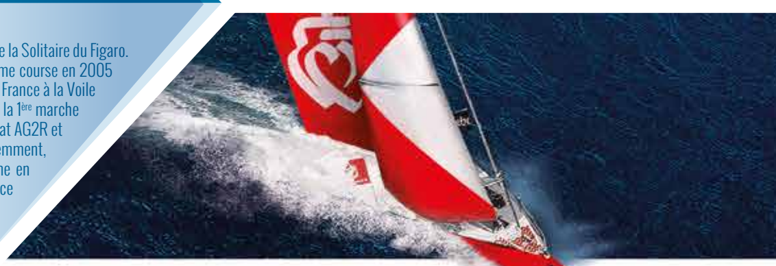
Portraits des skippers : © Studio14 / Vincent Curatier / DPPI / Vendée Globe