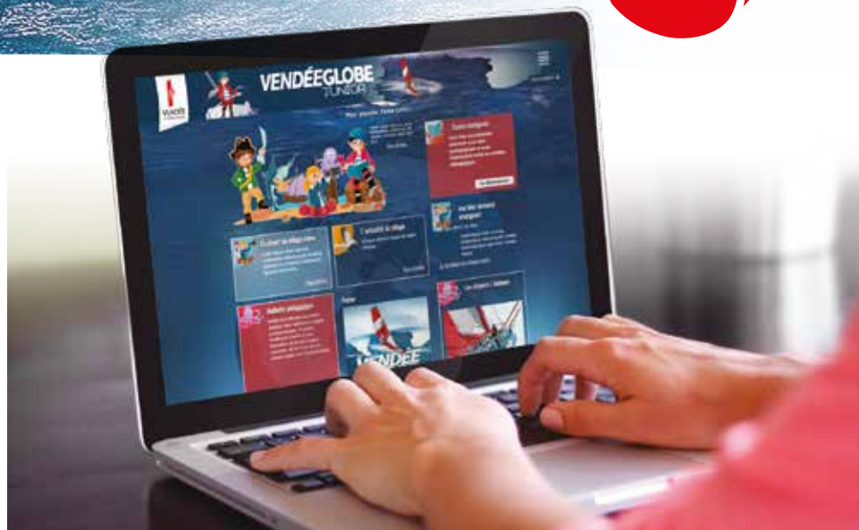
À l'école ou en famille, les juniors peuvent eux aussi vivre l'aventure du Vendée Globe...

Relookée pour l'occasion, la mallette pédagogique Vendée Globe Junior, adressée à près de 650 établissements vendéens, permet de découvrir la course sous divers angles. Une cinquantaine de fiches pédagogiques, trois posters, un kit de suivi de course mais aussi le jeu du skipper composent chaque mallette. Ce contenu est également téléchargeable en ligne.