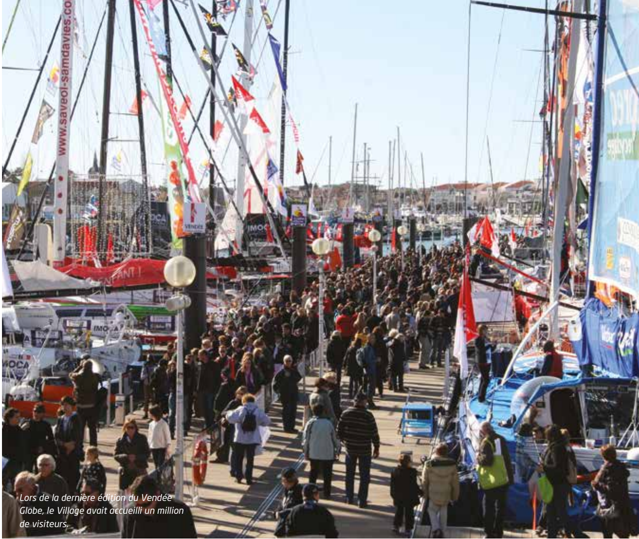
Lors de la dernière édition du Vendée Globe, le Village avait accueilli un million de visiteurs.

Un peu plus loin, les visiteurs pourront aussi déambuler dans un pavillon exclusivement dédié au tourisme. Mis en place par le pôle