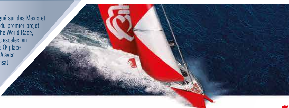
Portraits des skippers