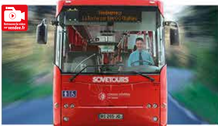
La Roche-sur-Yon/ Challans en moins de 45 minutes depuis le 29 août.