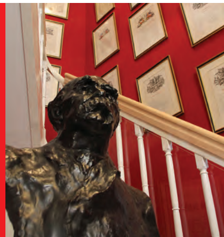
Au musée des deux victoires, le visiteur est accueilli par le buste de Clemenceau.