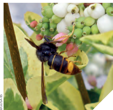
Le frelon asiatique est arrivé en Vendée, en 2008.

INSERTION / PARCOURS DE LA DEUXIÈME CHANCE