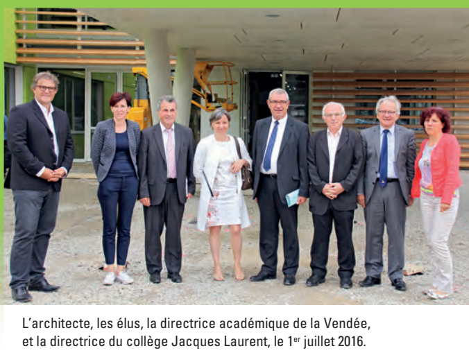
L'architecte, les élus, la directrice académique de la Vendée, et la directrice du collège Jacques Laurent, le 1 er juillet 2016.

Fontenay-le-Comte (Tiraqueau) étude en cours