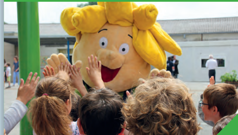
Jim, à la rencontre des élèves de l'école « L'envol » à Sainte-Flaive-des-Loups.

« Terres de Jim » est un événement porté par les Jeunes Agriculteurs avec une ambition affirmée de susciter l'envie des plus jeunes de s'engager dans un des métiers de la filière agricole. La journée du vendredi 9 septembre est d'ailleurs spécialement ouverte aux scolaires.