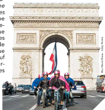
Les meules bleues feront un parcours de 15 km dans Paris, le 11 septembre.

Renseignements : 06 35 07 93 18 www.meulebleue.fr