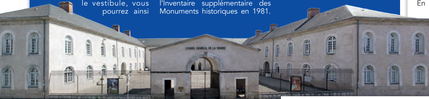
L'Hôtel du Département est un bel exemple d'architecture napoléonienne.

La visite de ce lieu vous permettra également de découvrir l'extension contemporaine ajoutée en 1990. Dans cette partie, vous pourrez en savoir plus sur le fonctionnement du Conseil départemental mais aussi voir l'hémicycle où siègent les 34 conseillers départementaux.