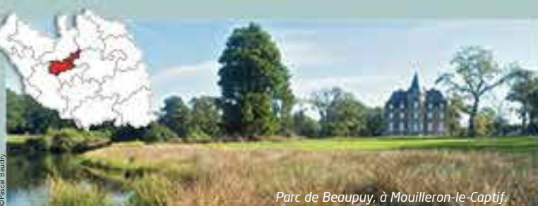
Parc de Beaupty, à Moulleron-le-Captif.

Découvrez le canton de La Roche-sur-Yon Nord à travers quelques-unes des actions du Département.