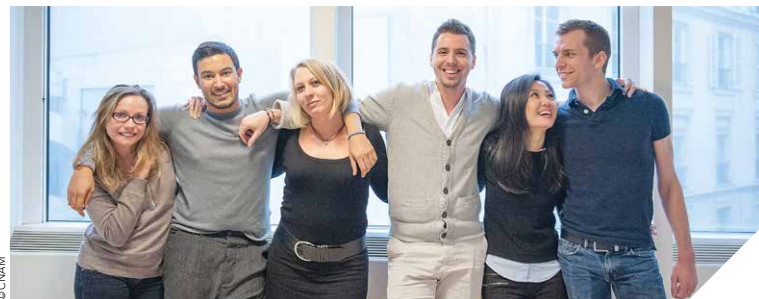
La moitié des cours est dispensée à l'ICES et l'autre moitié au CNAM à La Roche-sur-Yon. La formation au DCG comprend treize unités de 150 heures chacune.

Les besoins en comptabilité et gestion financière progressent en Vendée. Pour satisfaire la demande, l'ICES (Institut Catholique d'Études Supérieures) et le CNAM (Conservatoire National des Arts et Métiers) s'associent.