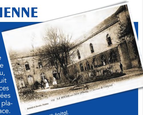
La cour de l'hôpital.

Toujours à La Roche-sur-Yon, rue Foch, l'Hôtel du Département vous ouvrira également ses portes. Hôpital militaire et civil de 1811 à 1977, le bâtiment représente un bel exemple d'architecture militaire napoléonienne. Ses façades et ses toitures ont été classées à l'Inventaire supplémentaire des Monuments historiques en 1981.