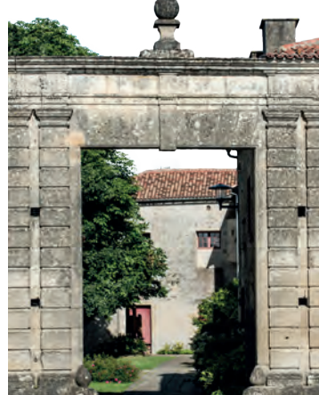
Mairie de Foussais-Payré.

partie des lieux les plus caractéristiques de la ville. Dans d'autres mairies, des expositions seront spécifiquement mises en place pour les Journées du Patrimoine. À Montaigu, pour fêter les 150 ans de la mairie, le public pourra explorer les lieux et découvrir son histoire. À L'Île-d'Olonne, une exposition est également au programme pour découvrir l'histoire et les services de la mairie.