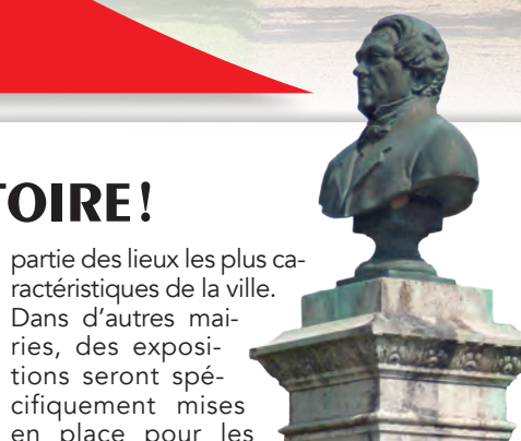
Pierre-Hyacinthe Dumaine a légué sa maison et son jardin à la ville de Luçon.

Renseignements : http://musee-clemenceau-delattre.fr