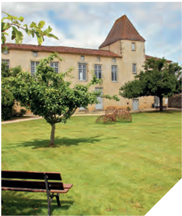
Le manoir des sciences de Réaumur.

Le manoir des sciences de Réaumur fait tomber ses rideaux pour laisser entrer la lumière naturelle chez l'un des témoins des siècles des Lumières ! Les travaux vont s'étaler jusqu'en 2018. Ils concernent le manoir, sa muséographie et les extérieurs. Cet été, les visiteurs ont déjà pu apprécier