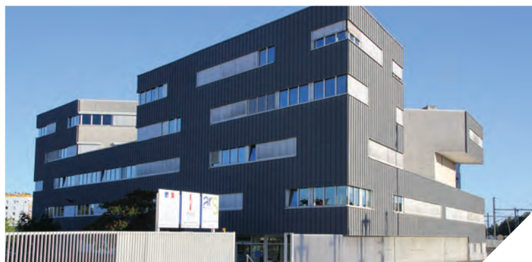
La Maison Départementale des Personnes Handicapées se situe au 185 boulevard du Maréchal Leclerc à La Roche-sur-Yon.

La Maison Départementale des Personnes Handicapées (MDPH) fête cette année ses dix ans d'existence. Lieu unique d'accueil, d'information, d'accompagnement et de conseil pour les personnes handicapées et leur famille, la MDPH organise une grande journée autour de l'autisme le 30 sep-