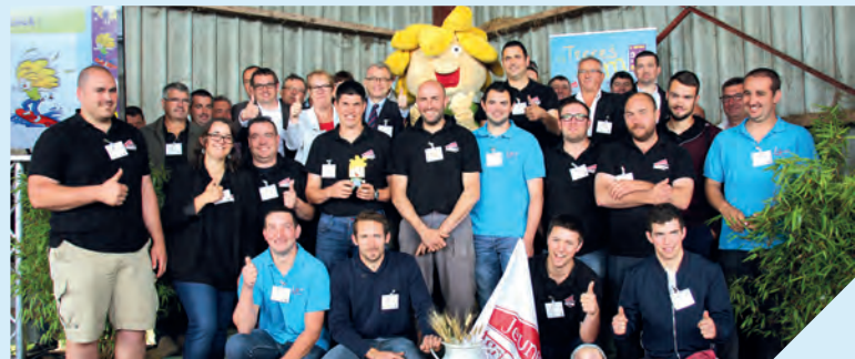
Les organisateurs des « Terres de Jim » avec les partenaires et les élus.