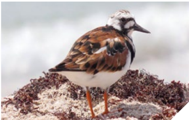
La chasse maritime demande une connaissance pointue des différentes espèces d'oiseaux.