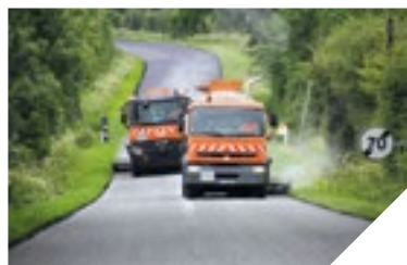
Pose d'un enduit superficiel sur la D754.

400 agents du Département travaillent quotidiennement à l'entretien des routes départementales. Plus de dix millions d'euros sont investis, chaque année, par le Conseil départemental, pour maintenir en état les 4600 km de routes. Reportage.