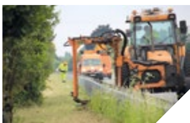
Entretien des dépendances vertes.