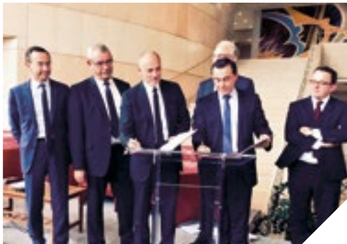
Signature le lundi 4 juillet 2016, à l'Hôtel du Département, du marché avec Orange.