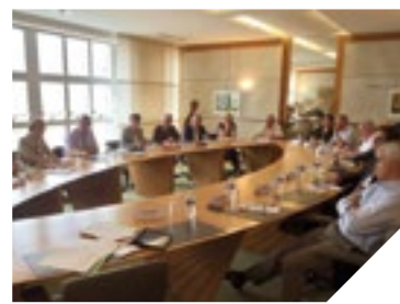
Première séance pour la Conférence Départementale des Exécutifs.

Deux à trois fois par an, cette Conférence se réunira afin de débattre sur les grands enjeux qui seront ceux de la Vendée de demain. Elle rassemble une vingtaine d'élus, représentatifs des différentes collectivités et de la diversité des territoires de notre département. Pour cette première rencontre,