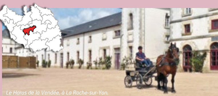
Le Haras de la Vendée, à La Roche-sur-Yon.

Découvrez le canton de La Roche-sur-Yon Sud à travers quelques-unes des actions du Département.