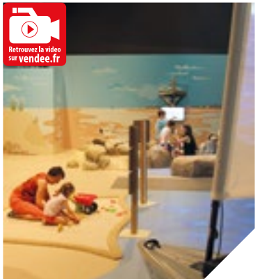
Pour ses 10 ans, l'Historial vous offre un nouveau musée des enfants.

L'Historial de la Vendée a ouvert ses portes le 25 juin 2006. 635 000 visiteurs ont découvert ce Musée de France qui raconte l'Histoire de la Vendée. « Cet écrin qu'est l'Historial est avant tout l'espace de la famille, car il permet la transmission d'un patrimoine culturel qui fait l'iden-