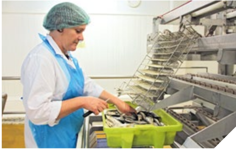
Pour conserver toutes leurs saveurs, les sardines doivent être manipulées avec la plus grande précision. Un savoir-faire de haut niveau précieusement entretenu par Gendreau.

À Saint-Gilles-Croix-de-Vie, tous les matins, pendant la saison de la pêche, les marins pêcheurs livrent leurs cargaisons de sardines. Aussitôt, 70 % de la pêche arrive à l'usine Gendreau qui, après un travail minutieux, met tous ces poissons en boîtes. Pour le plus grand plaisir des fins gourmets.