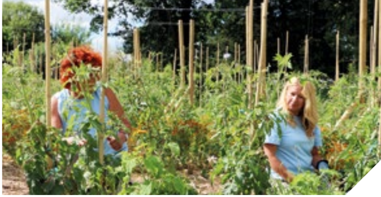
Une dizaine de personnes travaillent au Potager Extraordinaire dans le cadre d'un chantier d'insertion.

À La Mothe-Achard, une dizaine de personnes travaillent au Potager Extraordinaire pour reprendre le chemin de l'emploi. Par le travail de la terre ou l'accueil des visiteurs, ces personnes acquièrent des compétences et retrouvent une dynamique professionnelle. Elles participent à faire de ce lieu, un site touristique étonnant et captivant.