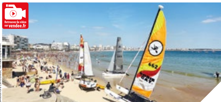
Une qualité d'eau excellente sur la grande plage des Sables d'Olonne comme sur 96 % des plages vendéennes.

En Vendée, la qualité des eaux de baignade est analysée, chaque semaine, par le laboratoire départemental de l'environnement et de l'alimentation. « L'été, douze préleveurs sillonnent la Vendée pour contrôler les eaux de baignade de 76 plages, 14 plans d'eau douce, et 800 piscines de camping, explique Philippe Nicollet, le directeur du laboratoire. Les piscines sont analysées à l'ouverture de la