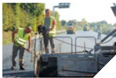
Pose d'un enrobé par une entreprise privée.

L'entretien des routes s'effectue sous deux régimes différents : l'entretien « courant », effectué par les agents du Département, et le « gros entretien » réalisé pour partie par le parc routier départemental (enduits superficiels) et surtout par des entreprises. Ce « gros entretien » correspond notamment au renouvellement des enrobés. Fin juin, 4 km d'enrobé sur la 2x2 voies à hauteur de Bellevigny ont par exemple été