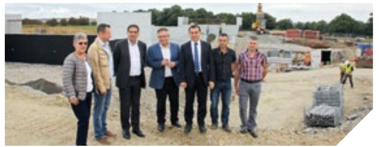
L'échangeur de « La Guédonnière » ouvre le chantier de la mise en 2x2 voies entre La Vie et Aizenay. Visite de chantier le 11 juillet avec les élus.

Les travaux de la 2x2 voies entre Aizenay et Challans avancent. La section Saint-Christophe-du-Ligneron/Challans sera mise en circulation dès la fin de cette année. Les travaux entre La Vie et Aizenay ont commencé par la construction de l'échangeur de « La Guédonnière ». Cet échangeur est très attendu à Aizenay, notamment par la Cavac. L'unité céréalière de la Cavac prévoit en effet de multiplier par cinq sa ca-