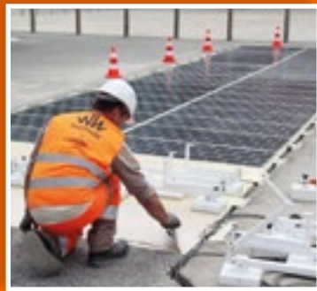
Les capteurs solaires sont collés sur le revêtement existant des routes.