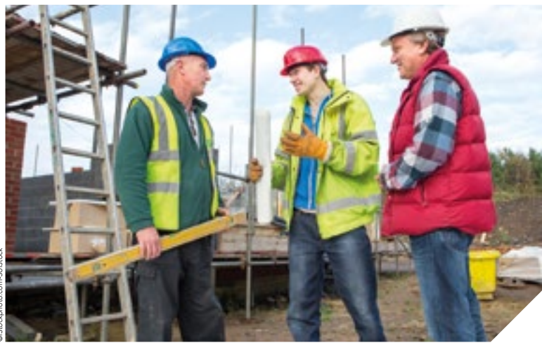
La clause Molière oblige le titulaire du marché public à employer des personnes maîtrisant la langue française.

Fin juin, le Conseil départemental de la Vendée a voté une résolution sur la clause Molière. Une clause intégrée dans le cahier des charges des marchés publics. Elle permet d'exiger l'usage du français sur les chantiers dont la collectivité est maître d'œuvre. Explications.