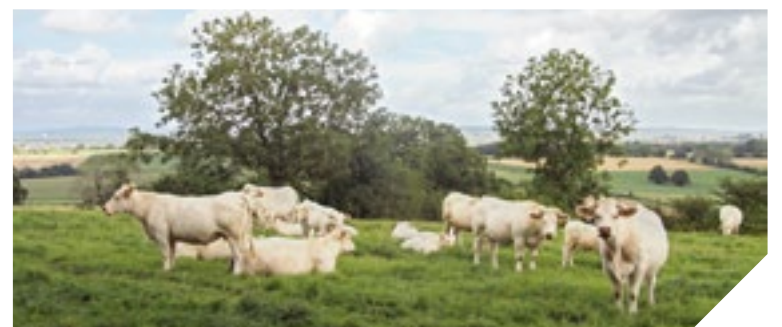
Le Département se mobilise pour soutenir l'élevage, une filière clé pour la Vendée.

partement a décidé d'abonder les fonds d'allègement des charges en faveur des éleveurs adoptés par l'État dans son plan de soutien à l'élevage français. Ce fonds permet notamment d'accompagner la restructuration des dettes bancaires à moyen et long terme des éleveurs qui connaissent des difficultés temporaires de financement. Environ 250 éleveurs pourraient bénéficier de cette aide exceptionnelle du Département.