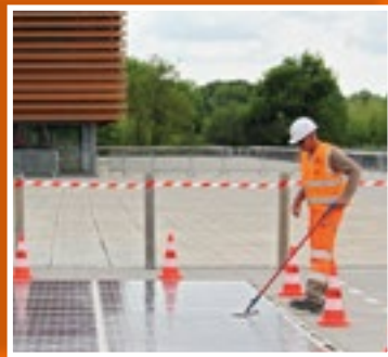
Un vernis appliqué sur les plaques permet de les sécuriser.