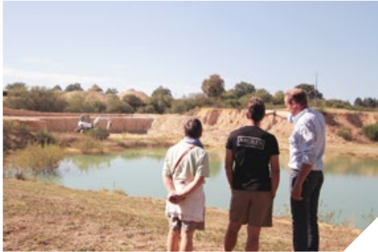
À Chaillé-sous-les-Ormeaux, l'entreprise est située près de carrières d'argile.