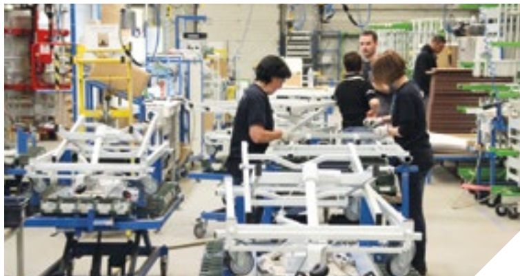
Le confort des patients autant recherché que celui des soignants et installateurs.

Au cœur de la Vendée, à Saint-Paul-Mont-Penit, des milliers de lits médicalisés (25 000) sont expédiés chaque année à travers toute la France et au-delà.