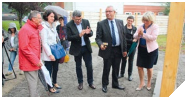
De nombreux élus sont venus poser symboliquement la première cheville du nouveau bâtiment du groupe d'accueil mixte du foyer de l'enfance Gilbert de Guerry à La Roche-sur-Yon.

« Aujourd'hui, 1429 jeunes sont pris en charge par le Département. Leur nombre est en nette augmen-