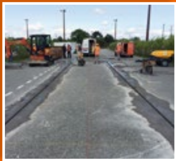
La zone où seront installés les capteurs solaires est délimitée.