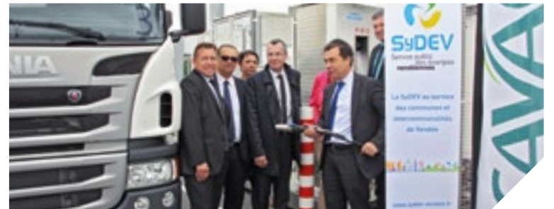
Les élus découvrent la borne Bio-GNV, installée à La Roche-sur-Yon.

Tout au long du mois de juin, le SyDEV, en partenariat avec l'AFG Ouest (GRDF et GRTGaz), expérimentent avec le Conseil départemental et La Roche-sur-Yon Agglomération, une station au gaz naturel. Installée à La Roche-sur-Yon, elle sera utilisée par trois véhicules: deux poids lourds (l'un des Transports Percheau et l'autre de la CAVAC) et un bus de La Roche-sur-Yon Agglomération.