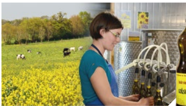
Le Gaec Ursule produit 15 000 litres d'huile de colza et de tournesol par an.

Référence en France en matière d'agro-écologie, le Gaec Ursule, à Chantonay, produit lait, volailles, céréales et bois (pour la filière bois-énergie). Les quatre associés du Gaec se sont également lancés dans la production d'huile bio de colza et de tournesol. Une huile aux