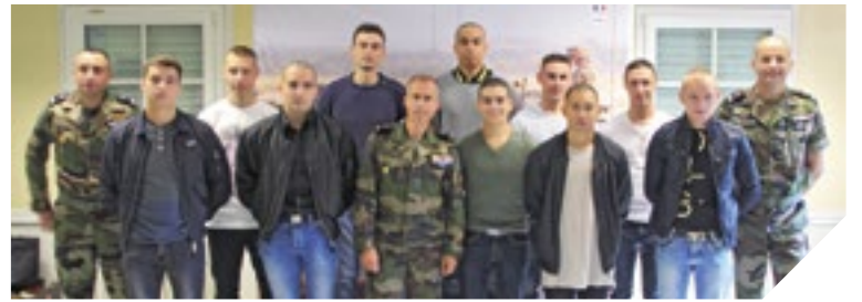
En juin, 21 jeunes vendéens se sont engagés dans l'Armée de Terre.