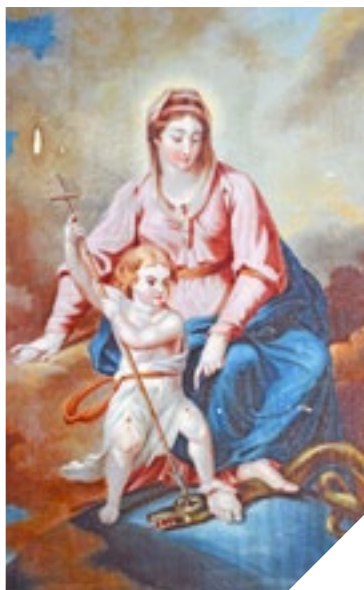
Tableau de la Vierge terrassant l'hérésie en cours de restauration.

Le tableau date du début du XVIII e siècle. La toile, large de 118 cm et haute de 177,5 cm, est restée dans son cadre d'origine avec ses coquilles, acanthes dans les angles et angelot au centre de la traverse supérieure. Le sujet est rare. Assise sur les nuées, la Vierge écrase sous ses pieds le serpent de l'hérésie qui rampe sur le Globe. L'Enfant, armé d'une croix terminée par un fer de lance lui transperce la tête. Marie est ici représentée comme la nouvelle