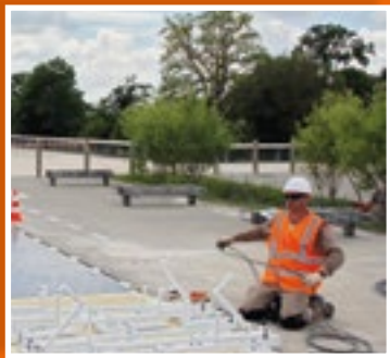
Les câbles transmettent l'électricité produite à la station de recharge.