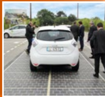
Ces dalles supportent la circulation des véhicules en toute sécurité.

LA ROUTE EN CHIFFRES: 50 m 2 42 DALLES 6 300 kWh/AN 90 % DU TEMPS LA ROUTE NE SUPPORTE PAS DE TRAFIC 2 ANS D'EXPÉRIMENTATION