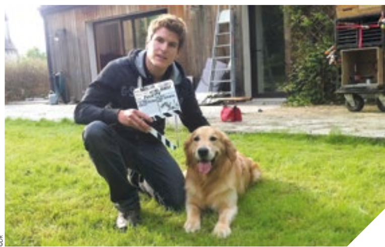
Le dresseur doit connaître tous les comportements de son chien dans toutes les situations.