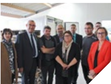
Les élus entourent le 100 e adhérent.

des yaourts, du fromage blanc au restaurant scolaire d'Aizenay et au restaurant administratif de La Roche-sur-Yon.