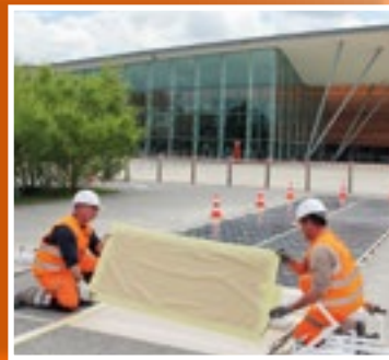
Les dalles photovoltaïques sont très fines et très résistantes et à haute adhérence.