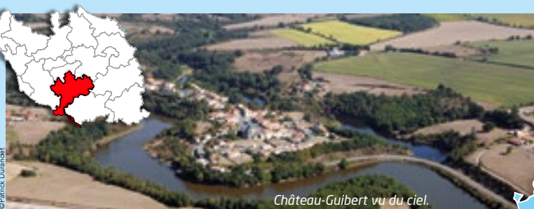
Château-Guibert vu du ciel.