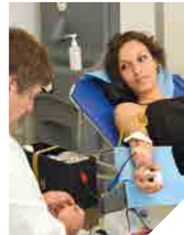
Donner son sang. Un geste essentiel.