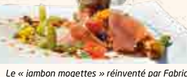
Le « jambon mogettes » réinventé par Fabrice Riefolo.

fou, les escargots, la trouspinette, le foie gras, le canard, la brioche, les produits de la mer... Il y a aujourd'hui un vrai engouement des consommateurs pour les produits locaux. Beaucoup découvrent ici les vins des Fiefs vendéens et profitent de leurs vacances pour aller à la rencontre des viticulteurs ».