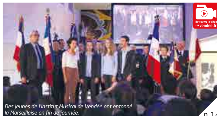
Des jeunes de l'Institut Musical de Vendée ont entonné la Marseillaise en fin de journée.