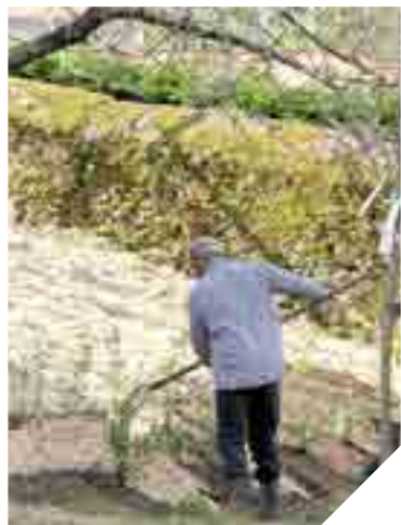
Le jardin médiéval de Belleroche à Rocheservière.

Le Département, en partenariat avec l'association Le Patrimoine Cervierois, restaure 1500 m 2 du