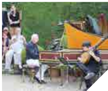
Rendez-vous en août pour la 5 e édition des Rencontres musicales de Vendée.

Le Festival « Dans les jardins de William Christie » s'apprête à enchanter les amoureux du jardin et de la musique baroque du 20 au 27 août prochain. À Thiré, tous les après-midi (sauf le 23/08), les jardins s'ouvriront pour les Promenades musicales mais aussi pour des ateliers famille musicaux et des visites des jardins. Les concerts sur le miroir d'eau sont prévus les 20 et 21 août (Le Jardin des Songes, une soirée avec le chœur des Arts Florissants) et les 26 et 27 août (Monsieur de Pourceaugnac, de Molière et Lully). Des concerts aux chandelles se dérouleront dans l'église de Thiré les 21, 22, 24, 25 et 26 août. Enfin, des Méditations à l'aube de la nuit, dédiées à la musique sacrée, sont