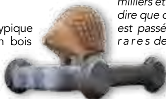
Créateur de jouets historiques

L'atelier est atypique et le cheval en bois côtoie le jeu de l'oie ou le camion des années cin-