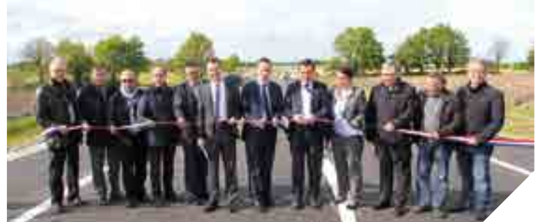
Les élus ont inauguré les 2,3 km de contournement Ouest de La Gaubretière fin avril.

Fin avril, le contournement Ouest de La Gaubretière a été ouvert à la circulation. Cette section de 2,3 kilomètres est entièrement financée par le Conseil départemental. Elle fait suite à une première partie mise en service début 2015.