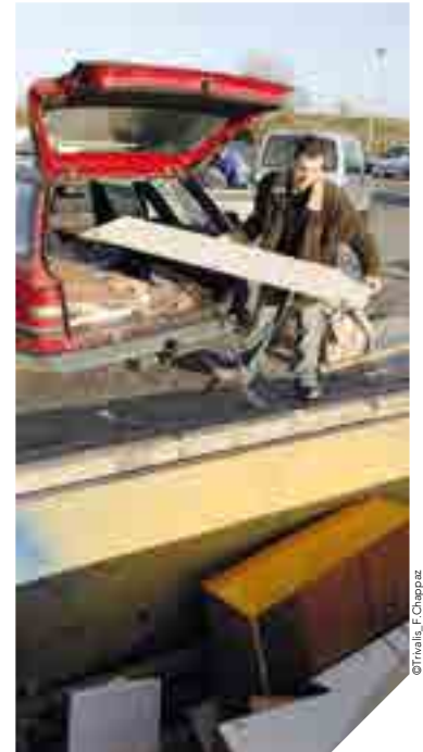
La filière de recyclage du mobilier dans les déchetteries est l'une des plus récentes.

En 2015, 457 000 tonnes de déchets ménagers et assimilés ont été collectées en Vendée. « Les Vendéens sont très sensibles au tri » constate Hervé Robineau, président de Trivalis. Nous sommes en effet de plus en plus nombreux à trier nos déchets à la maison. Le tri gagne également du terrain en déchetterie. Avec les filières du mobilier et celle des plaques de plâtre, les 70 déchetteries du département comptent aujourd'hui 12 filières de recyclage. Cet effort commun sur le tri permet à la Vendée d'afficher un taux de valorisation de ses déchets de 70 %, un taux très supérieur à l'objectif national fixé à 55 % d'ici 2020.