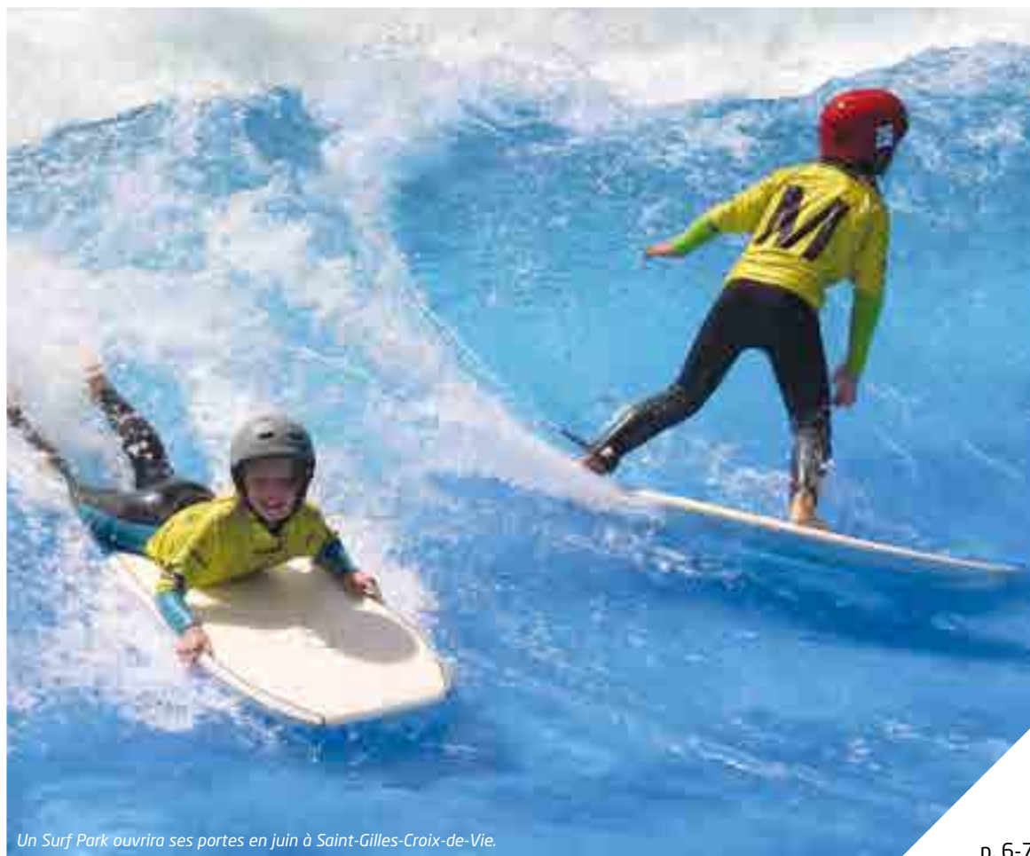
Un Surf Park ouvrira ses portes en juin à Saint-Gilles-Croix-de-Vie.