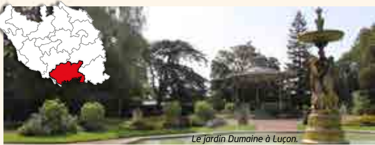
Le jardin Dumaine à Luçon.

Découvrez le canton de Luçon à travers quelques-unes des actions du Département.