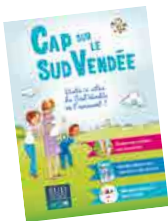
La BD suggère aussi six balades pour découvrir le Sud Vendée.

Renseignements : www.sudvendeeetourisme.com