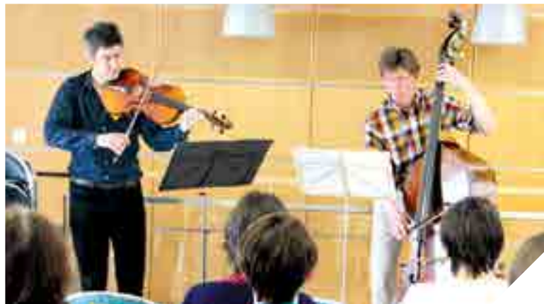
Dans le hall d'entrée du pôle Mère-Enfant du CHD de La Roche-sur-Yon, les airs de Vivaldi, Beethoven et Gounod ont enchanté malades, personnels soignants et visiteurs.

Mozart, Vivaldi, Rameau, Gounod... Quoi de mieux que d'écouter des œuvres de grands compositeurs pour se détendre. Une véritable thérapie de l'apaisement par la musique se développe aujourd'hui. Persuadés des effets