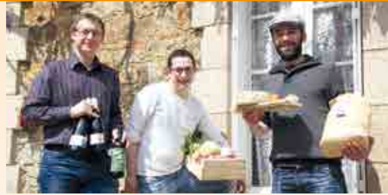
L'équipe des « trois piliers » au Boupère mise sur les produits du terroir pour séduire la clientèle.

Dans le Sud Vendée, à Velluire, « L'Auberge de la Rivière » mise aussi sur les produits du terroir vendéen. « Je