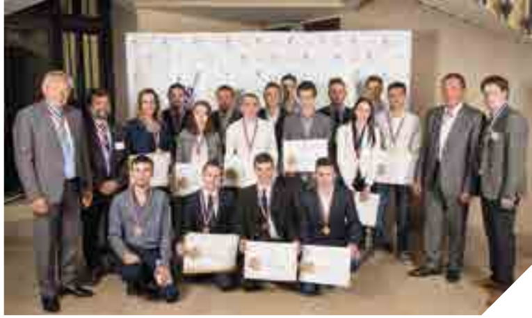
De nombreux Vendéens ont reçu à la fin du mois d'avril leur médaille d'or du concours national de Meilleur Apprenti de France. Une reconnaissance pour la qualité de leur savoir-faire.