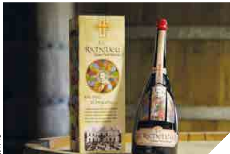
L'abus d'alcool est dangereux pour la santé, consommez avec modération.