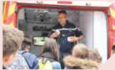
Initiation aux gestes qui sauvent.

Les institutions de la République nous protègent. Elles œuvrent au quotidien pour la sécurité des citoyens. Au cours du Parcours, les jeunes ont pu incarner le rôle des forces de l'ordre, une manière de mieux comprendre les valeurs de protection et de cohésion des gendarmes. Un autre groupe a rencontré les forces armées. Les collégiens ont enfilé le gilet par balles, le casque et le sac à dos. « Les jeunes ont posé beaucoup de questions,