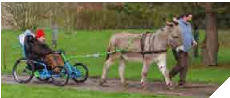
Cariâne-évasion investit cette année l'île de Noirmoutier.

SOLIDARITÉ / ATELIERS « REDYNAMISATION »