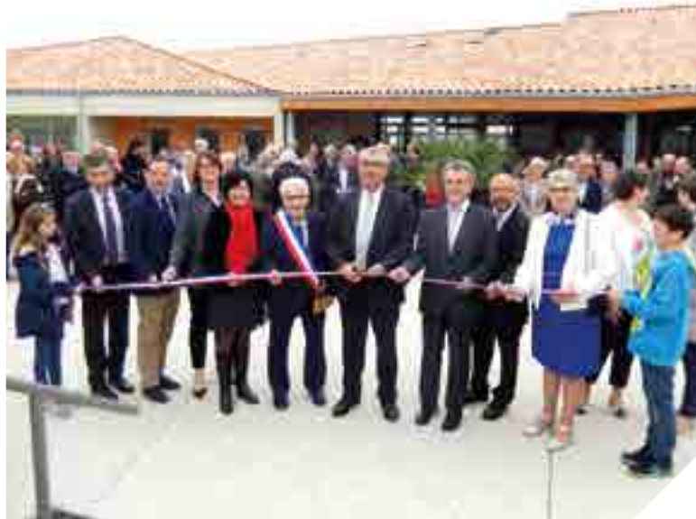
Fin mai, les élus ont inauguré la maison de vie « Le coteau du Lay », à Réaumur.

L'avantage de ces unités non médicalisées réside aussi dans