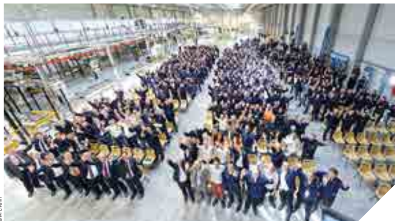
Signature du pacte « Skipper 360° », le 22 avril au sein du bâtiment où est installée la nouvelle machine de l'entreprise Michelin à La Roche-sur-Yon.

« Il y a l'usine d'hier, celle qui a permis aux plus anciens de construire leurs vies en Vendée. Il