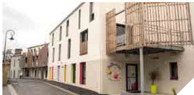
Entièrement réaménagé, l'îlot Saint-Maurice comprend des logements et des services de proximité (maison pluridisciplinaire de santé et microcrèches).

À travers le Contrat Communal d'Urbanisme (CCU) signé entre Moutiers-les-Mauxfaits et le Conseil départemental, l'îlot Saint-Maurice, situé au cœur du bourg connaît une seconde jeunesse.