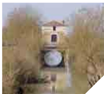
L'octroi d'Angles et le canal des Bourrasses.