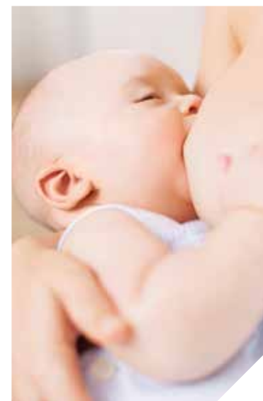
Les participants aux rencontres sur l'allaitement maternel seront informés et guidés par divers professionnels.

Les professionnels de la PMI (Protection Maternelle et Infantile) en lien avec les Centres Hospitaliers, la clinique Saint Charles et des sages femmes libérales animent les rencontres: elles sont l'occasion de répondre aux questions: Aurai-je assez de lait? Peut-on allaiter un bébé prématuré, des