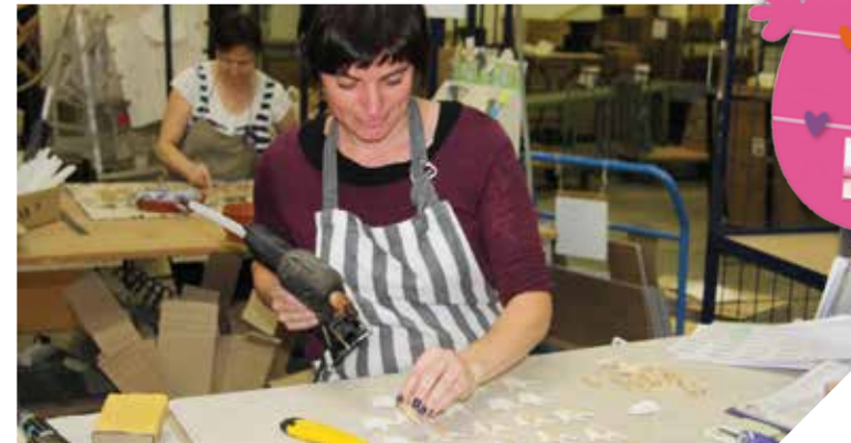
Chaque objet est fait main sur des matières naturelles au sein de l'atelier de La Verrie.

Lorsque la société, implantée à Cholet jusqu'en 2013, cherchait un nouveau local, la Vendée lui a ouvert ses portes: « C'est le seul dé-