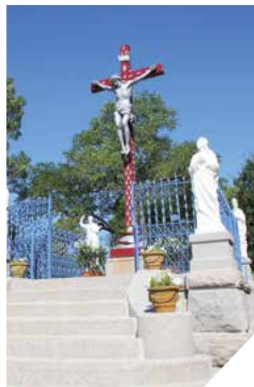
Le calvaire situé route des Sables, à Grosbreuil, a retrouvé ses couleurs d'origine.