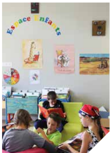
La médiathèque de l'île d'Yeu, une invitation supplémentaire à l'évasion littéraire.

Ouverte depuis le mois de janvier, la médiathèque muni-