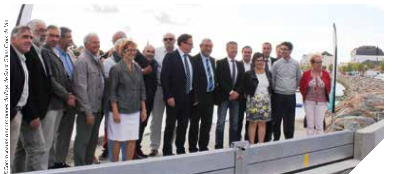
Les élus de la Communauté de communes, de la commune et du Département sur le quai Gorin pour la réception des travaux.

en place. Les études avaient en effet démontré que ces quais pouvaient être sensibles à des submersions marines lors d'événements exceptionnels. La hauteur retenue a été la cote de référence Xynthia avec 20 centimètres de hauteur supplémentaires.