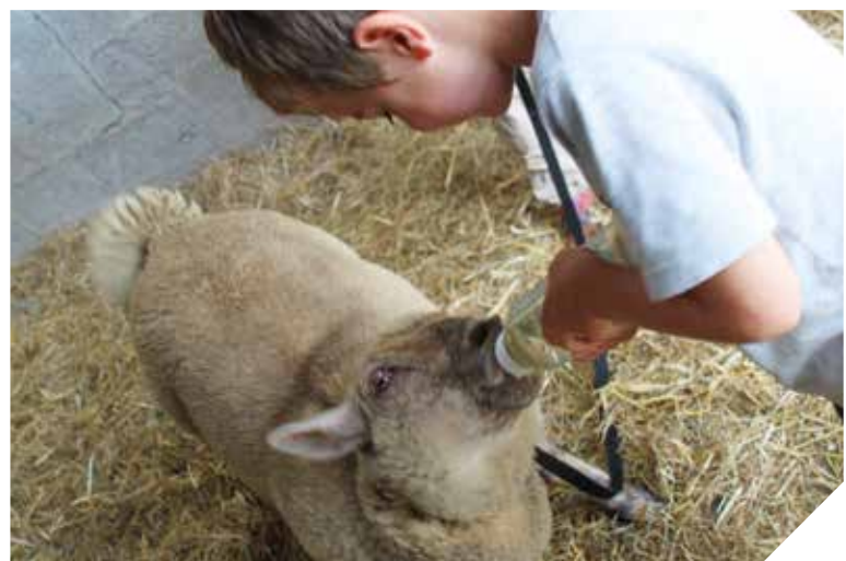
Dans les ateliers d'Anim'Envie, l'animal est médiateur et fait le lien entre l'intervenant et l'enfant.

PERSONNES ÂGÉES / RENCONTRES RACINES LE 23 OCTOBRE PROCHAIN