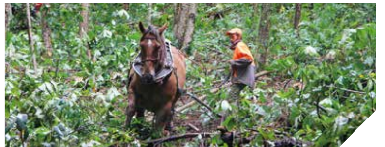
Le débardage à cheval a été réalisé grâce aux chevaux de trait bretons de l'entreprise Longs Crins basée à Saint-Florent-des-Bois. Des bûcherons étaient missionnés par l'ONF.

Le parc de la Boulogne jouxte l'Historial de la Vendée aux Lucs-sur-Boulogne. Le Département de la Vendée y a réalisé dernièrement un chantier de débardage à cheval sur le coteau des châtaigniers. Une première tranche de travaux avait été réalisée en 2013. L'objectif était d'abattre des châtaigniers déperissants, sur une zone d'un hectare. L'utilisation des chevaux de trait bretons permet ce