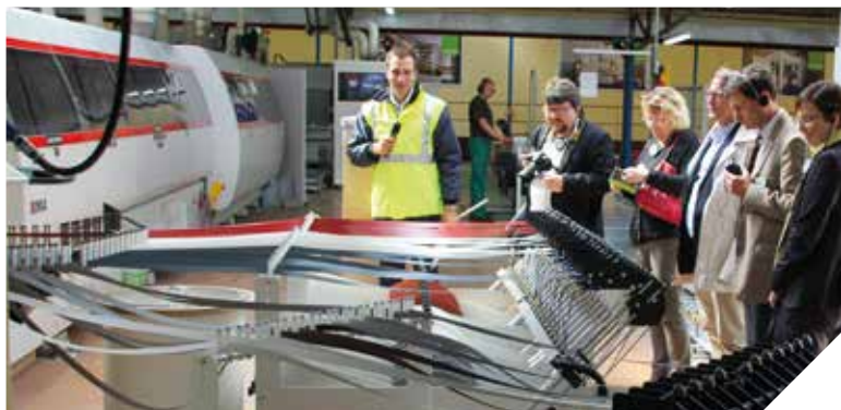
Longue de 70 mètres la nouvelle ligne de production permet de fabriquer 4500 pièces par jour.

Et les résultats sont probants, alors que sur les anciennes machines, il fallait compter plusieurs heures