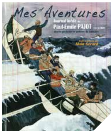
Le grand livre du marin-pêcheur et peintre.

AGRICULTURE / EARL FAIVRE À CHAILLÉ-LES-MARAIS