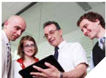
Le numérique, priorité pour les entreprises.

FORMATION / MAISON FAMILIALE DE SAINT-GILLES