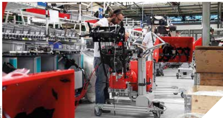
Le groupe Pubert est le seul producteur européen de fraise à neige.