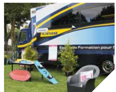
Le camion était à la Foire des Minées 2015.

Renseignements : 02 51 55 52 12 www.cfa-mfr-stgillescroixdevie.fr