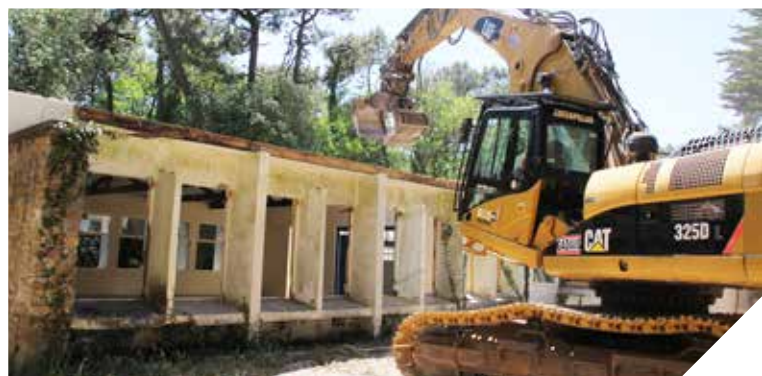
Début juin, une ancienne colonie de vacances a été détruite au cœur de la forêt de Jard-sur-Mer.

Le site naturel du Veillon et du Payré est l'un des plus beaux de Vendée. Le Département, propriétaire du bois des Bourries, à Talmont-St-Hilaire, et du bois des Sables de la Grange, à Jard-sur-Mer, veille scrupuleusement à la santé de ces espaces naturels sensibles. En juin, dans le bois des Sables de la Grange, le Conseil départemental a décidé la déconstruction d'anciennes colonies de vacances en état d'abandon. L'occasion de