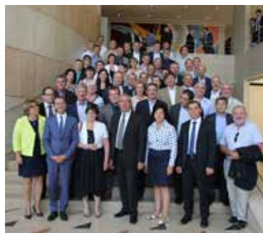
La session exceptionnelle du Conseil départemental s'est tenue le 10 juillet dernier. L'occasion pour les élus de demander à l'État de dévoiler ses solutions alternatives à l'A 831.