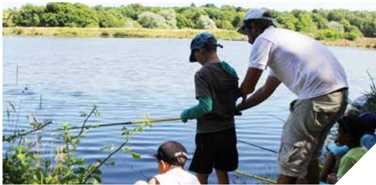
Un Label pêche pour valoriser la richesse halieutique de la Vendée.