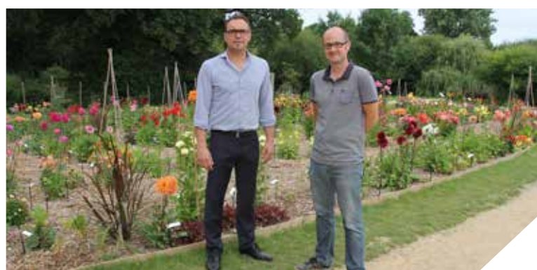
L'entreprise Trait d'Union donne une nouvelle dynamique au potager extraordinaire.

EFS / DONNER SON SANG PENDANT LES VACANCES