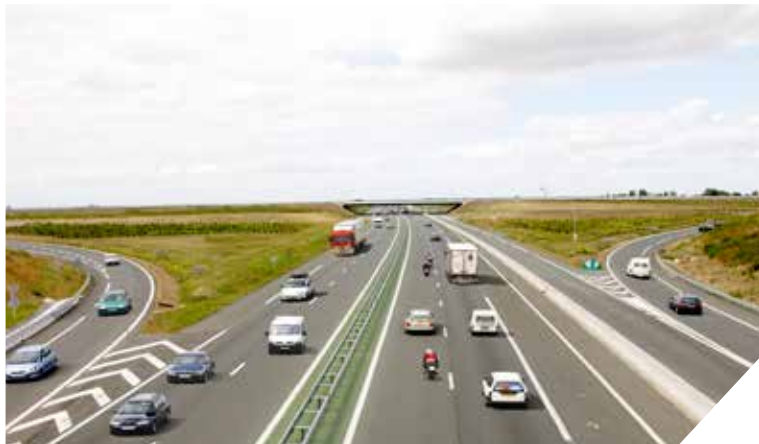
Facteur de sécurité et de développement économique, l'A 831 est attendue depuis des années dans tout le Sud Vendée.