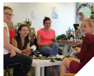
Apprentis fleuristes des MFR, elles ont participé à la réalisation d'un bouquet connecté.