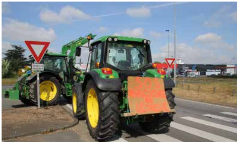
Le 22 juillet, les agriculteurs ont procédé à des opérations escargots et des barrages filtrants dans les différentes villes de Vendée. Objectif : montrer l'urgence à agir pour sauver l'élevage.

Le 22 juillet, les Jeunes Agriculteurs de Vendée et la FDSEA ont mené une grande journée d'action en Vendée avec pour mot d'ordre : « ayez le courage de sauver l'élevage ». Pour renouer avec une vision dynamique et conquérante de l'agriculture, les professionnels vendéens souhaitent avant tout une action sur les prix et une valorisation de la production française.