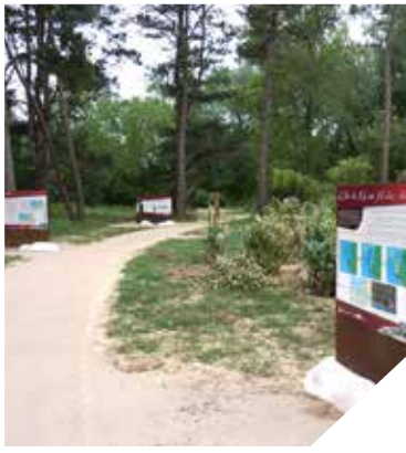
Grâce à ce nouveau sentier d'interprétation, le visiteur peut découvrir l'ancien champ de bataille des Mathes.

En juin 1815, royalistes et bonapartistes se sont également affrontés sur ce site lors du combat des Mathes. Louis de La Rochejaquelein a trouvé la mort lors de ce combat. Aujourd'hui, plusieurs panneaux permettent aux visiteurs de découvrir ces différents épisodes. Le projet a notamment été réalisé avec le