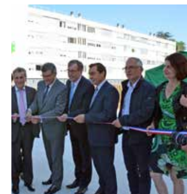
Les élus de la Ville et du Département ont inauguré les travaux de résidentialisation et le boulevard Jean Yole.

Jean Yole a été requalifié avec pour objectif de favoriser les circulations douces.