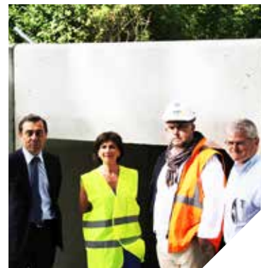
Les élus du canton d'Aizenay devant le futur pont de La Bisière à Beaufou.

À Talmont-St-Hilaire, un nouveau giratoire a été construit à l'intersection de la RD 949 et de la rue du Porteau, deux axes très fréquentés. Ce giratoire de La Malbrande était très attendu pour fluidifier la circulation sur cette route empruntée chaque jour par de nombreux Talmondais et touristes.