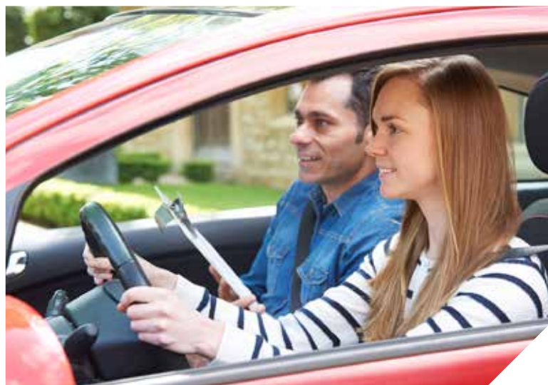
Grâce au permis de conduire, l'insertion professionnelle des jeunes est facilitée.

En juin, 30 jeunes Vendéens ont reçu leurs diplômes de permis de conduire à l'Hôtel du Département. L'aide au