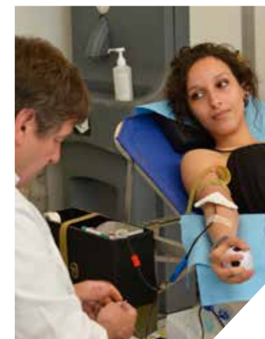
L'an passé, grâce à la mobilisation des donneurs de sang bénévoles, la Vendée a pallié le manque en période estivale.

L'EFS (site des Oudairies à La Roche sur Yon) accueille les donneurs tout l'été. L'agenda des collectes mobiles organisées en Vendée est en ligne sur: www.vendee.fr