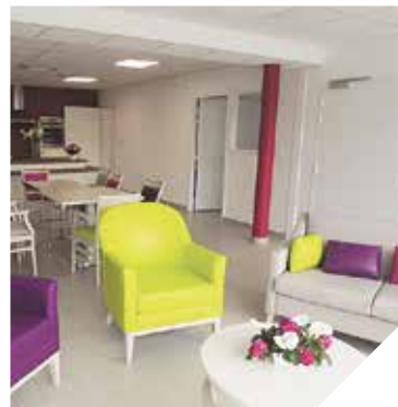
Avec ces différents espaces, le nouvel accueil de jour propose de multiples activités.

La résidence Charles Marguerite, à Aizenay, propose depuis maintenant quelques semaines une vraie solution de répit pour les aidants familiaux. L'établissement, qui comprend déjà une centaine de places d'hébergements perma-