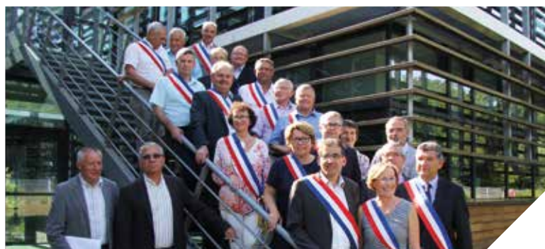
Les maires et présidents de communautés de communes ont voté une motion de protestation lors de leur conseil d'administration du 25 juin dernier.

Les élus prévoient aussi une forte mobilisation lors du prochain Congrès des Maires et Présidents de France, en novembre.