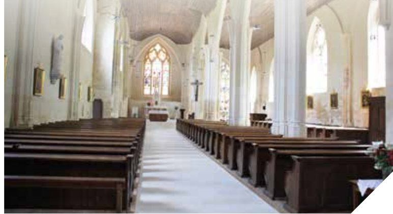
Les stigmates de l'histoire se lisent dans les pierres, voûtes détruites, piliers interrompus...