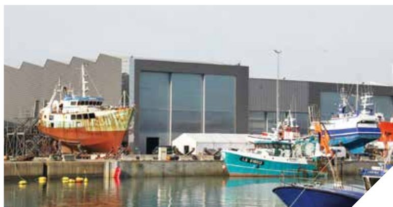
Basés aux Sables-d'Olonne, les chantiers Ocea disposent aussi d'une unité à Fontenay-le-Comte.

Si Ocea, entreprise sablaise spécialiste de la construction navale aluminium, connaît une importante activité à l'export, c'est pour un projet vendéen que le chantier va prochainement travailler. Le Maxiplot, navire dédié à la nouvelle entreprise A2TMI (Atlantique Travaux Transports Maritimes Islais), réalisera une navette entre l'île d'Yeu et Les Sables-d'Olonne pour le transport du poisson. Un projet qui pourrait bénéficier à l'économie locale. Explications.