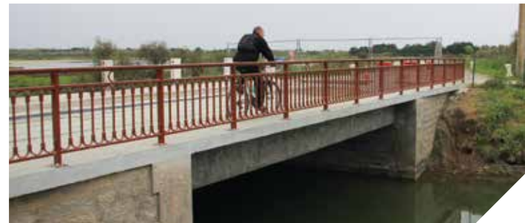
Les ponts de L'île d'Olonne et Saint-Hilaire-de-Voust font partie du patrimoine des communes.

pont de L'île d'Olonne jouit de nouveaux garde-corps. Plus fins et plus aérés, ils permettent aux Vendéens et aux touristes de profiter d'une vue encore plus dégagée sur les marais environnants. Le pont Bert, qui surplombe la rivière Vendée, a été réaménagé afin d'accueillir notamment des trottoirs des deux côtés du pont. Ces derniers favoriseront le passage des piétons et des cyclistes.