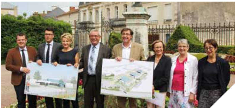
Les élus ont présenté le projet de nouveau foyer d'accueil médicalisé à Luçon.