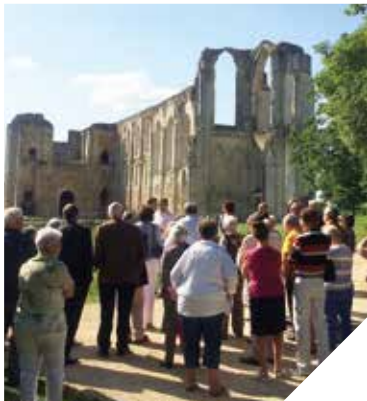
Maillezais reconnue dépendance de Cluny.