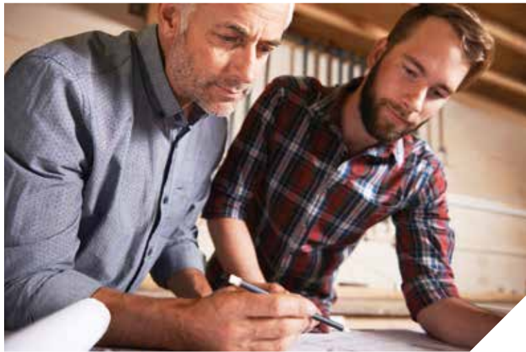
La Vendée compte un grand nombre d'entreprises familiales. Pour aider les futurs repreneurs, la chaire « Entrepreneurial familial et société » propose une formation continue.

De nombreuses rencontres ont eu lieu avec des successeurs d'entreprises familiales pour mieux cerner leurs difficultés. L'allongement de la durée de vie (qui prolonge l'implication du dirigeant), l'aspiration des femmes à plus de responsabilités (qui renforce la compétition entre frères et sœurs), l'allongement des études (qui inassure des aspirations différentes) ou l'attention plus importante des jeunes générations à la vie personnelle ont été clairement identifiés comme des freins. Différents profils types de successeur ont également pu être définis : le protecteur, le réformateur, l'opportuniste ou le rebelle. Car pour maximiser les chances d'une transmission intrafamiliale réussie, il est essen-