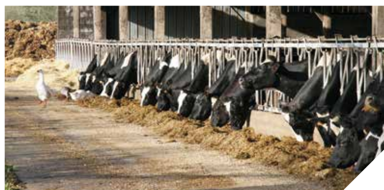
En un an, les éleveurs bovins ont dû supporter une chute de 20 % des prix payés aux producteurs.

Début juin, les éleveurs de porcs et de bovins ont manifesté leur colère. Devant la chute des rémunérations, 1 500 éleveurs bovins se sont notamment mobilisés pour bloquer des abattoirs en Vendée.