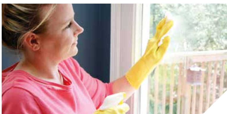
Les clauses sociales débouchent parfois sur des CDI comme l'a fait l'entreprise LMC Services.