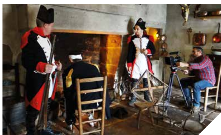
Scène de tournage du docu-drame « C'était une fois dans l'Ouest ».

Renseignements: page facebook: C'était une fois dans l'Ouest