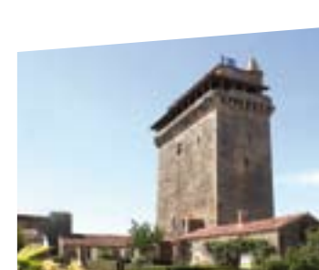
Le donjon de Bazoges-en-Pareds

Exposition sur la famille des propriétaires.