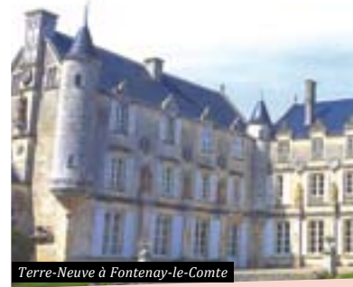
Terre-Neuve à Fontenay-le-Comte

■ Moulin de Rambourg. Début XX e . Dim. 14h à 19h. VG : 16h : visite, à deux voix, pour une découverte originale du site.