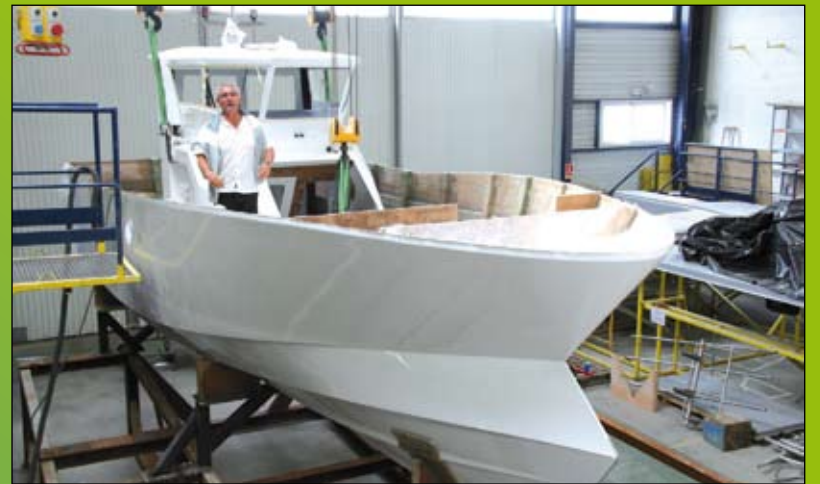
Le Rorcal 90, un bateau de pêche alliant puissance, sécurité et économie d'énergie.

Le site des chantiers Bénéteau professionnel est localisé en Vendée à L'Herbaudière, sur la pointe nord de l'île de Noirmoutier. C'est là que sont construits les bateaux en polyester, en particulier le Rorcal 90, un bateau alliant puissance et économie d'énergie.