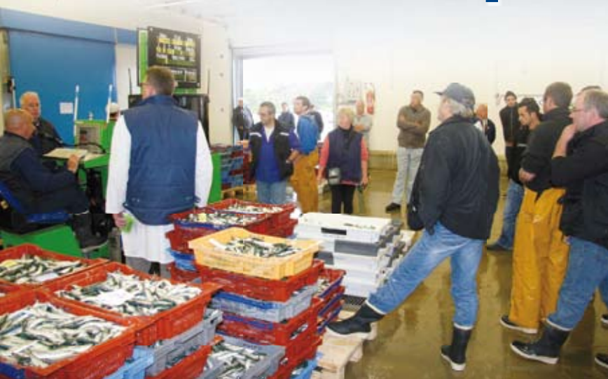
Vendu à la criée aux enchères par les mareyeurs, le poisson est envoyé aux quatre coins de la France et de l'Europe en quelques heures.

Chaque matin, les pêcheurs vendéens débarquent les tonnes de poissons sur les quais des quatre criées du département. Les mareyeurs qui l'achètent aux enchères le revendent aux restaurants, poissonniers, grandes surfaces, entreprises des quatre coins de la France et d'Europe.