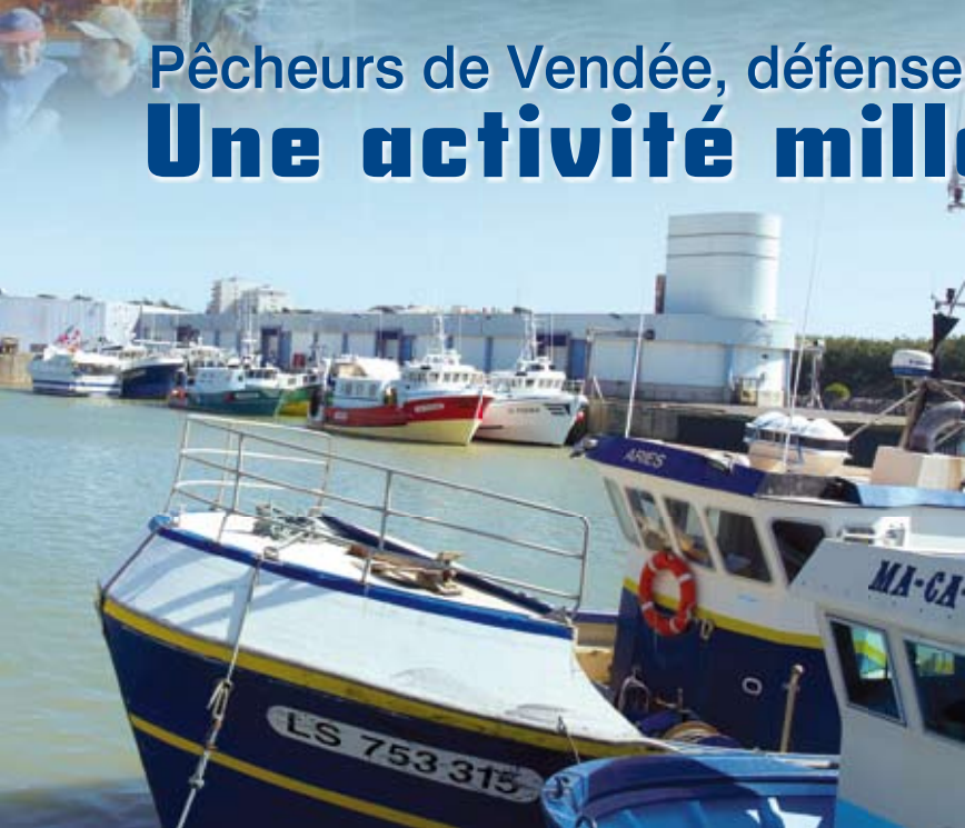
La pêche vendéenne est artisanale. Elle est le fruit d'un savoir-faire qui doit perdurer.