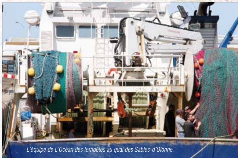
L'équipe de L'Océan des tempêtes au quai des Sables-d'Olonne.

Le rouget pêché en grande quantité dans le Golfe de Gascogne s'est tout de suite vendu à la criée des Sables-d'Olonne. Mais à peine arrivé, toute l'équipe de l'Océan des Tempêtes se prépare au prochain voyage : « Nous pouvons pêcher toute l'année, assure Nicolas Pénisson. Mais l'activité est beaucoup plus intense l'été car nous ne pouvons pêcher que de jour et avec de bonnes conditions météo. Passé 35 nœuds de vent, la manœuvre est plus délicate. »