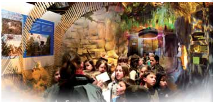
Les cinq milieux du vieux continent vont être restitués dans l'espace d'exposition, comme ici, lors de la précédente édition. Des technologies d'avant-garde comme l'imagerie en trois dimensions vont permettre d'approcher au plus près les modes de vie des oiseaux d'Europe.

Les deux derniers espaces d'exposition des plus de 1 000 mètres carrés ouverts aux visiteurs leur permettront de prendre connaissance des œuvres projetées lors du festival et d'approfondir leurs connaissances. Des vidéos et une médiathèque originale présenteront en effet, d'une part, les réalisateurs et, d'autre part, les bandes annonces des films en compétition. Des animations destinées aux plus jeunes et aux enfants ont également été prévues.