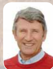
Philippe de Villiers Président du Conseil Général de la Vendée

d'inspiration pour les constructions à venir. La première de ces cités écologiques, le Vendélium, verra le jour aux Herbiers prochainement. Par ailleurs, un projet de grand centre du Marais Poitevin, dédié à la nature, est en cours d'élaboration. Ce sera, à l'instar du festival Vendée Nature, un lieu pour s'instruire et se détendre, en vue de toujours mieux prendre soin de notre terre.