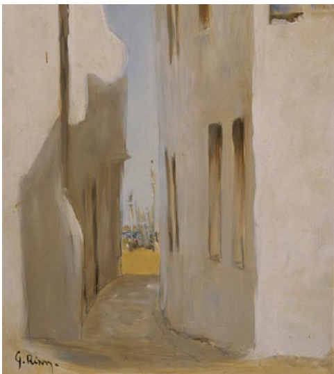
rue de l'île d'Yeu