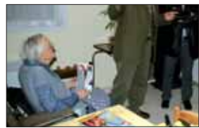
Ces travaux n'auront pas de répercussion sur le prix de journée payé par les résidents.