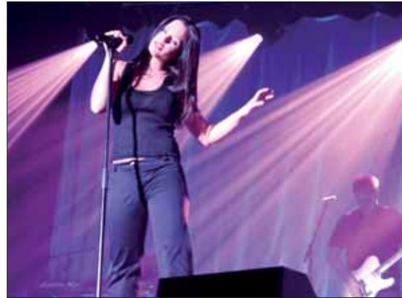
Natasha St Pier : «Avec le public français, il se passe toujours un truc.»

N.S.P. : Je ne sais pas ! J'ai envie de donner plein de réponses différentes à cette question que je me suis posée souvent, bien entendu ! Mais donner une réponse sincère à cette question, c'est difficile. Je serais un peu paniquée j'imagine. Je me dirais « Ah ! au secours ! Je suis loin de mes parents, comment je vais faire ? Je veux voir mon frère ! ». Je voudrais être près de mes proches. Voilà.