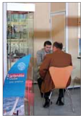
Les métallurgistes vendéens ont bénéficié d'un coup de pub exceptionnel.