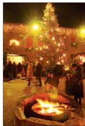
* A l'issue des spectacles, un goûter est servi au public. Pour tous renseignements : 02 51 37 48 48

■ Tarifs : 10€, 7€, gratuit jusqu'à 7 ans.