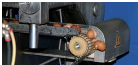
Chaque jour, 2,5 millions d'œufs sont cassés à Chauché.

Mais la société a également à cœur de protéger l'environnement. Alors que ces milliers de litres d'ovoproduits serviront à la fabrication de tonnes de brioches, biscuits, pâtes et autres produits alimentaires, les coquilles récupérées sont en effet distribuées aux agriculteurs des environs qui s'en servent pour augmenter la teneur en calcaire de leur sol. Enfin, l'eau est réutilisée pour l'irrigation des champs de maïs.