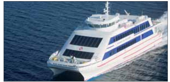
D'une capacité d'accueil de 435 places, LE CHATELET effectue la traversée en seulement 30 minutes.

Le Chatelet. Au sud-ouest de l'île d'Yeu, sur un promontoire rocheux qui plonge dans la mer, une croix en mémoire des marins morts en mer est érigée dans un bateau de pierre. C'est de là que vient le nom du deuxième Navire à Grande Vitesse (NGV) qui a accosté à l'île d'Yeu le 13 novembre dernier et effectuera son premier trajet commercial le 7 décembre, juste après sa bénédiction. LE CHATELET est en fait le «Sister Ship» du PONT D'YEU, c'est-à-dire qu'il a les mêmes caractéristiques : 435 places, la possibilité de transporter les bagages, les cycles et les voitures (service exclusivement réservé aux îlais), 30 noeuds de vitesse soit une traversée en une demi heure. «L'INSULA OYA II ayant été transformé cette année en caboteur