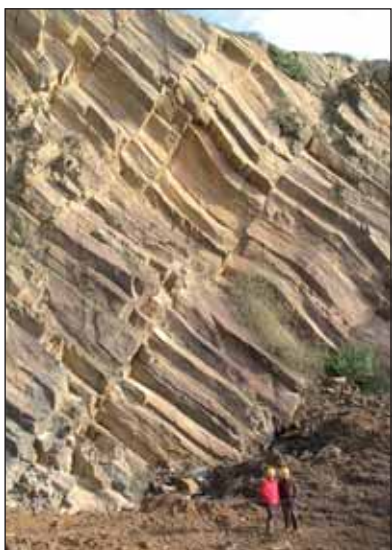
Les orgues de Vairé : impressionnant.

■ Les fiches pour la valorisation du patrimoine géologique vendéen sont disponibles sur le site internet du Conseil Général : www.vendee.fr