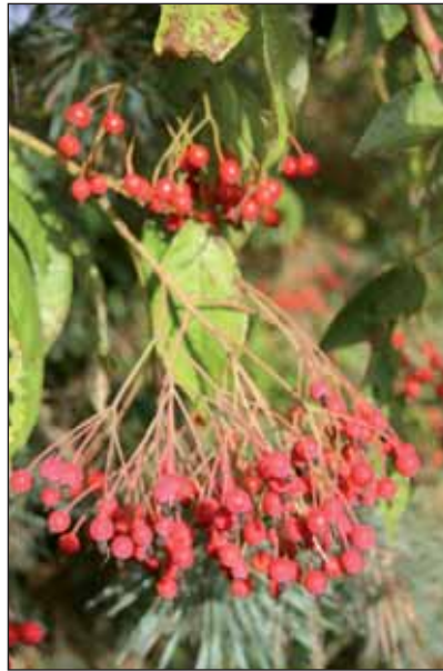
Les Vendéens choisissent leur rosier pour ses fleurs, ses épines ou ses fruits.