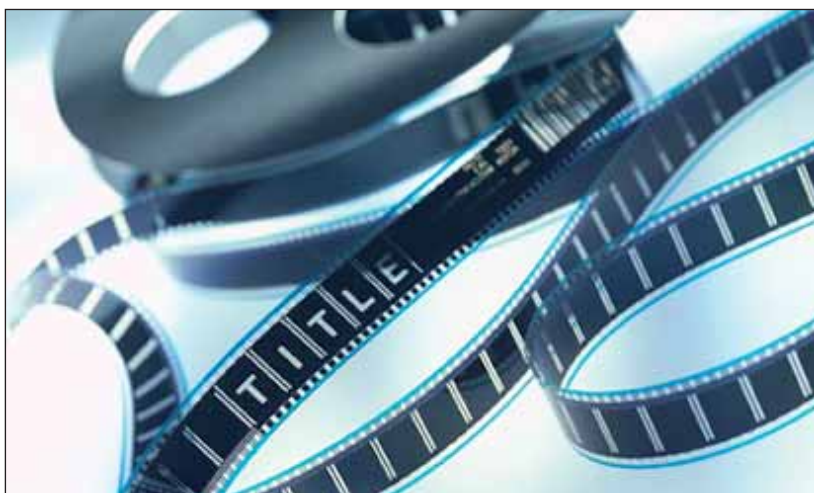
Les vieilles pellicules peuvent receler des trésors. Ne les jetez pas !

Vous possédez des documents filmés et vous souhaitez les donner ou les déposer aux Archives départementales ? Appelez dès aujourd'hui le 02 51 37 71 33 ou envoyez votre message par email à l'adresse suivante : archives@vendee.fr