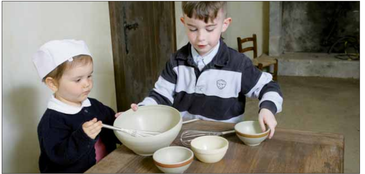
Des exercices pratiques ponctuent les journées à l'Ecole Départementale du Patrimoine.

Après une découverte accompagnée de l'espace Préhistoire, les élèves se retrouvent donc en salle d'activités. Intrigués par les films et les mises en scène, ils veulent en savoir plus sur les objets préhistoriques. La médiatrice de l'EDP amène alors au milieu de la salle une grosse malle. « Pour vous aider à comprendre le fonctionnement des différents outils que vous avez découverts dans les vitrines, nous avons créé des fac-