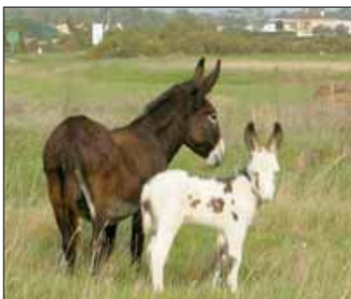
Serpolet et sa maman Inès.

■ Renseignements : 02 51 93 84 84. Tarifs : 6€, 3€ (-16 ans), gratuit - 7 ans. Ouvert de 14h à 18h, du mardi au dimanche.