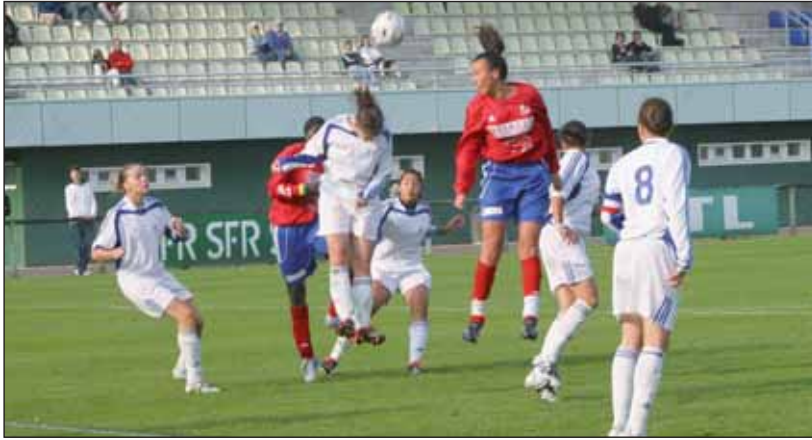
Les joueuses de l'Étoile Sportive Ornaysienne face à l'équipe de l'INF de Clairefontaine.