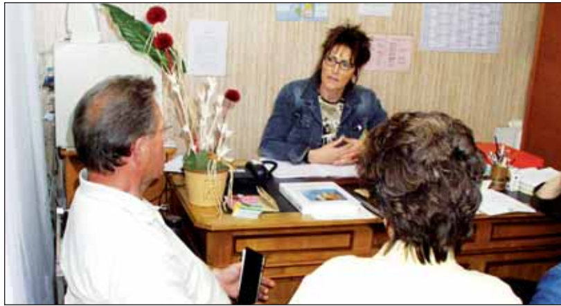
L'UNAFAM de Vendée accueille et écoute les malades psychiques et leurs familles.

D'ailleurs, savons-nous exactement ce que «troubles psychiques» sous-entend ? «Le souci, c'est que