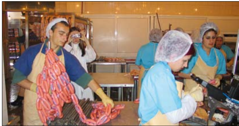
La Vendée soutiendra l'Arménie dans la mise en place de formations dans le domaine des métiers de la viande.

Plusieurs grandes pistes ont d'ores et déjà été retenues. Sur un aspect économique tout d'abord, puisque la Vendée, premier département français producteur de bovins et de volailles, a décidé d'apporter son expérience pointue aux Arméniens, qui ont de réels besoins en matière de formation de spécialistes des métiers de la viande. Par ailleurs, il a été convenu que la Vendée, particulièrement en pointe dans le secteur avicole, pourrait former les Arméniens aux techniques de transformation de la volaille.