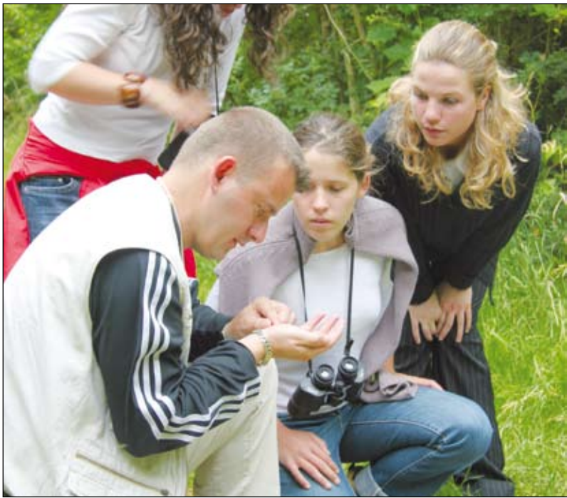
Deux circuits de visites guidées, animées par un spécialiste, vous sont proposés d'avril à septembre.

Tel : 02 51 30 96 22 Fax : 02 51 30 96 22 Email : reserve.nalliers.mouzeuil@cg85.fr