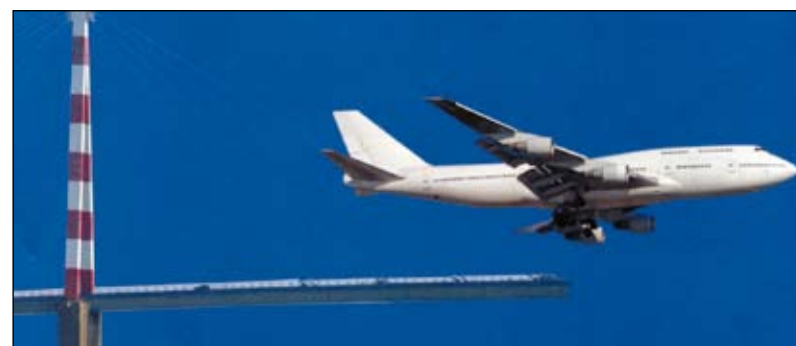
Un nouveau pont sur la Loire est indispensable à l'économie vendéenne.

L'Association pour le Franchissement de la Loire multiplie les actions pour obtenir une liaison routière pour fluidifier les accès entre le nord et le sud de la Loire.