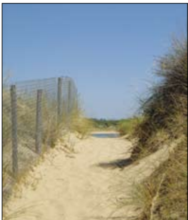
Protection des sentiers, une action à la portée de tous.

Marcheurs, randonneurs... En sillonnant les sentiers de randonnée vendéens, vous pouvez constater, chemin faisant, quelques incohéren-