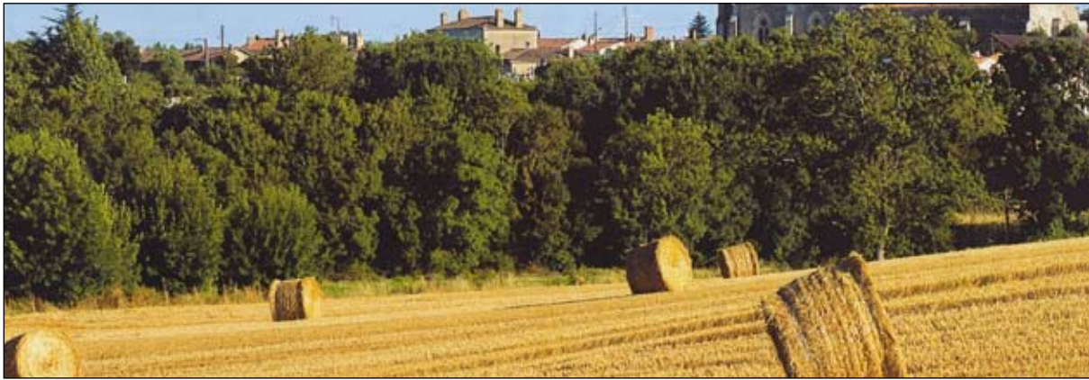
Dynamique et respectueuse de l'environnement, l'agriculture vendéenne fait figure d'exemple.

Au début du mois, le syndicat des Jeunes Agriculteurs a tenu son congrès national aux Sables-d'Olonne. L'occasion pour Philippe de Villiers de faire le point sur la situation du département et de dresser des perspectives pour un plus grande valorisation d'un métier pas comme les autres.