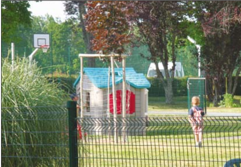
Le foyer Gilbert de Guerry permet aux enfants dont la vie familiale est difficile de se reconstruire.

Le foyer départemental de l'enfance a été rebaptisé foyer Gilbert de Guerry. Un symbole voulu par le Conseil Général en hommage au «père» de l'action sociale vendéenne.