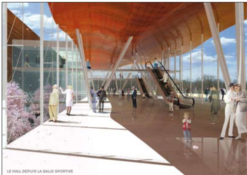
LE HALL DEPUIS LA SALLE SPORTIVE

en longeant une allée principale, bordée d'arbres et de verdure qui le mènera à de vastes parkings ombragés.