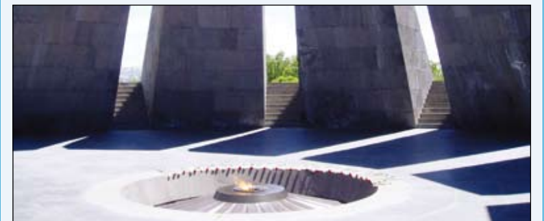
La délégation vendéenne est venue se recueillir au Mémorial du Musée du Génocide, à Erevan.