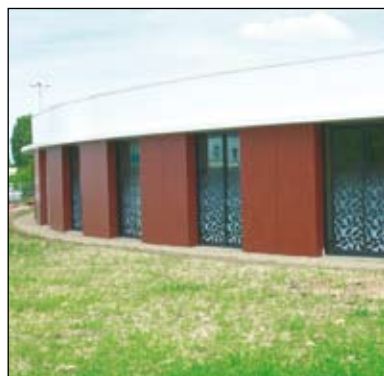
Un nouveau bâtiment de psychiatrie plus adapté.

conseiller général et maire de Challans. La première phase de travaux a concerné les locaux administratifs et les deux unités d'hospitalisation, c'est-à-dire les Courlis et les Plu-