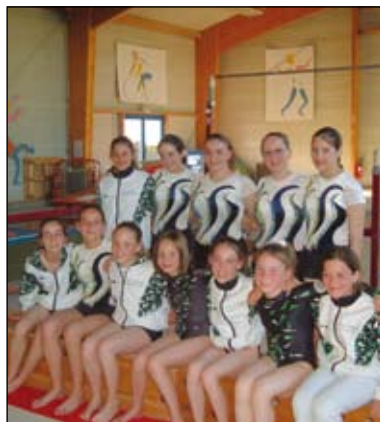
Les jeunes participantes au Championnat de France.

Le Club de l'Élan mortagnais a été créé il y a 17 ans. Ça fait donc presque deux décennies que les mortagnais, en majorité les filles, faut-il le souligner, multiplient les figures sur les différents agrès de gymnastique. Des entraînements qui ont porté leurs fruits cette année car deux équipes et une gymnaste du club vendéen