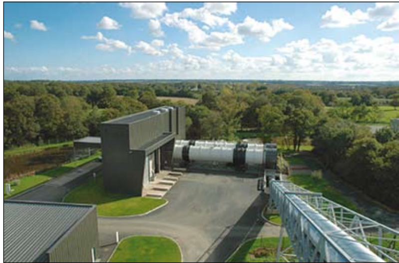
Le Tri Mécano Biologique permettra de réduire d'un tiers les déchets enfouis.

De plus en plus de collectivités suivent la voie de la Vendée en privilégiant le Tri Mécano Biologique (TMB) plutôt que l'incinération. Complémentaire au tri citoyen des usagers, cette technique permet de recycler la matière organique restante de nos déchets ménagers et d'enfouir un minimum de déchets stabilisés.