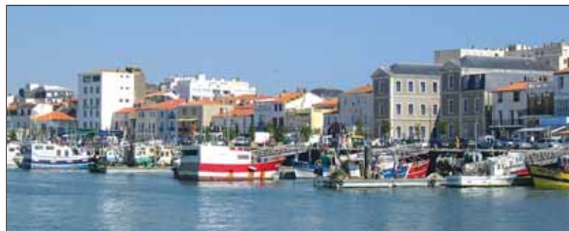
Avec ce réaménagement, les pêcheurs vont gagner en temps de déchargement.