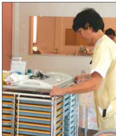
Le plan prévoit notamment de renforcer les équipes de personnel en cas de besoin.

consécutifs avec des températures de 20° à 6h et 34° à 16h), les établissements d'accueil pour personnes âgées et handicapées auront les moyens de recourir à du personnel supplémentaire, financé par le Conseil Général. Par ailleurs, une fiche de conseils sur les gestes de prévention à effectuer en cas de grosses chaleurs est diffusée largement sur l'ensemble du département. Enfin un numéro de téléphone (02 51 34 49 12) est disponible à toutes les personnes qui souhaitent s'informer sur la conduite à tenir. Actuellement, les maires de Vendée ont reçu la consigne de recenser toute personne fragile vivant seule ou à l'écart.