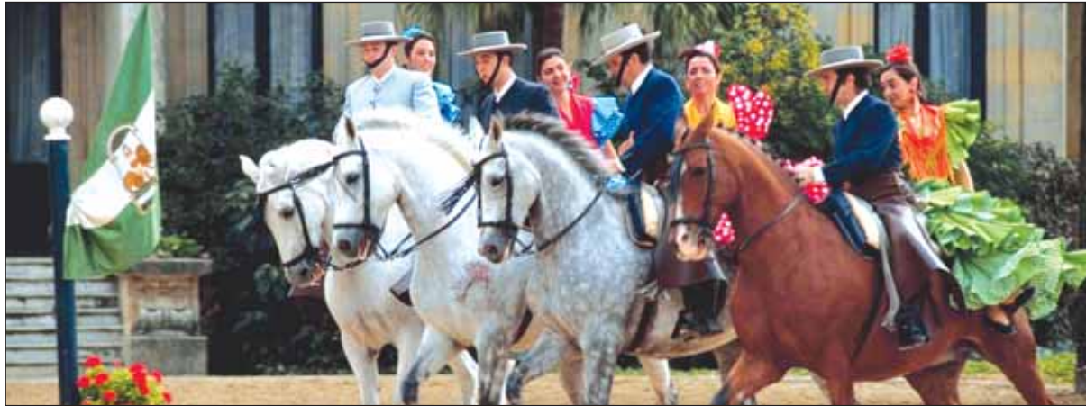
L'École Royale Andalouse d'Art Équestre, sera l'invitée vedette du festival Vendée Cheval.

■ Réservations à partir de mi-juillet : 02 51 34 46 66