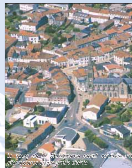
Le bourg de La Châtaigneraie devrait connaître une effervescence encore jamais atteinte.