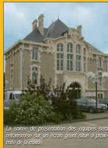
La soirée de présentation des équipes sera retransmise sur un écran géant situé à proximité de la mairie.