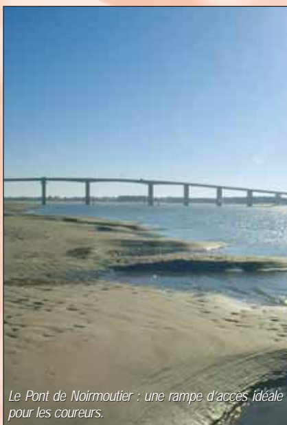
Le Pont de Noirmoutier : une rampe d'accès idéale pour les coureurs.