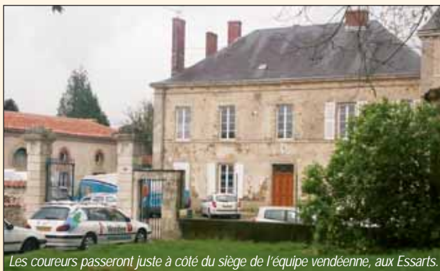
Les coureurs passeront juste à côté du siège de l'équipe vendéenne, aux Essarts.