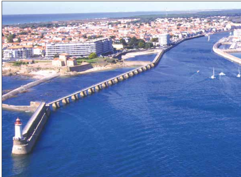
Le littoral vendéen, et notamment le port des Sables, constitue un véritable pôle d'attractivité.

travaille sur le seul canton des Olonnes. Mais chacun s'accorde à penser que plus largement, c'est tout le secteur du littoral vendéen qui possède les atouts pour conquérir les entrepreneurs. C'est pourquoi trois cantons (Les Sables d'Olonne, La Mothe-Achard et Talmont St Hilaire) se sont unis pour gérer ce nouveau vendéopôle dont les retombées profiteront à 27 communes et 115 000 habitants.