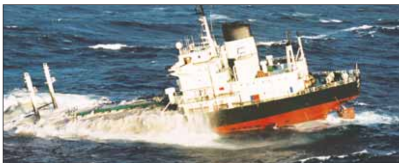
Le procès devrait avoir lieu dans un an.

soient jugés et que les victimes de la marée noire obtiennent la juste indemnisation qu'ils attendent depuis trop longtemps".