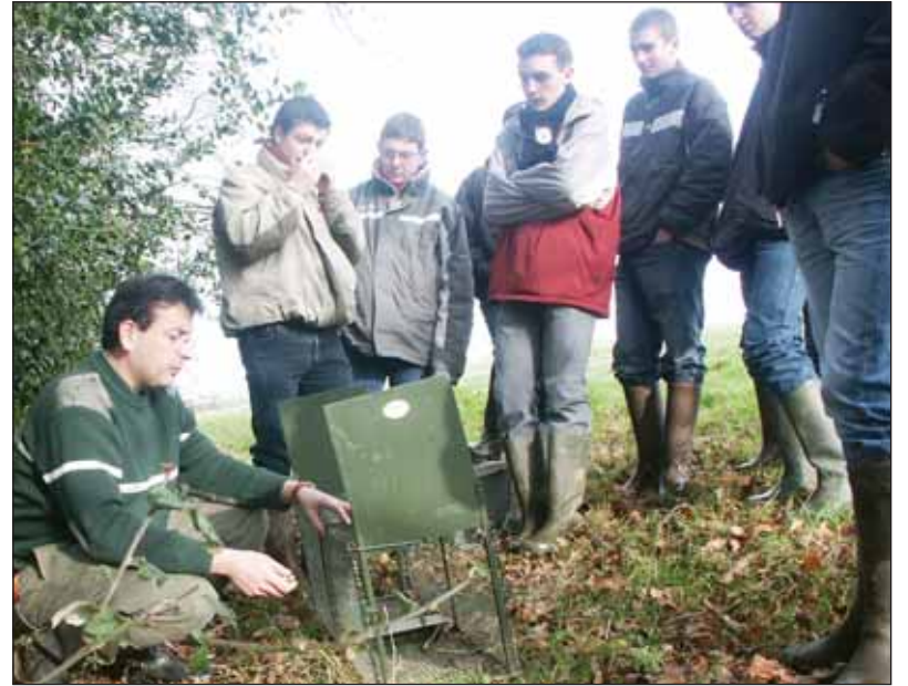
Le piégeage ne s'improvise pas et doit être mené en lien avec la Préfecture.

Le tour d'horizon se poursuit et les élèves découvrent désormais un troisième piège à ragondins : "Les cages-pièges sont plus simples à utiliser : ce sont en fait des cages grillagées dont les portes se ferment quand un animal entre". Inconvénient : "C'est plus simple et moins dangereux à utiliser, mais c'est plus encombrant lorsqu'il s'a-