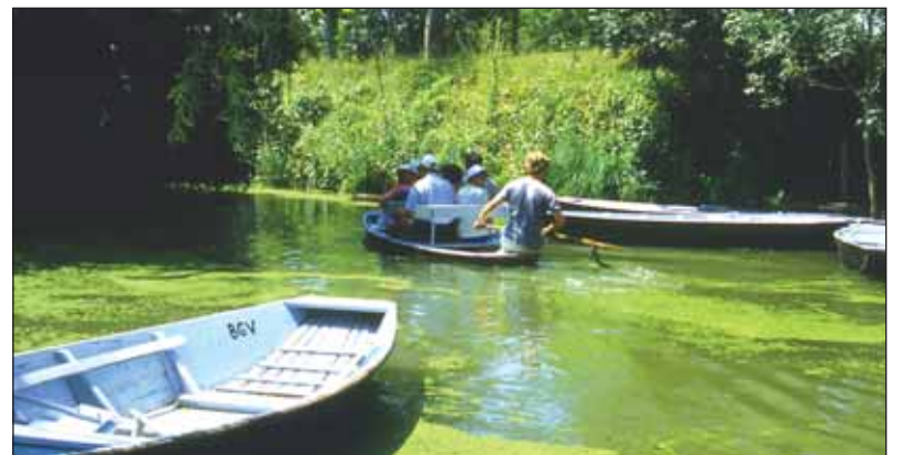
La présence d'un incinérateur au cœur du Marais Poitevin menacerait ce territoire d'exception.

Le Parc du Marais Poitevin s'oppose au projet d'installation d'un incinérateur à Coulon. Cette décision, prise à une très large majorité lors de l'assemblée générale du parc le 25 janvier dernier, a le mérite de mettre fin à l'ambiguïté qui planait depuis l'annonce du projet de la communauté d'agglomération de Niort. Malgré les risques sur un environnement fragile, malgré l'inquiétude des agriculteurs (qui étaient venus manifester sur place) et des populations proches du site retenu, Ségolène Royal, après hésitation, aura mis en effet longtemps à réagir. En acceptant de mettre aux voix la proposition présentée par le député du sud Vendée Joël Sarlot demandant que le Parc arrête une position ferme, la présidente du Parc clarifie enfin sa position en étant conduite à s'aligner sur la position prise une semaine plus tôt par le Conseil Général de Vendée (lire notre dernière édition). Mais le débat sur