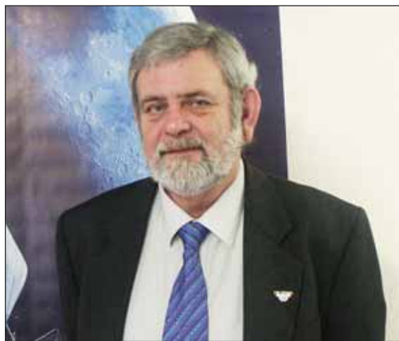
Le rêve du nouveau président : une médaille olympique vendéenne.

"Durant mon mandat, qui dure une olympiade (4 ans), je voudrais également me rapprocher du terrain pour recenser tous les équipements sportifs et les besoins des clubs. Il faut que tous les Vendéens aient les moyens de pratiquer leur sport dans des conditions optimales. Nous souhaitons d'ailleurs être spécialement aux côtés de ceux qui lancent de nouvelles disciplines comme les courses d'orientation, les randonnées VTT..." Bénévole entouré de bénévoles, le nouveau président tient enfin à ce que toutes ses équipes continuent à travailler dans une ambiance amicale, conviviale et efficace... "Sur les terrains comme dans les bureaux, l'ambiance sportive doit être la même".