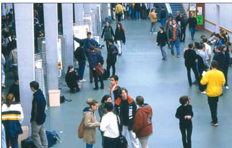
La décentralisation confiera au Département la gestion des personnels d'entretien des collèges.

En 2006, 2007 et 2008 en revanche, le Gouvernement lancera vraiment le processus. Concrètement, le Conseil Général aura alors en charge les personnels techniques des collèges et la gestion d'une grande partie du réseau routier national. Des charges nouvelles que le Conseil Général a anticipées, ce qui lui permettra de ne pas faire retomber leur financement sur la fiscalité.