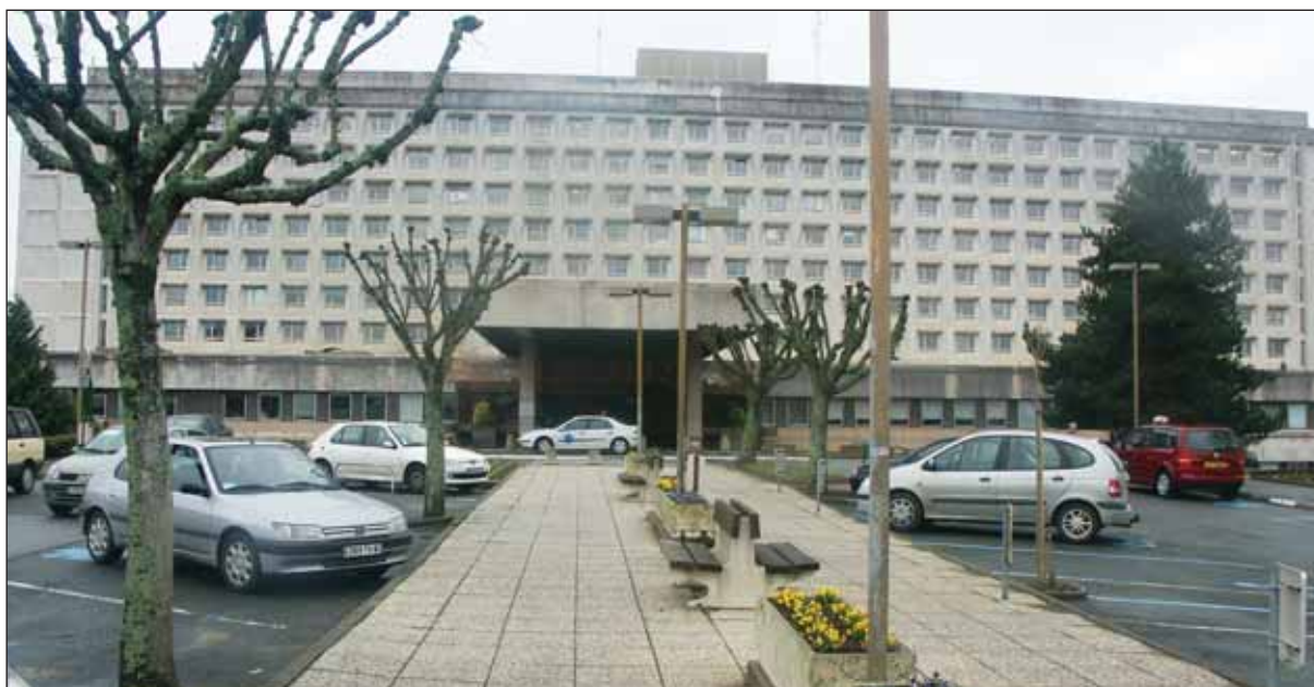
Le CHD : le centre d'un maillage efficace de l'offre de soins en Vendée.

contrebalancer la tendance à la concentration à Nantes des moyens sanitaires de pointe. Il pourra ainsi aider les hôpitaux de réseau de proximité à maintenir leur offre de soins. Afin d'optimiser les compétences de chaque hôpital, des groupes de travail se sont mis en place afin de définir des axes d'orientation. Les quatre territoires de santé devront fonctionner de telle sorte que l'offre vendéenne puisse répondre aux demandes de soins de toute la population.