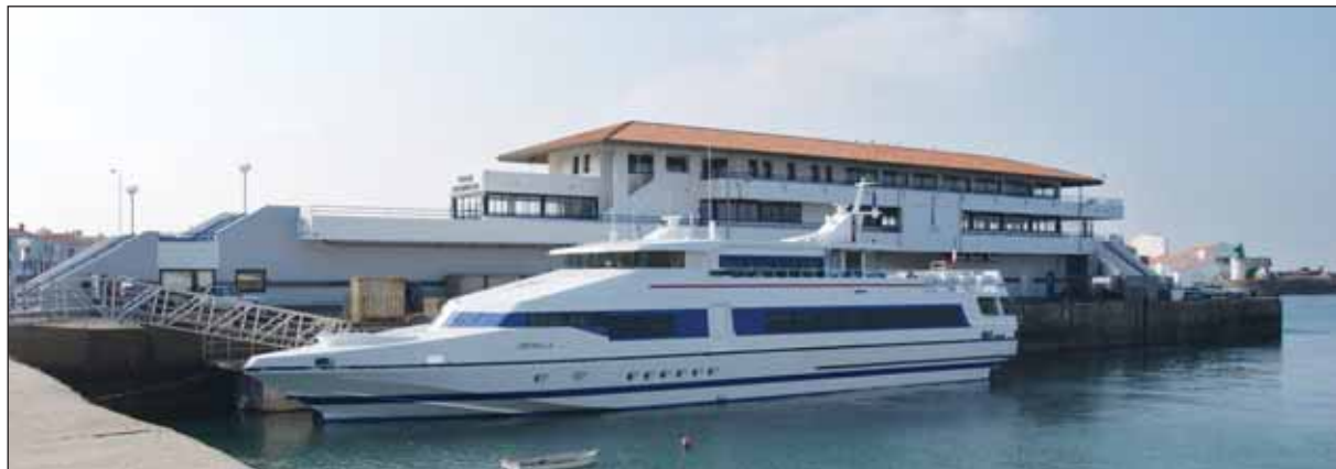
Dès octobre prochain, l'embarquement sera facilité par une séparation des flux de passagers et des flux de marchandises.

La nouvelle flotte départementale a été conçue pour répondre à tous les besoins exprimés par les Ialais. Afin d'accueillir dans les meilleures conditions les nouveaux catamarans, Port Joinville s'apprête à faire l'objet d'importants aménagements