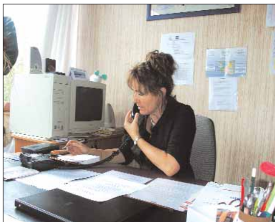
L'UNAFAM Vendée aide actuellement près de 120 familles.

Renseignements : 02 51 09 73 93 Permanences : tous les mercredis de 14h30 à 17h30 au CHS.