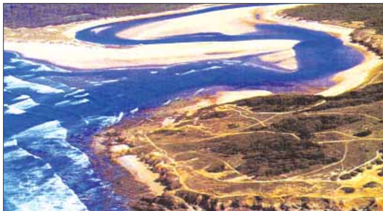
La pointe du Payré : l'un des sites géologiques vendéens les plus exceptionnels à préserver.