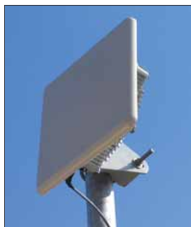
En 2005, tout le territoire vendéen sera couvert par le Wimax.