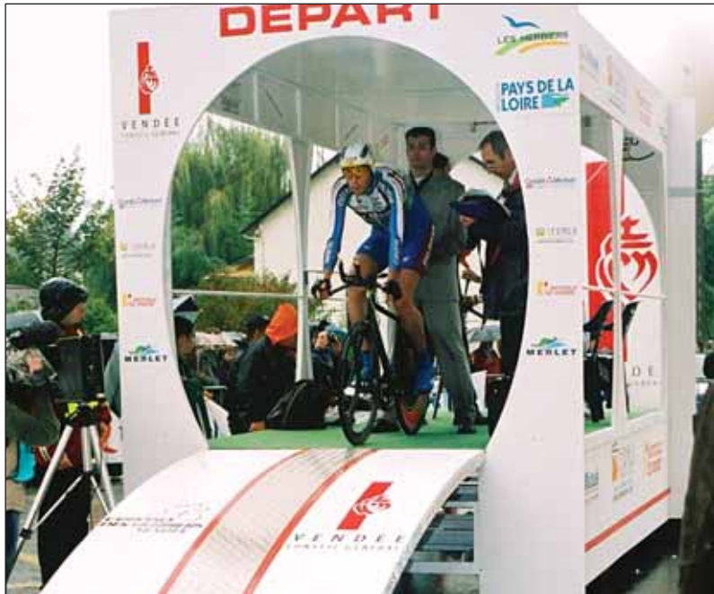
Toute les deux minutes, un spécialiste du chrono s'élancera de la rampe.

C'est le dimanche à 13h que le premier coureur cycliste junior plongera de la rampe montée rue Nationale, pour s'élancer à toute allure dans une course folle contre le temps. Toutes les deux minutes, un nouveau sportif casqué partira à son tour, avant que les dames n'arrivent, puis les espoirs et enfin les élites qui viendront de toute l'Europe pour participer à ce grand rendez-vous international. Mais le chrono des Herbiers, c'est également la foire et ses 10 000 m 2 d'exposition réunissant environ cent vingt exposants : commerçants, artisans, agriculteurs ou professionnels des métiers de bouche... Au hasard des étalages et des chapiteaux, on découvrira les derniers modèles de voitures présentés par