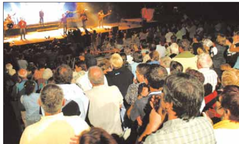
Les festivals : un label vendéen reconnu partout en France.

française, la plus importante (89%). La fréquentation étrangère est, quant à elle, en légère baisse mais beaucoup plus diversifiée. Si les Anglais sont moins présents, la Vendée attire de plus en plus de vacanciers venus d'Allemagne (20,3% des étrangers),