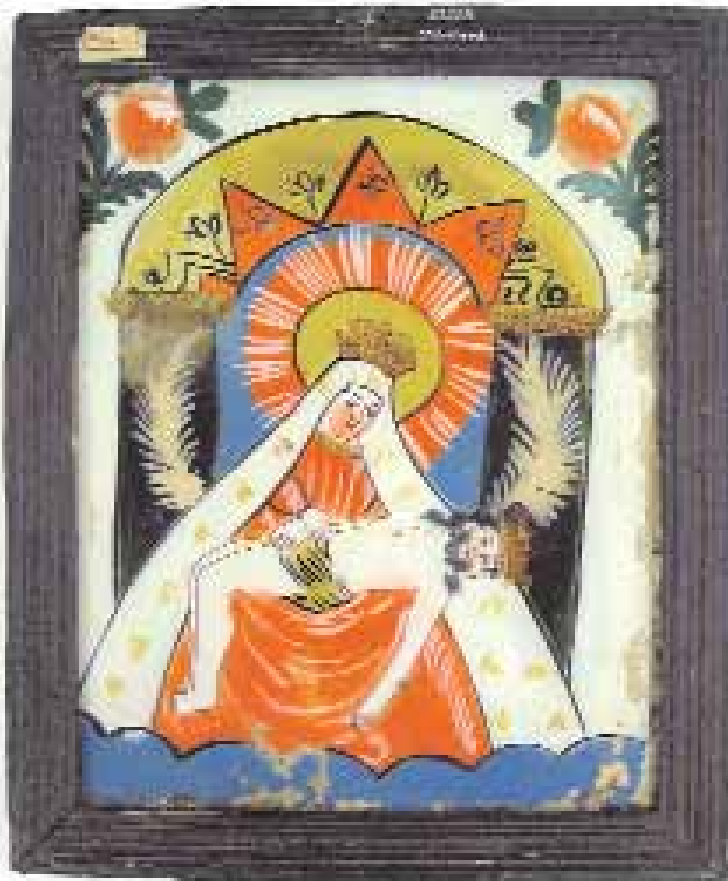
L'art slovaque : un mélange somptueux de flamboyance et de ferveur religieuse.

Après le succès rencontré l'an dernier par l'exposition d'icônes polonaises à Faymoreau, le Conseil Général poursuit son petit tour d'Europe et propose cette année aux Vendéens une exposition inédite d'œuvres slovaques, prêtées par le Musée de Dolný Kubín, dans la région de Zilina. Art populaire, baroque ou contemporain, peintures sur verre ou sur toile, sculptures en bois et en fil de fer... Cette exposition présentera un large panel de l'art slovaque, emprunt de traditions ancestrales qui perdurent au fil du temps. Siècle après siècle, ces œuvres exceptionnelles ont conservé chacune l'identité très forte des œuvres de l'Europe orientale. D'abord par les matériaux utilisés, le bois et le verre, puisque, bénéficiant de la proximité de la