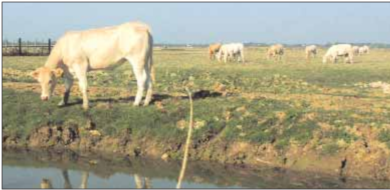
Après la vache cadeau, les agriculteurs peuvent-ils attendre du Parc une tondeuse, afin d'entretenir leurs prairies ?

ment ce que l'on nous avait promis, ensuite on verra. Et puis il faut faire preuve de bon sens. Je veux bien que l'on multiplie les prairies naturelles et les vaches dessus. Mais ces vaches, il faut bien les nourrir ! Comment fera-t-on sans droit à cultiver la terre ? Il faut tout de même être sérieux.