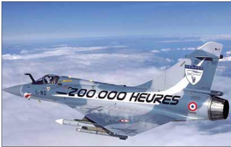
L'origine du nom de l'escadron Vendée reste à ce jour inexplicée.