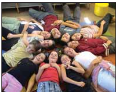
Les apprentis conteurs des cédéthèques : onze jeunes au talent prometteur.

Renseignements : Montaigu : 02 51 06 43 43 La Gaubretière : 02 51 57 49 00