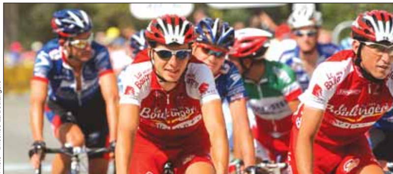
En 2003, Brioche La Boulangère a fait, sur la plupart des circuits, la course en tête.

"L'arrivée de Joseba Beloki sera pour nous un excellent accélérateur, et je suis persuadé qu'il s'entendra bien avec ses nouveaux équipiers qui sont aussi des battants. Pour lui et pour d'autres de l'équipe, l'objectif est de remporter le Tour de France... Mais Brioche la Boulangère sera présente sur les autres courses professionnelles. Et pour gagner !" a conclu Jean-René Bernaudeau devant les Vendéens venus acclamer leur équipe et accueillir Joseba Beloki. A n'en pas douter, ils seront nombreux à supporter leurs coureurs lors des prochains Tours de France, qui partiront de Liège en 2004 et... de Vendée en 2005.