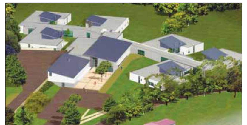
Cette maison accueillera dès décembre prochain une soixantaine de résidents.

l'autonomie est limitée, et des éducateurs se chargeront d'animer la maison et de proposer à ses résidents diverses activités. Dans les deux prochaines années, une structure similaire de quarante places devrait voir le jour à Longeville-sur-Mer pour offrir au plus grand nombre un suivi médical et un accompagnement permanent de qualité.