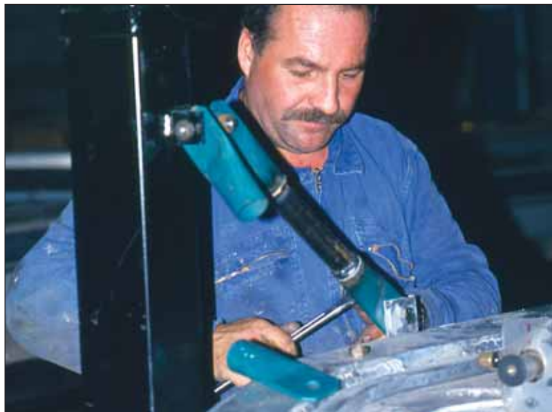
Le RMA complète les actions du Conseil Général qui permettent déjà à tous les Rmistes de bénéficier d'un contrat d'insertion.

A partir de cette année, une nouvelle aide à l'insertion est proposée par le Conseil Général : le RMA. Ce Revenu Minimum d'Activité a pour objectif de faciliter l'accès à l'emploi en aidant l'employeur pendant plusieurs mois.