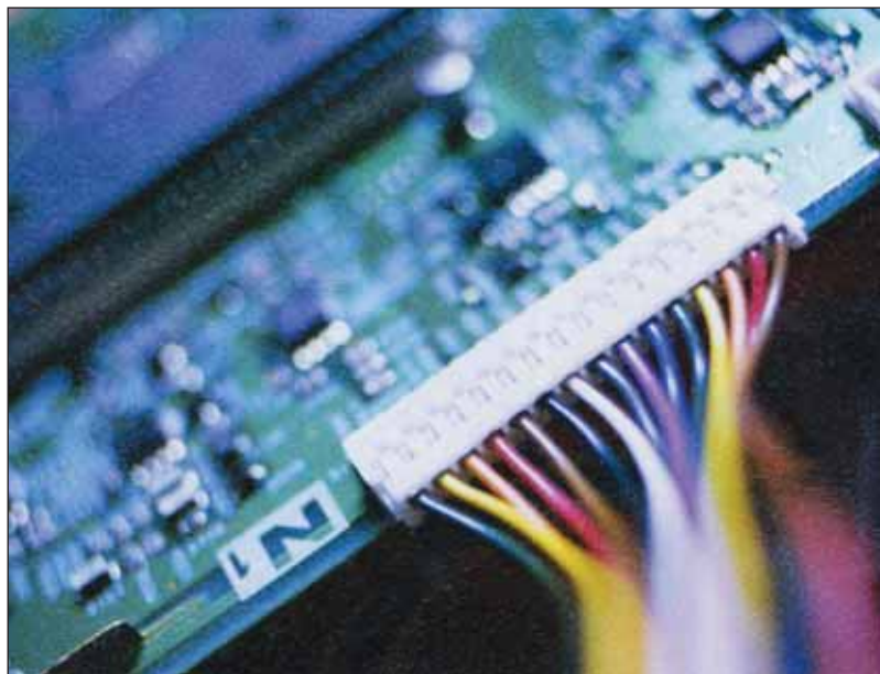
Dès cet été, les premiers raccordements au haut débit seront effectués.