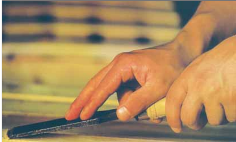
L'artisanat génère en Vendée plus de mille emplois par an et un chiffre d'affaires de 3 milliards d'euros.

L'artisanat vendéen est en forme olympique. Avec ses 29 150 salariés, il emploie aujourd'hui 16% de la population active vendéenne, contre 10% au niveau national. Il doit en partie sa croissance à une véritable dynamique de créations et de cessions d'entreprises. En effet, l'année 2003 fut un cru fameux puisqu'elle a enregistré 800 créations et reprises.