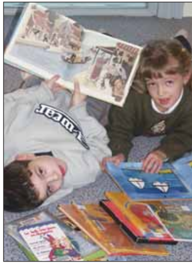
Les 24 et 25 janvier la cédéthèque organise des journées portes ouvertes.

Au premier étage, une grande salle, dotée d'un écran géant et d'un matériel de vidéo-projection et vidéo-transmission permettra d'accueillir différentes animations : projections audiovisuelles parmi un choix de 250 DVD, diffusions de chaînes documentaires reçues par satellite, expositions, concerts, spectacles, rencontres avec des auteurs ou éditeurs etc. Cet espace proposera également plusieurs cycles de conférences, de formations, de rencontres avec des personnalités du monde littéraire, historique, musical ou cinématographique. Les associations locales pourront également bénéficier de tous ces équipements, faisant donc de cette cédéthèque un service de proximité de grande qualité. Enfin, les salles du deuxième étage, pour l'instant impraticables, vont être parfaitement aménagées pour accueillir, dès l'année 2005, des expositions de grande envergure sur un espace de 250 m 2 .